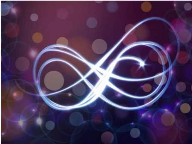
Símbolo do infinito

Todos nós já ouvimos ditados comuns: “Você colhe o que semeia”, “Quem semeia ventos colhe tempestades.” “Está a arranjar lenha para se queimar.”, etc. E, até certo ponto, o karma é realmente simples assim.