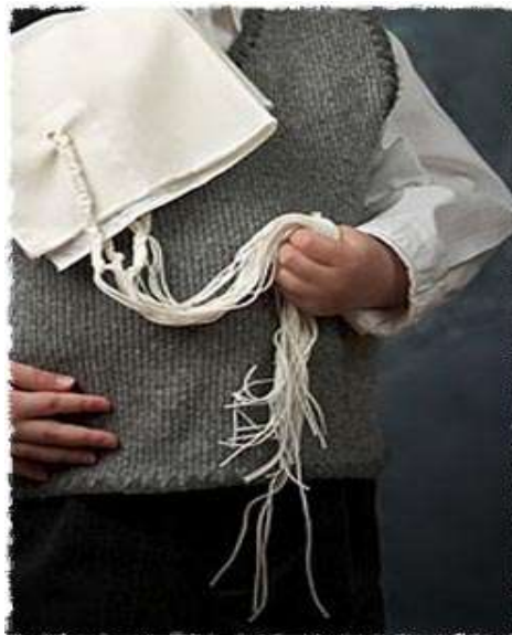
La kipa La Kipá

La Cabala enseña que el talit es una metáfora de la luz trascendientemente infinita de Di-s. Las franjas aluden a la luz divina inmanente que permea cada elemento de la creación. Al usar un talit gadol o un talit katan , el judío sintetiza esos dos elementos y los hace una realidad en su vida.