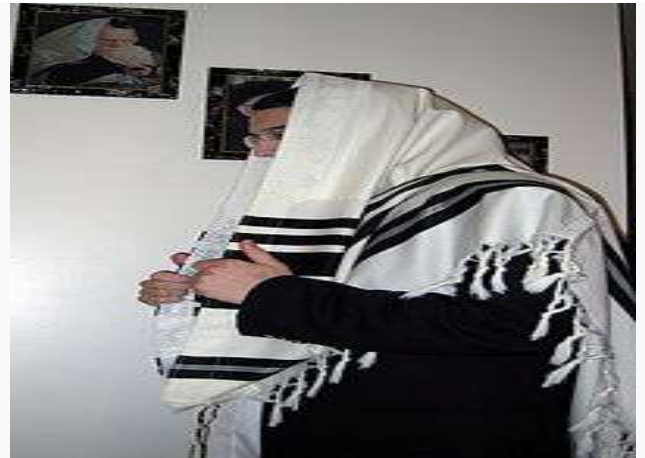
Judío portando un