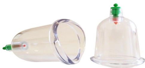
Ventosas de acrílico