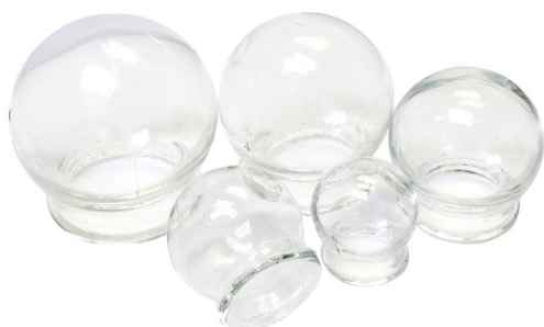
Ventosas de vidro