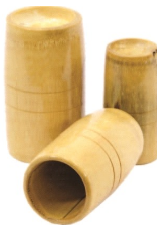
Ventosas de bambu