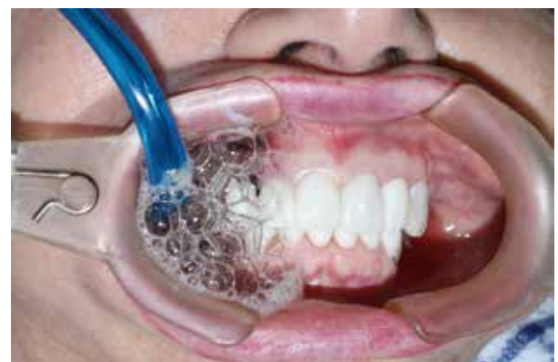
Figura 5. Agua ozonizada.

Una de las grandes ventajas que posee el uso de agua ozonizada como agente desinfectante es que posee una gran biocompatibilidad celular y tisular, mucho mayor que la de otros desinfectantes ampliamente utilizados en odontología como el hipoclorito de sodio o el digluconato de clorhexidina (15, 19) .