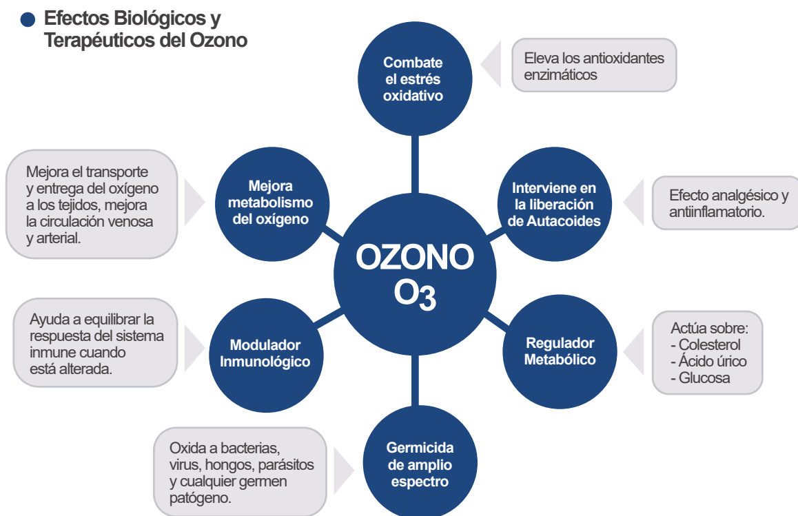
Figura 1. Efectos biológicos.

El presente artículo de revisión tiene como objetivo dar a conocer los beneficios del ozono, su aplicación en las diferentes especialidades odontológicas, especialmente periodoncia a través de su efecto antibacteriano, cicatrizante y regenerador.