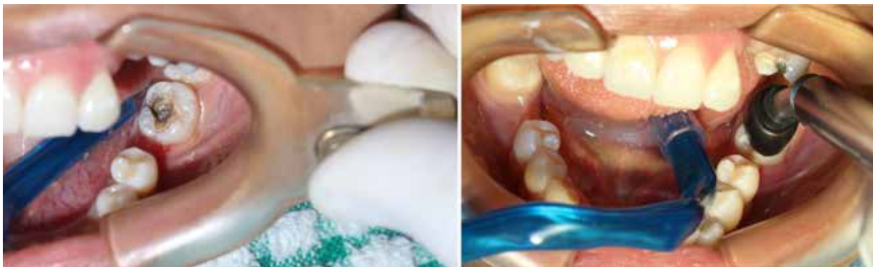
Figura 8. Caries dental.

silicona, que se aplica directamente al diente para que forme un sello hermético en el sitio de aplicación. El mecanismo de acción se debe a la capacidad de oxidación y destrucción de las membranas bacterianas, una aplicación de 20 segundos de ozono en forma gaseosa conduce a la destrucción del 99% de los microorganismos en las lesiones cariosas (2, 15, 21, 26) .