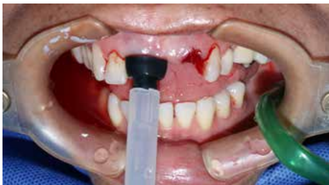
Figura 4. Ozono en gas.

Posee una gran capacidad germicida frente a bacterias, virus y hongos, debido a su alto poder oxidante (17, 18) . Normalmente se aplica en odontología a través de una aguja con una única salida apical. La efectividad del ozono gas es proporcional tanto a la concentración obtenida como al tiempo y a la velocidad de flujo con el que se insufla sobre el microorganismo en cuestión, así como al tipo y agregación en el que éste se encuentra (15) .