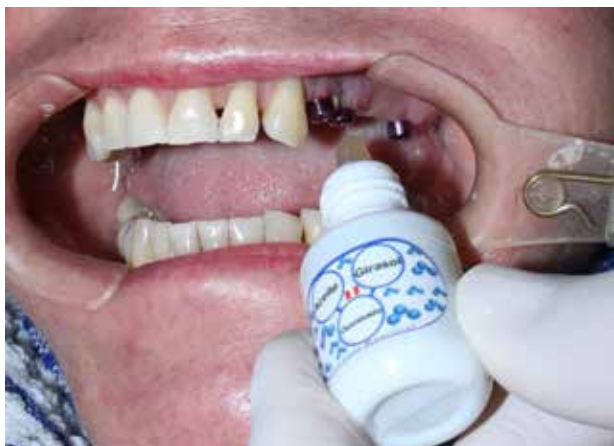
Figura 6. Aceite de ozono.

primeros estudios científicos que examinaron las biomoléculas encontradas en la caries dental, antes y después del tratamiento con ozono (15,21) .