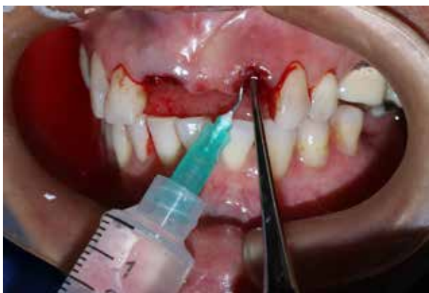
Figura 10. Periodoncia.

La enfermedad periodontal es una enfermedad multifactorial. Los surcos y las bolsas se irrigan con agua ozonizada para reducir la carga microbiana inicial y se inyectan con gas ozono. A los pacientes también se les da aceite ozonizado para aplicar tópicamente en el tejido blando (2, 15, 21, 25).