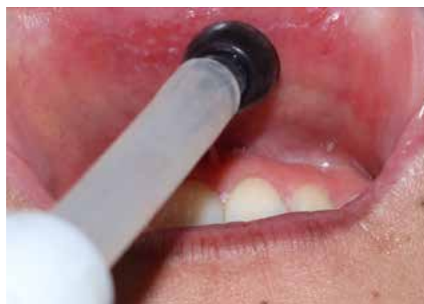
Figura 7. Medicina oral.

Las lesiones por herpes se trataron con la administración tópica del aceite ozonizado ozono, así como, la osteomielitis mandibular demostraron tiempos de curación más rápidos. El ozono, en estos casos, neutraliza los viriones del herpes mediante una acción directa, estimulando la curación de los tejidos a través de indicaciones circulatorias. Se ha demostrado que el ozono es uno de los oxidantes más potentes que podemos usar en odontología (25) .