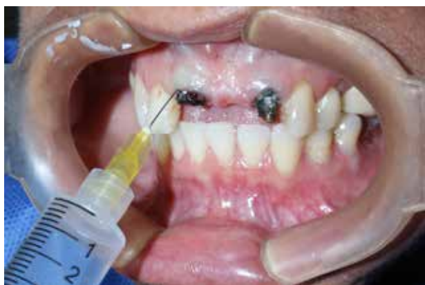
Figura 9. Prótesis.

La estomatitis de la prótesis puede controlarse mediante la aplicación tópica de aceite ozonizado sobre la superficie del tejido y sobre la superficie de la prótesis. Un estudio realizado por Arita et al (2005), demostró que la aplicación de agua ozonizada puede ser útil para reducir el número de Candida albicans en las prótesis. En algunos experimentos, las muestras de prueba se trataron con agua ozonizada en combinación con ultrasonidos. Después de la exposición a agua ozonizada que fluye (2 o 4 mg/ml) durante 1 minuto, las células de C. albicans viables eran casi inexistentes. La combinación de agua ozonizada y ultrasonidos tuvo un fuerte efecto sobre la viabilidad de C. albicans adheridos a las placas de resina acrílica (15, 21) .