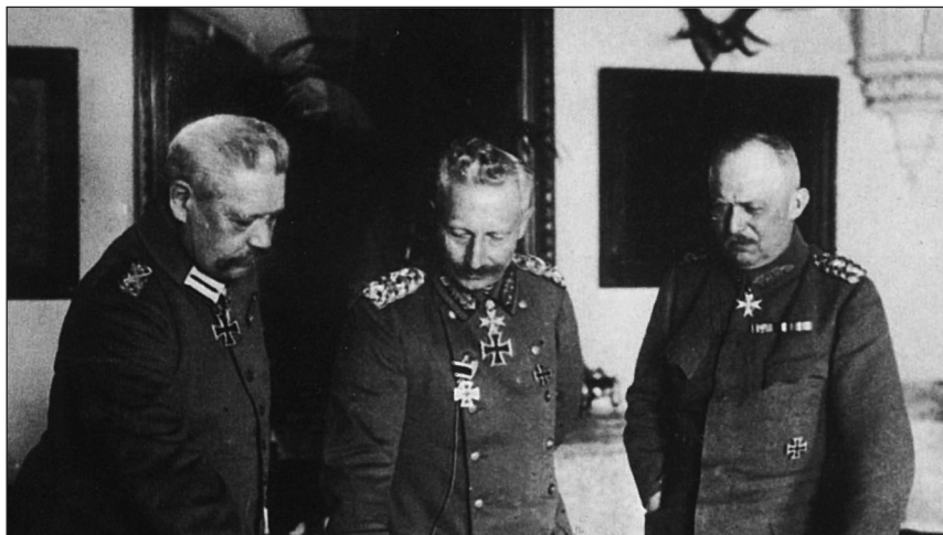
El Kaiser, Guillermo II, entre los generales Hinderburg y Ludendorff

A la espera de la llegada de las tropas norteamericanas a Europa, el frente occidental, durante 1917, continuó estancado. Lo que no impidió desgastadoras batallas, como las de Passchendaele, en el verano de 1917, donde los ingleses perdieron cerca de 400.000 hombres, o la batalla de Caporetto, en octubre del mismo año, donde los italianos sufrieron una dura derrota con medio millón de bajas, entre muertos y prisioneros. Sin embargo, donde los aliados progresaron fue en Oriente Medio. Allí, los ingleses entraron en Bagdad, en marzo, y su oficial “Lawrence de Arabia”, al frente de tribus árabes, tomó Aqaba, en julio, mientras que tropas inglesas ocupaban Jerusalén en diciembre.