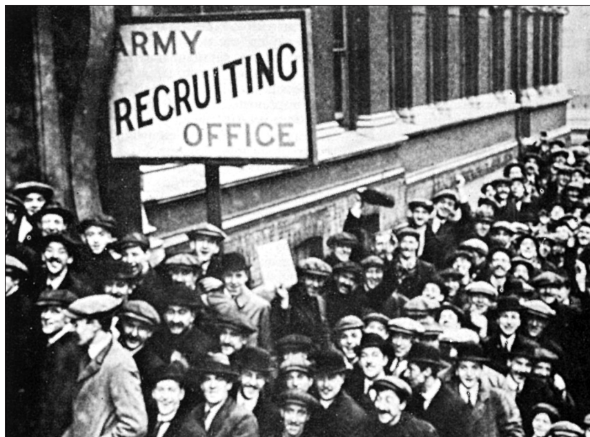
La guerra fue recibida con entusiasmo nacionalista

dido por amplia mayoría el inicio de la contienda, ahora se enfrentaban en significativas disensiones. Así dirigentes del Partido Socialista Alemán exigían la vuelta al objetivo revolucionario y la oposición a la guerra, lo que provocó, en abril de 1917, su escisión. El nuevo Partido Social Democrático Independiente (USPD), cuyo primer presidente fue Hugo Haase, contó con la adhesión de los “espartaquistas” –que tomaban el nombre de Espartaco, el esclavo que se levantó contra el Imperio Romano–, Karl Liebknecht y Rosa Luxemburgo. Entre las pretensiones del nuevo partido figuraba el fin de la contienda sin ningún tipo de beneficios territoriales para Alemania.