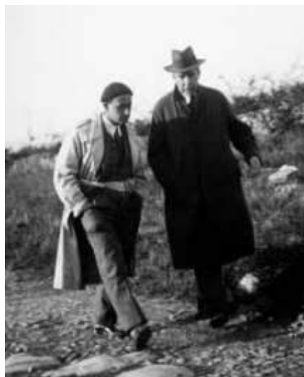
Enrico Fermi e Niels Bohr