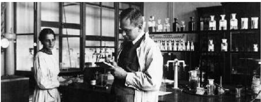
Lise Meitner e Otto Hahn