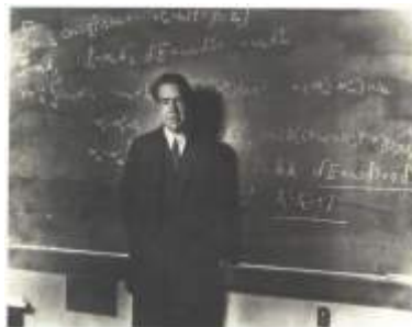
Niels Bohr, estudou o problema da estabilidade do átomo.

*Quantum produto da constante de Planck pela frequência da radiação. A idéia original da teoria de quantum é de Max Planck (1901) e foi utilizada no estudo da radiação do corpo negro.