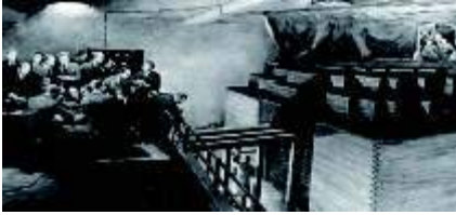
1º Reator Nuclear**

Universidade de Colúmbia para Universidade de Chicago, onde era professor. Formou uma grande organização, concentrada em Chicago, que tomou o nome de