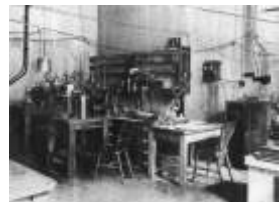
Laboratório de Rutherford

Resultados dos desvios das trajetórias, as partículas alfa permitiram o estabelecimento do seu modelo nuclear, que é análogo ao nosso sistema planetário. O núcleo central é positivo, e em torno dele gravitam partículas negativas: os elétrons.