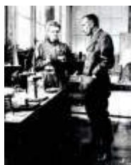
O casal Curie

O casal Curie já explicava a radioatividade como uma propriedade atômica. Ajudados por Bemont, separaram quimicamente vários elementos radioativos e descobriram, em 18 de julho de 1898, o Polônio, nome que foi dado em homenagem à pátria de Maria Slodowska Curie. O rádio foi descoberto por Madame Curie em 1910 após longo trabalho, já que, para extrair 1 grama do elemento, teve que tratar aproximadamente 10 toneladas de mineral.