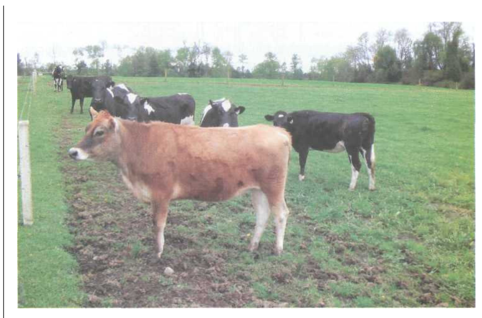
Figura 2. La heterosis se ha utilizado en el último tiempo como una herramienta de mejoramiento para la producción de leche.