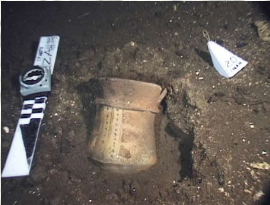
Algunos ritos mayas incluían el arrojar vasijas suntuarias a las aguas de los cenotes.

Uno de los rituales más conocido con relación a los cenotes era el denominado Chen Ku, que consistía en arrojar víctimas a sus aguas, como en el ya mencionado caso del Cenote Sagrado de Chichén Itzá. En términos arqueológicos esto ha sido nombrado genéricamente como inmersión ritual de los sacrificados en cenotes . Fray Diego de Landa relató que arrojaban personas vivas al cenote de Chichén Itzá, creyendo que salían al tercer día, aunque nunca más aparecían. Este cronista también menciona que durante ciertas fiestas se elegían sirvientes y niños para el sacrificio.