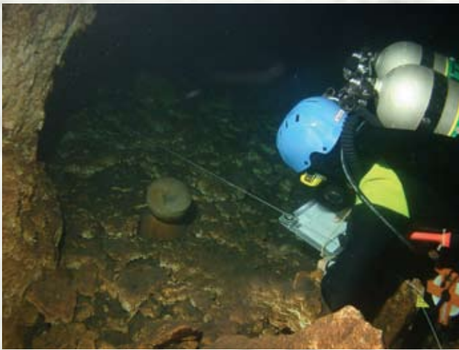
Registro de una vasija en el fondo de un cenote mediante el sistema de línea base, rumbo, distancia y profundidad. Cada vasija se marca con una bandera, se registra en foto y/o video y con los datos de posición se elabora un mapa general.

En el estado de Quintana Roo se localiza otro sitio más, también de interés para la arqueología, el cual es una cueva, por la que hay que descender con cuerdas, cuidándose de las avispas guardianas que formaron su panal en la entrada. Una vez abajo una extensa comunidad de murciélagos habita pendiendo de las raíces que semejan cables que van de una pared a otra. Al caminar por la pendiente en descenso en la oscura cueva se perciben escalones elaborados con las rocas, habilitación realizada por los mayas; hay que tener cuidado porque en el piso se ubican gran cantidad de fragmentos de cerámica. En la parte más baja de la cueva se localizan dos pequeños cuerpos de agua; por uno de ellos se comienza el buceo. La cueva continúa de esta manera pero inundada y en el fondo yacen más de 20 vasijas de cerámica. Algunas de ellas tienen formas de ollas, lo cual evidencia su uso como contenedores para la colecta de agua, pero muchas otras están decoradas con incisiones y presentan formas de mayor elaboración, lo cual nos hace pensar en su selección como ofrendas. Al interior de éstas vasijas más elaboradas se localizaron restos de carbón, es decir que fueron utilizadas para ritos especiales.