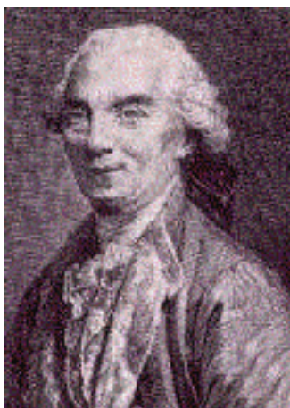
Georges-Louis Leclerc de Buffon

Durante el siglo pasado también se realizaron algunos de los grandes viajes científicos que permitieron un conocimiento más metodológico de los paisajes geográficos de los diversos continentes, ejemplo entre otros, del Conde de Buffon, autor de los primeros tratados de Biología y Geología; o Alexander von Humboldt, quien exploró y estudió durante cinco años las tierras de América Latina; fue el primero en considerar las plantas en relación con su ambiente.