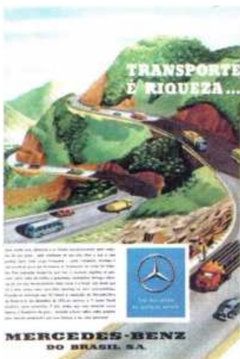
Propaganda automobilística – Década de 60

A partir da segunda metade da década de 50 - do século XX-, o modelo de industrialização brasileiro, caracterizado pela substituição das importações entrou em crise. É correto afirmar que tal crise está relacionada: