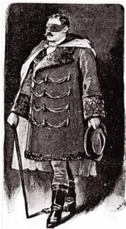
Sidney Paget, cortesia The Camden House

Logo surgiu um homem que não tinha menos de dois metros de altura, com peito e músculos de um Hércules. Vestia-se de um modo tão luxuoso que, na Inglaterra, seria considerado de mau gosto. As mangas e a frente dupla do casaco eram ornamentadas com largas faixas de astracã, enquanto a capa azul-escura, que estava sobre os ombros, era forrada de seda cor de fogo e presa ao pescoço por um broche constituído por um berilo flamejante. As botas chegavam até metade das pernas e,