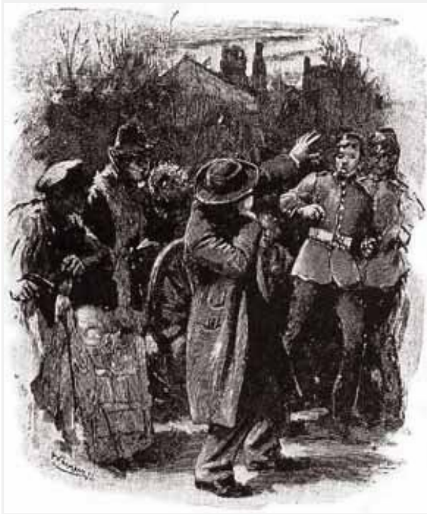
Sidney Paget, cortesia The Camden House

— Não será possível. Mas, escute, ouço o rodar do carro dela. Agora cumpra as minhas ordens.