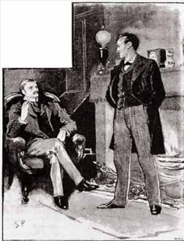
Sidney Paget

— O casamento foi bom para você — disse ele. — Creio, Watson, que você pesa mais três quilos e meio desde a última vez que o vi.