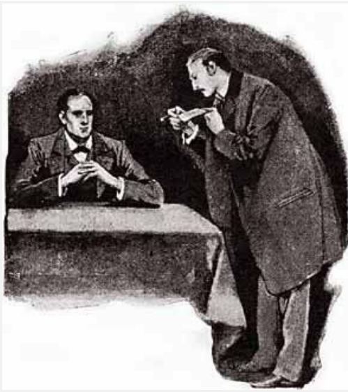
Sidney Paget, cortesia The Camden House

Examinei cuidadosamente a caligrafia e o papel.