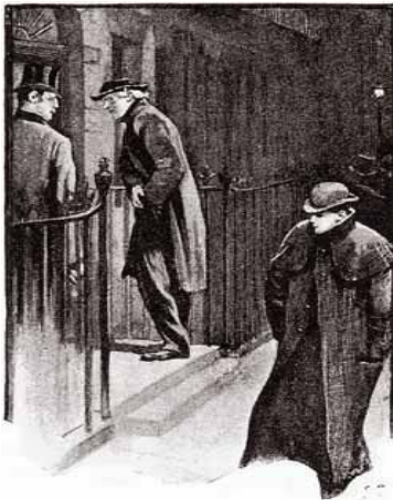
Sidney Paget

— Às oito da manhã. Ela ainda não terá levantado, e assim teremos o campo livre. Além disso, precisamos não perder tempo, porque este casamento pode modificar completamente a vida dela e os seus hábitos. Vou telegrafar ao rei sem demora.