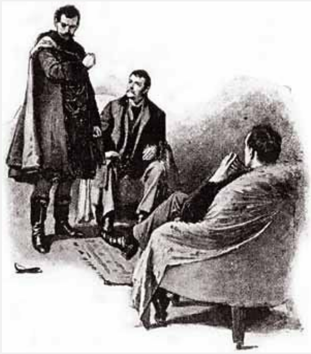
Sidney Paget, cortesia The Camden House

— Se Vossa Majestade condescendesse em dizer qual é o seu problema — disse ele —, poderia ajudá-lo melhor.