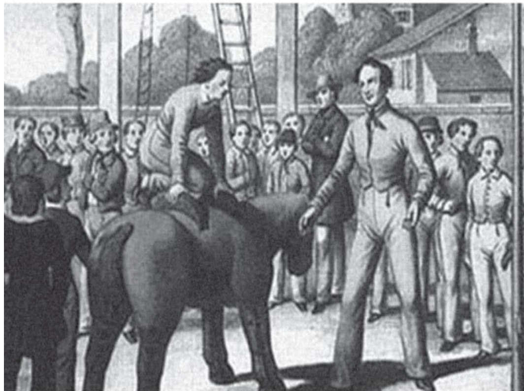
Figura 3: Ginásio ao ar livre na Prússia, no início do século XIX