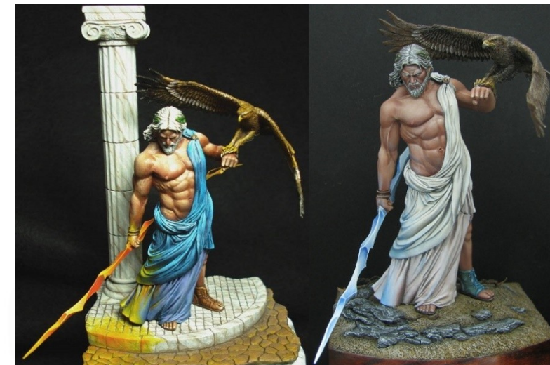
Zeus, Deus supremo dos antigos gregos

De fato, os mesmos a conceberam como uma forma de busca por corpos e mentes sãos, dando à modalidade um papel fundamental na busca do equilíbrio entre aptidões físicas e intelectuais. Além disso, a valorização grega do ideal de beleza humana favoreceu ainda mais a evolução da ginástica, uma vez que sua prática era vista como uma forma de cultuar o corpo.