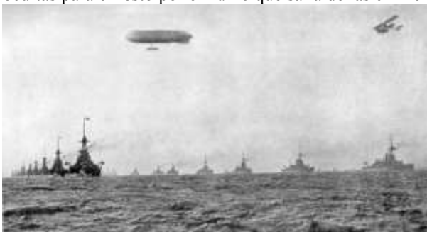
La Gran Flota Británica formando en líneas paralelas.

En esta época, la disposición típica para una batalla naval consistía en disponer la flota en columnas paralelas, con los barcos moviéndose en fila india para permitir una gran maniobrabilidad. Muchas columnas cortas podían cambiar más rápidamente de dirección que una grande y única, al tiempo que mantenían la formación. Este sistema también garantizaba mejores comunicaciones en una época en que las órdenes se daban rara vez por radio (invento muy reciente), prefiriéndose el uso de las tradicionales banderas y focos luminosos. En caso de avanzar en una sola gran columna, los últimos barcos podían tardar 10 minutos o más en recibir las señales del buque insignia (normalmente situado a la cabeza de toda la flota), ya que cada barco debía identificarlas y repetirlas para el siguiente, puesto que quedaban ocultas para el resto por el humo que salía de las chimeneas.