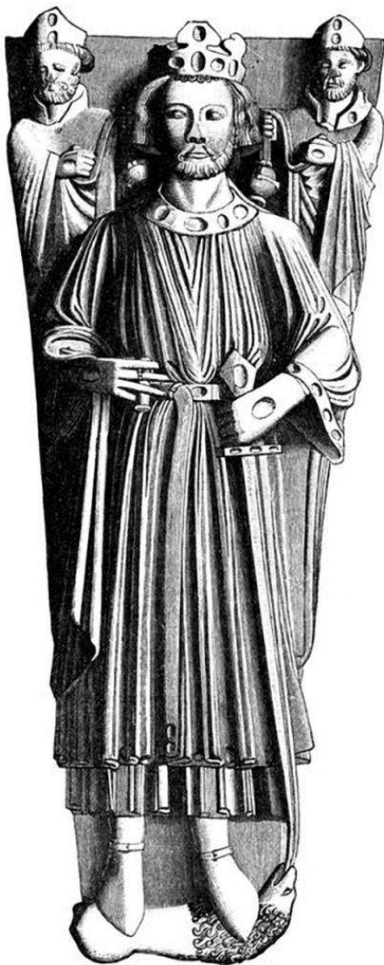
Tumba de Juan I en la Catedral de Worcester

A partir de entonces la ley común o common law será la que impere en todo el país, los tribunales que impartían justicia se reemplazan por jurisdicciones señoriales que aplicarán el derecho local, las Court Barons , así como las jurisdicciones eclesiásticas aplicarán el derecho canónico. El rey por su parte impartirá justicia en los casos en que la paz del reino pueda estar amenazada o si los tribunales de justicia se veían impedidos para impartirla. Esta Curia Regis solo estaba al alcance de unos pocos ya que no era una jurisdicción ordinaria. Las dinastías normandas y angevinas por medio de un incipiente aparato burocrático dentro de un sistema feudal, fortalecieron la idea de una monarquía suprema presente en todo el territorio que gracias a la organización financiera, pudieron asentar.