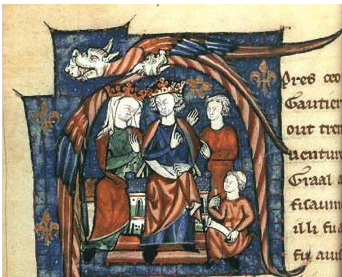
Leonor de Aquitania y Enrique II

Hubert procurará engrandecer la herencia de Enrique II –padre de Ricardo I y Juan I- a lo largo de los reinados de sus dos hijos, a base de aumentar las rentas reales, por medio de los danegeld para las contiendas con Francia, de los scutages , y del aumento de tributos a los judíos de York y Londres. Hubert Walker es un nombre fundamental en la reforma administrativa entre los reinados de Ricardo I y Juan I, ya que reorganizó y puso en marcha el sistema de inscripción de privilegios y ordenanzas similar al que se utilizaba en la elaboración de rollos en el exchequer [2] , tesorería al que rendían cuentas los sheriffs de los condados. Tras la muerte de Ricardo en 1199 en suelo francés por la pugna de los territorios ingleses en Francia, comienza la disputa por el trono inglés entre Arturo I Duque de Bretaña, sobrino de Ricardo I, supuesto sucesor suyo, y Juan I.