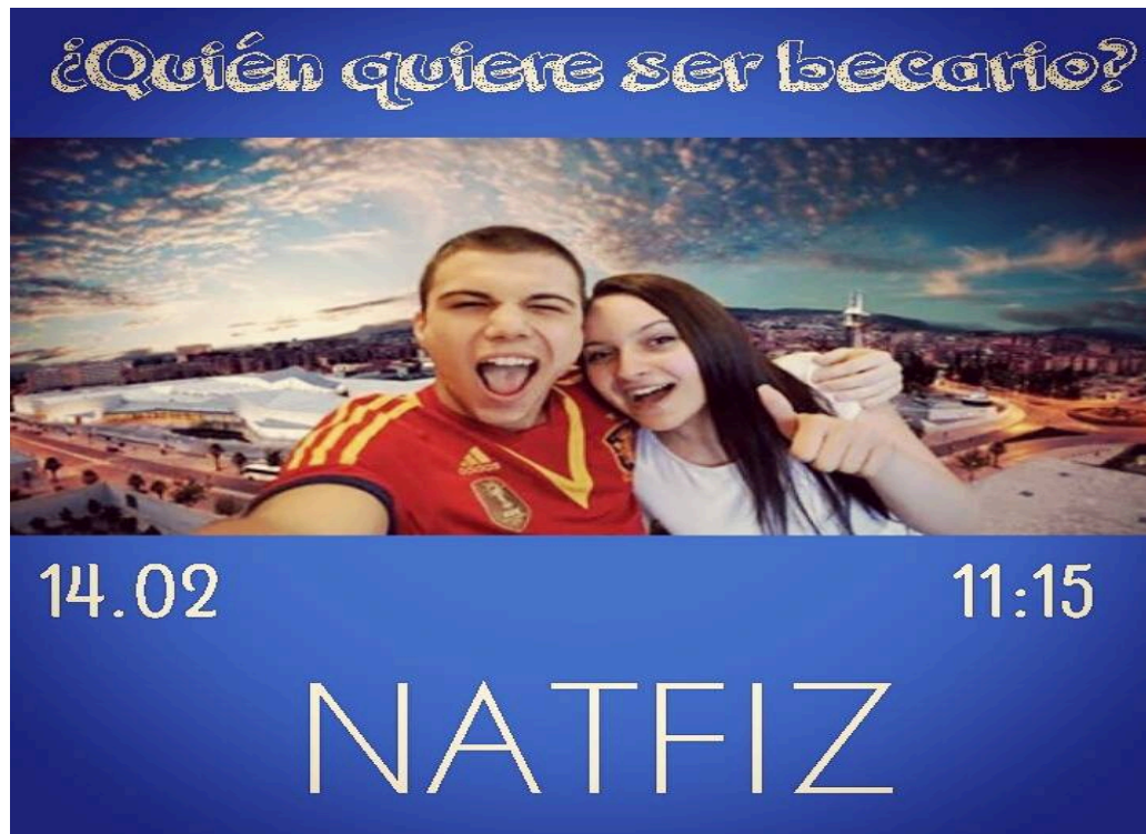
FOTO DE PORTADA O PROGRAMA