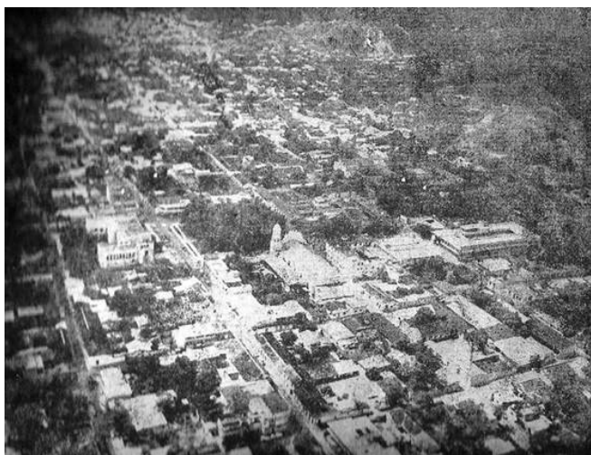
Figura 2. Vista del paisaje Guanareño (1960)

Aquí se tiene una imagen en blanco y negro con un matiz difuso para la observación geográfica, este momento histórico del paisaje evoca un espacio menos urbanizado con mayor presencia de árboles, donde se aprecia una delimitación al norte de la ciudad por las elevaciones transicionales del pie de monte andino-llanero.