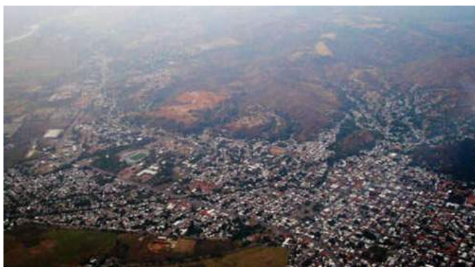
Figura 4. Panorámica del paisaje Guanareño (2012)

Esta fotografía ilustra un segundo momento en la evolución histórica del paisaje Guanareño, allí se observa desde el edificio conocido como sede de la Alcaldía del Municipio Guanare, con una perspectiva al oeste de la ciudad que refleja abundante vegetación, árboles y reducida infraestructura urbana.