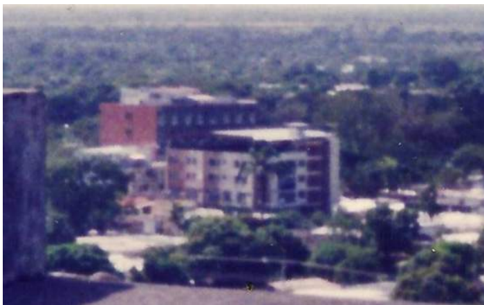
Figura 3. Panorámica del Paisaje Guanareño (1992)

Esta fotografía ilustra un segundo momento en la evolución histórica del paisaje Guanareño, allí se observa desde el edificio conocido como sede de la Alcaldía del Municipio Guanare, con una perspectiva al oeste de la ciudad que refleja abundante vegetación, árboles y reducida infraestructura urbana.