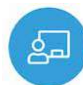
La prévention et l'éducation pour la santé