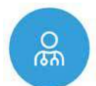
Consultation et examen clinique

Les internautes et participants aux forums régionaux ont donné leurs avis sur des propositions identifiées par l'Ordre relatives à cinq grands thèmes.