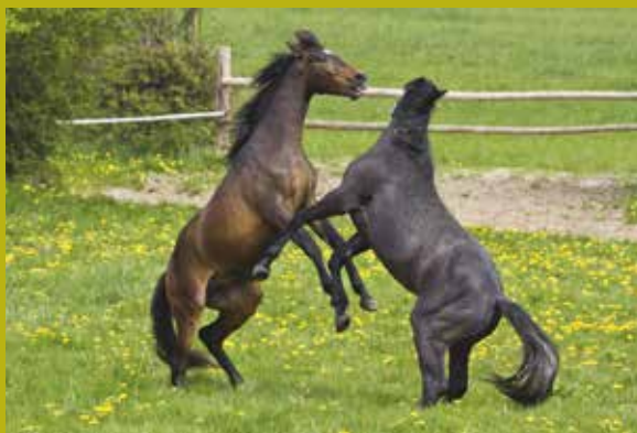
Des chevaux qui jouent.