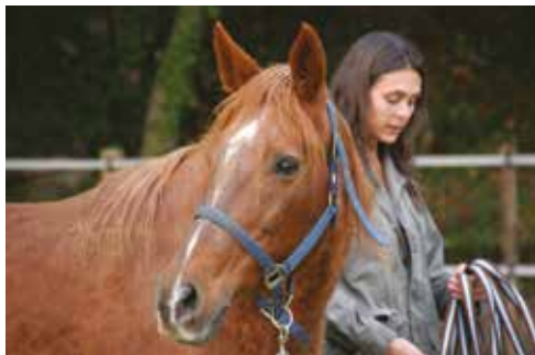
L'inattention de l'homme et du cheval l'un envers l'autre est source d'accident.

L'éducation du cheval demande de l'attention : le cheval n'obéira que s'il perçoit une attention chez la personne avec qui il interagit !