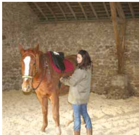
Pour mieux apprendre, il faut privilégier les endroits calmes sans stimulations externes.