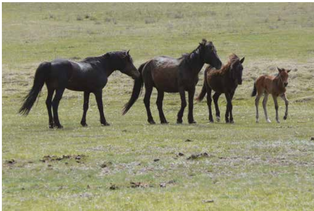
Une famille de chevaux en milieu naturel.

(moins visible), dont le but est d'éviter les conflits. Les animaux dominants ont un accès privilégié à une ressource donnée quand elle est restreinte. Le statut de chacun étant connu, des signaux subtils (position des oreilles par exemple) suffisent pour éviter les conflits. Un cheval peut être dominant pour certaines ressources et pas d'autres ; il peut être « dominant » dans un groupe et « dominé » dans un autre.