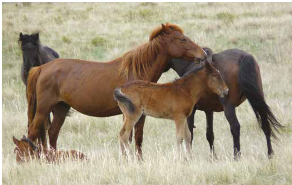
Des poulains en milieu naturel.

En conditions domestiques, il y a souvent des interventions humaines autour de la naissance et le sevrage se fait de manière précoce, s'accompagne d'une séparation de la mère, voire d'isolement. Le stress de séparation du poulain est très visible. Après sevrage les jeunes sont gardés en groupes de même sexe, même âge ce qui restreint leurs expériences sociales.