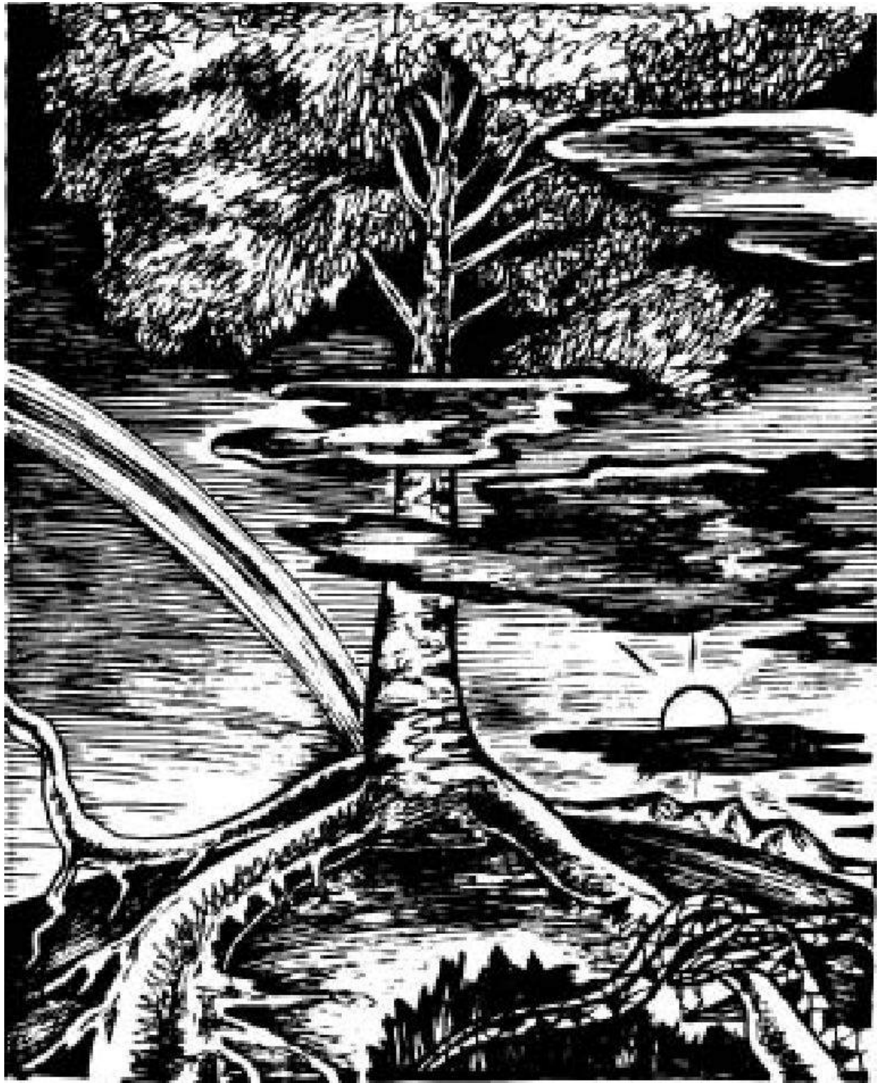
YGGDRASIL LE FRENE AXE DU MONDE