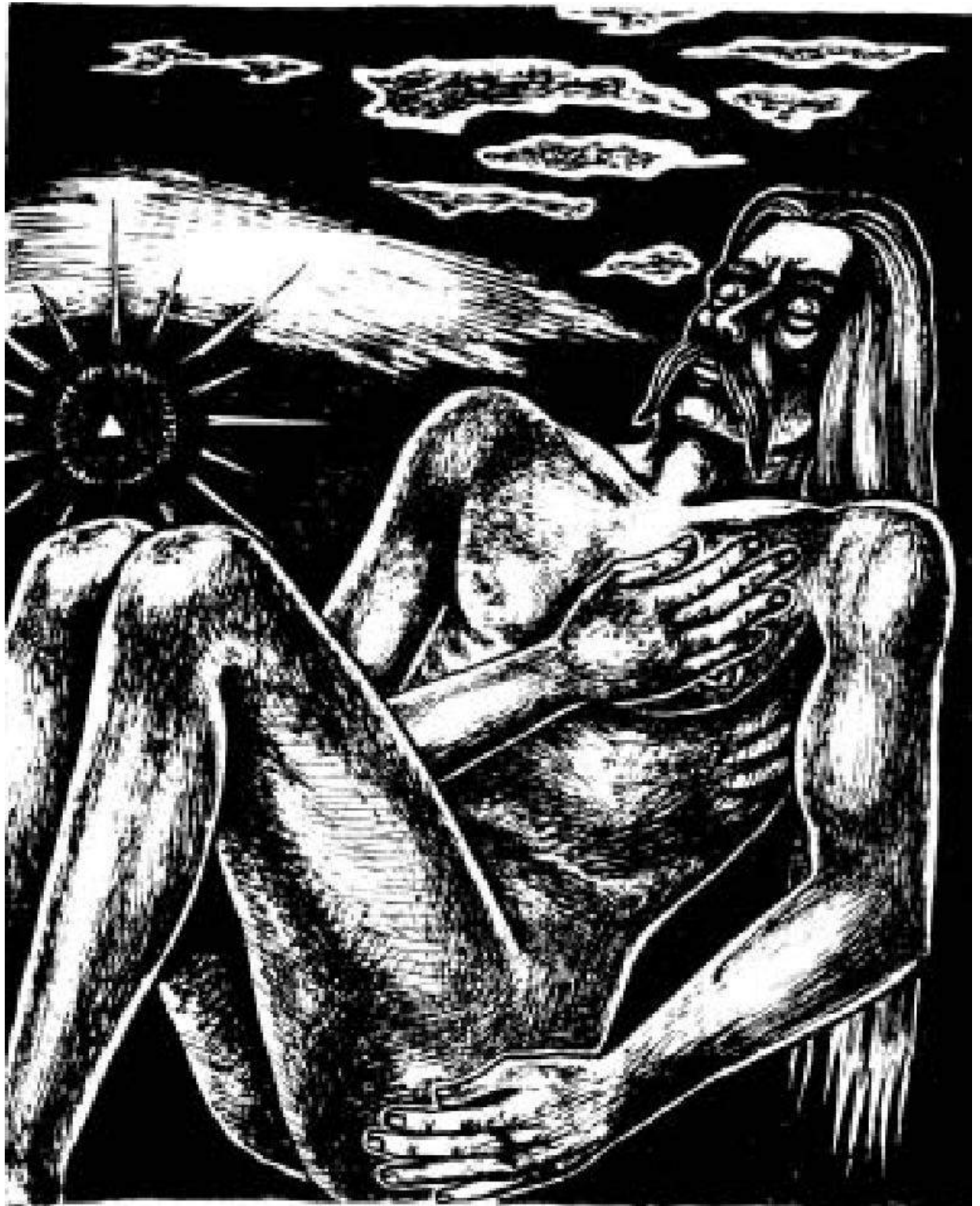
YMER LE GEANT