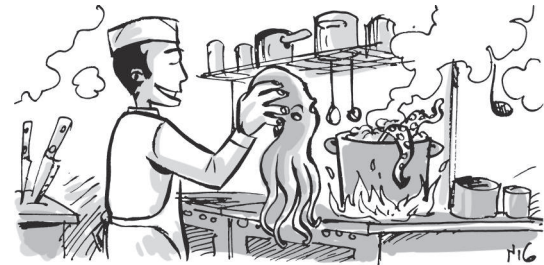
NA COZINHA DO RESTAURANTE