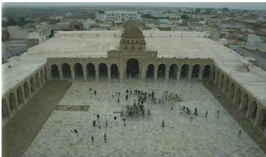
Vue sur la salle de prière

Cité moderne – Minaret en brique côté nord, 30m de hauteur – Cour, oratoire, nef centrale – 17 nefs à toit plat – 414 colonnes monolithiques soutiennent le toit plat – 4 travées dans la salle de prière qui s'ouvre sur la cour avec 13 arcs.