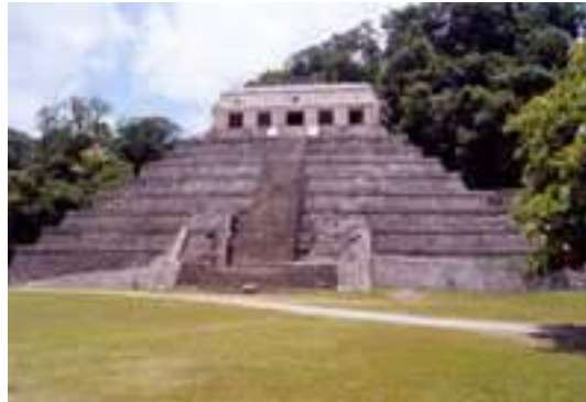
Temple des inscriptions

Inscrit au Patrimoine Mondial (1987) – Site archéologie au nord des collines du Chiapas, dans les forêts.