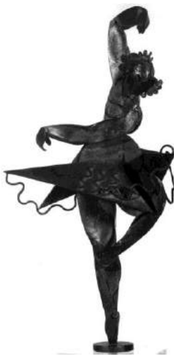
Pablo GARGALLO (1881-1934), Danseuse , 1925, cuivre patiné, 40 x 20 x 20 cm.

Le thème de la maternité occupe une place importante dans le domaine des arts. Il est souvent associé à la Vierge à l'Enfant ce qui lui donne une connotation religieuse. C'est ici une vision plus profane et plus réaliste du sujet. La notion de corps nourricier de la femme est mise en avant. La polychromie accentue l'aspect réaliste de l'œuvre. Le ton donné aux chairs et aux chevelures rappelle la couleur jaune du socle en marbre veiné qui s'oppose au bleu du tissu. L'artiste rapproche ainsi la sculpture de la peinture.