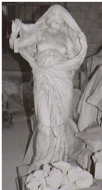
Ernest BARRIAS (1841-1905), La Nature mystérieuse et voilée se découvre devant la Sciences , 1893, plâtre, 198 x 85 x 40 cm.

Une allégorie représente une idée abstraite, une institution, un sentiment comme la Liberté, la Colère, la Justice, la Victoire, la Mort, la République. Le plus souvent, cette idée est personnifiée puisqu'elle apparaît sous les traits d'une femme ou plus rarement d'un homme accompagné d'attributs qui permettent de l'identifier.