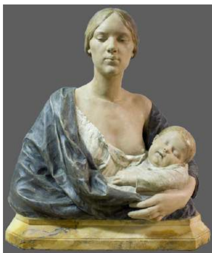
Gaston LEROUX-VEUNEVOT (1854 –1942), Maternité , 1898, pierre peinte, socle en marbre jaune, 73 x 63 x 43 cm.

La nature, l'éternelle nourrice, est représentée sous les traits d'une jeune femme enveloppée d'un ample voile, soulevant sa draperie mystérieuse et montrant aux hommes sa beauté. L'allégorie semble ici un prétexte pour représenter le corps féminin, une femme superbe se dépouillant de ses longs voiles, apparaissant à la splendeur du jour dans l'éclat de sa beauté souple et généreuse. Seul son socle rappelle que c'est la Nature.