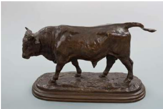
Rosa BONHEUR (1822 - 1899), Un Taureau marchant , 1846, bronze à patine brune, 18 x 33 x 11cm.