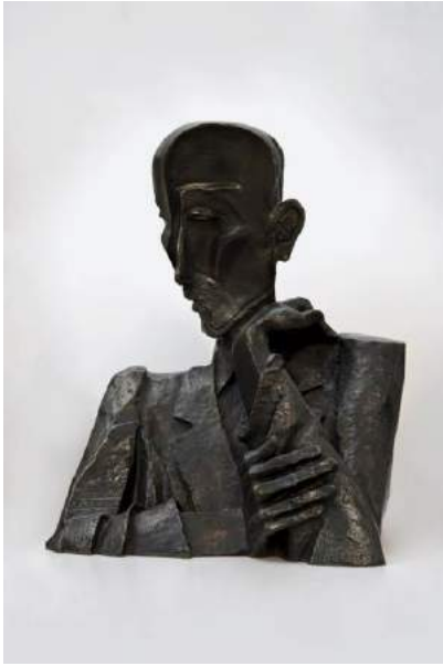
Ossip ZADKINE (1890-1967), Buste de François Mauriac , 1943, bronze, 63 x 56 x 36 cm.