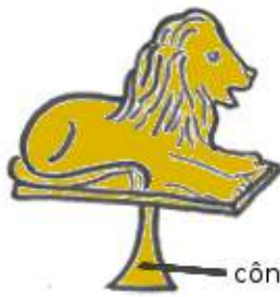
cône de coulée

1) Modeler une forme avec de la cire et ajouter un cône de coulée.