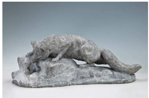
Isidore Jules BONHEUR (1827-1901), Vache défendant son veau contre un loup , 1858, bronze, 58 x 95 x 48 cm. Renard à l'affût , 1899, marbre gris, 26 x 54 x 22 cm.