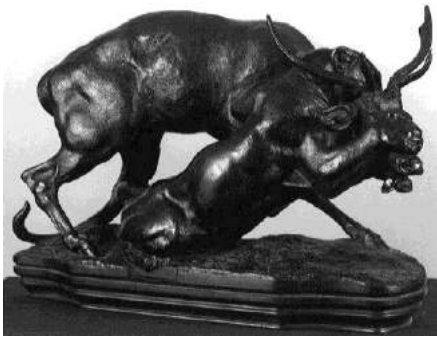
Antoine-Louis BARYE (1795-1875), Panthère saisissant un cerf , 1857, bronze, 36 x 54,5 x 23 cm de hauteur.

Observés, appréciés ou redoutés, les animaux sont une alternative à la figure humaine d'une grande richesse formelle. Présents dans l'art depuis la Préhistoire, les animaux sont nombreux dans les représentations religieuses, mythologiques et dans les portraits. Ils sont souvent porteurs de symboles, l'agneau est le Christ, le lion est l'emblème de la force, la colombe la paix, le chien la fidélité. La sculpture animalière prit une autre dimension au XIX e siècle avec les sculpteurs romantiques. Leur travail oscille entre reconnaissance (des médailles lors des salons) et mépris pour ces sujets moins nobles que les thèmes historiques (religion, mythologie, hommage aux grands hommes).