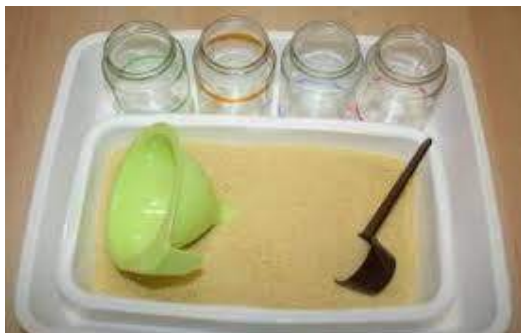
Bac à semoule.

traces qui peuvent être effacées en cas de « loupé », mais aussi pour le plaisir de recommencer et d'y parvenir !