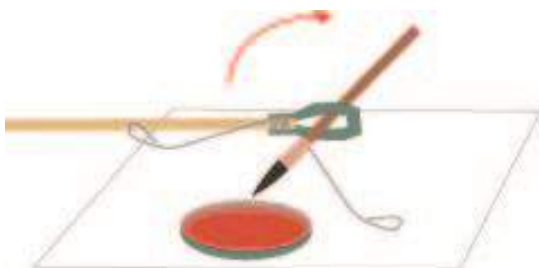
Pinceau de table verticalisé avec peinture

Pour certains élèves en fauteuil, les gestes possibles se limitent au niveau du bras et de la main, sans mobilité du buste. Cela ne permet pas d'atteindre le haut d'une feuille au milieu d'une table. Le fauteuil lui-même peut entraver les gestes (accoudoirs, plateau...). Il est donc intéressant d'allonger le manche du pinceau de quelques dizaines de centimètres, grâce à un bâton léger, qui en outre sera attaché perpendiculairement au pinceau de façon à le verticaliser. Le pinceau est maintenu vertical grâce à ce bâton et à deux tiges latérales en fil de fer d'une dizaine de centimètres. Pour prendre la peinture, il suffit de basculer le poids du pinceau sur une seule des tiges, et il est ainsi déplacé sur « une seule patte » sans toucher le support papier.