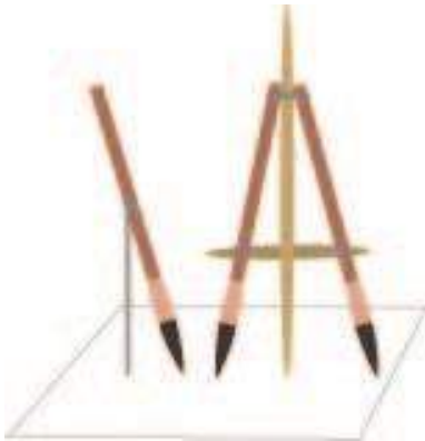
Pinceaux rotatifs

Un premier modèle de pinceau rotatif est un pinceau attaché à mi-hauteur du manche à un bâton et qui fonctionne sur le principe du compas. Un autre modèle est constitué de deux pinceaux associés à un bâton un peu plus long que les manches des pinceaux. Manches et bâton (qui dépasse vers le haut pour permettre la prise en main) sont liés en haut par un cordon. En bas, à la limite des viroles, ils sont reliés par un bâtonnet perpendiculaire au bâton central qui permet de fixer un écartement des deux pinceaux. Ils fonctionnent aussi selon le principe d'un compas.