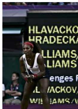
Londres 2012 Double (F)