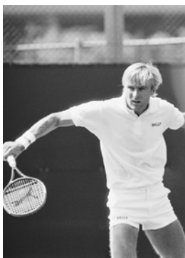
Seoul 1988 Simple (H)