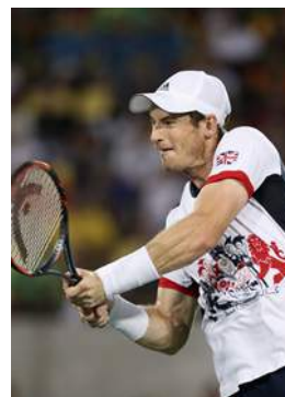
Rio 2016 Simple (H)