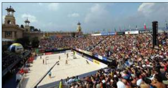
Un stade comble suit l'action sur le court central à l'Open Hyundai 2009 de Barcelone