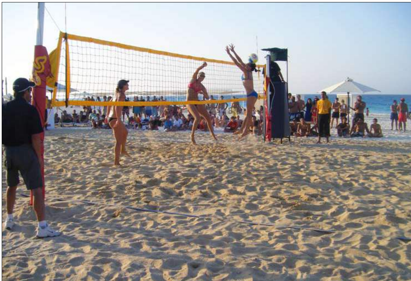
La toute première Coupe du monde de Beach Volleyball se déroulera sur trois ans, de 2010 à 2012

Pour de plus amples détails, notamment en ce qui concerne les conditions d'inscription et de participation, cliquez sur www.fivb.org/EN/BeachVolleyball/Competitions/WorldCup/ .