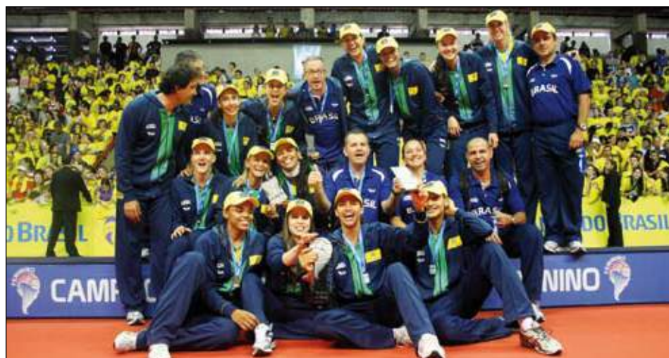
Ayant remporté tous les tournois de l'année, le Brésil est sans conteste l'équipe à battre

Les joueurs serbes ont remporté cette finale malgré 31 fautes, 12 de plus que leurs adversaires.