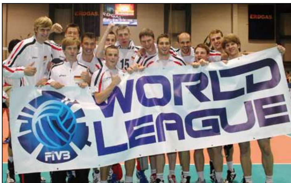
L'Allemagne reviendra fièrement en Ligue mondiale en 2010

L'Égypte a remporté son second match par 3-1 (22-25, 25-23, 25-15, 25-22) au Stade du Caire, le 19 septembre dernier.