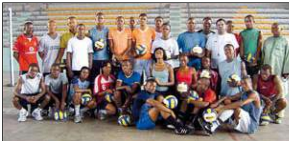
Les participants au stage de coopération pour le Volleyball à Libreville, au Gabon

Ce stage s'inscrivait dans le cadre du PCV que la FIVB poursuit depuis 1989 pour aider les nations récemment venues au Volleyball à se développer.