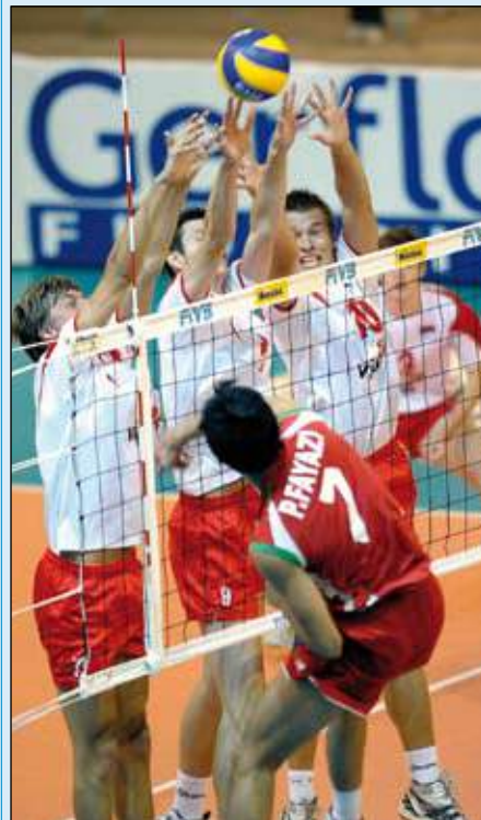
Des contres tels que celui-ci ont permis à la Serbie de décrocher l'or

gagné ces cinq matches, mais son entraîneur en chef, Bernardo Rezende, refuse de se laisser emporter par la relative facilité de ces victoires. «Ne nous faisons pas d'illusions: nous savons que notre équipe n'est pas encore au complet et que, de leur côté, les Américains ne sont pas au mieux de leur forme. Cela dit, ces cinq matches ont été importants puisqu'ils nous ont permis de nous confronter aux joueurs de la nouvelle olympiade», a-t-il déclaré.