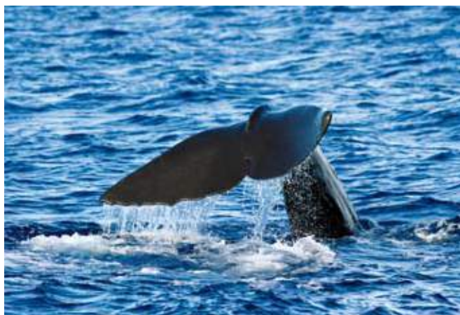
■ Le Cachalot ( Physeter macrocephalus ), une espèce "Vulnérable"

Concernant les cétacés, près de la moitié des espèces a dû être placée dans la catégorie "Données insuffisantes", en raison du manque de connaissances et de données disponibles. Pourtant, certains de ces mammifères marins pourraient bien être menacés en France, car ils sont affectés par de multiples