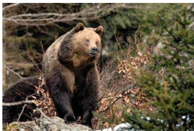
■ L'Ours brun ( Ursus arctos ), classé "En danger critique d'extinction"

NE : Non évaluée (espèce non encore confrontée aux critères de la Liste rouge)