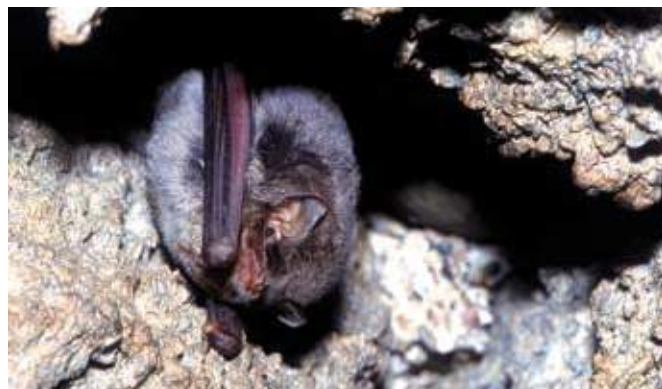
■ Le Minioptère de Schreibers ( Miniopterus schreibersii ), classé "Vulnérable"