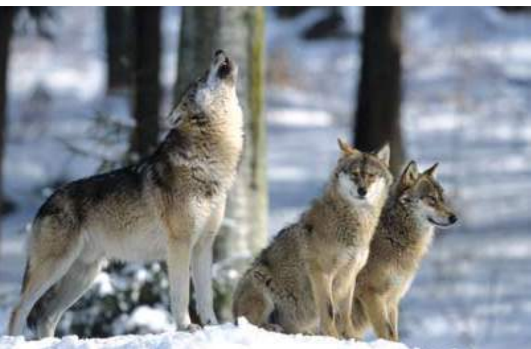
■ Le Loup gris ( Canis lupus ), une espèce classée "Vulnérable"

Malgré la situation encore préoccupante de plusieurs espèces, le résultat des évaluations montre que les actions de conservation entreprises pour les mammifères sur le territoire métropolitain portent leurs fruits (protection réglementaire nationale et européenne, plans nationaux d'action, conservation des habitats naturels...). Ces résultats encourageants incitent à poursuivre les efforts et à renforcer l'action pour continuer à améliorer, dans les années à venir, la situation de ces espèces.