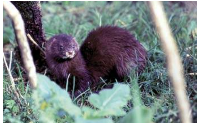
■ Le Vison d'Europe ( Mustela lutreola ), une espèce classée "En danger"

De plus, des évaluations complémentaires ont été réalisées pour certaines sous-espèces continentales et pour certaines populations d'espèces marines (cf. tableau p.11).