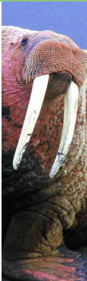
Odobenus rosmarus Annexe III