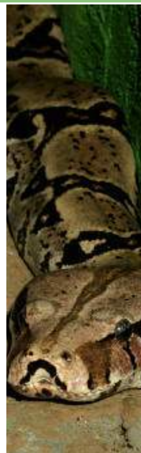
Boa constrictor Annexe II