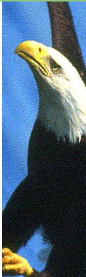
Haliaeetus leucocephalus Annexe I