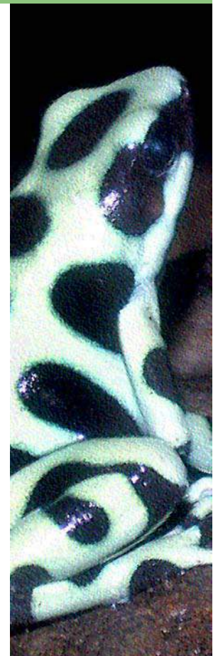
Dendrobates auratus Annexe II