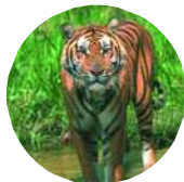
Os de tigre

De nombreux médicaments traditionnels sont fabriqués à partir de parties d’animaux. Par exemple, en Asie de l’Est, on utilise plus de 1 000 espèces de plantes et d’animaux pour fabriquer des médicaments. En Asie, la croyance populaire veut que presque toutes les parties du tigre ont un effet bénéfique et peuvent guérir une kyrielle de troubles, notamment l’épilepsie et la paresse. Les os de tigre sont le plus fréquemment utilisés. La diminution considérable de consommation de médicaments faits à partir d’os de tigre ces dernières années illustre le caractère essentiel de la coopération avec les spécialistes de la médecine traditionnelle et les gens qui consomment ces médicaments. Ces groupes peuvent largement contribuer à mettre fin à tout commerce illicite en faisant la promotion de produits de remplacement et en sensibilisant les consommateurs à la conservation.