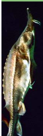
Huso huso Annexe I