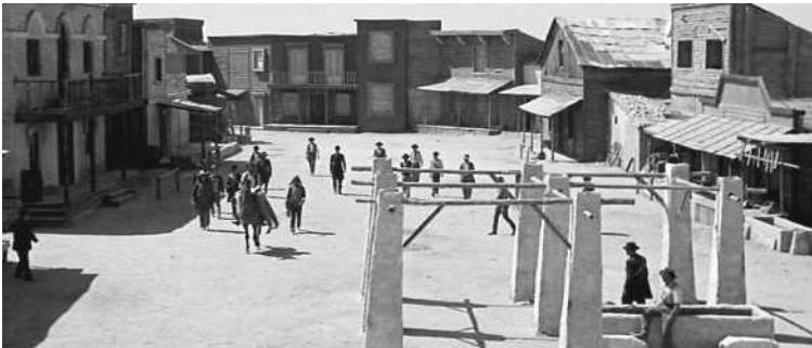
10. Plan d'ensemble : Tire encore si tu peux (Giulio Questi, 1967).

Le plan d'ensemble (ou plan général – fig. 10) sert généralement à désigner le cadrage le plus large qu'on peut avoir d'une scène (plan de la totalité d'une pièce, d'une foule sur une place, d'un vaste paysage...).