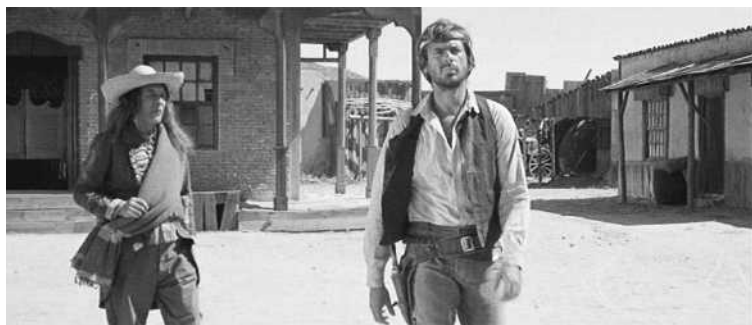
11. Plan américain : Tire encore si tu peux (Giulio Questi, 1967).

Le plan américain (PA – fig. 11) s'arrête à mi-cuisse. À l'origine, dans le cinéma américain, la limite était donnée par l'extrémité du colt pendu à la ceinture (et qui arrivait donc à mi-cuisse).