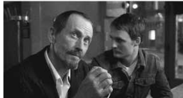
8. Insert : A History of Violence (David Cronenberg, 2005).