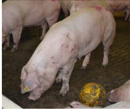
Figure 4 : Exemple de matériau manipulable non déformable, le ballon dans un groupe de truies gestantes

Une option a été proposée pour améliorer l'attractivité d'un objet en associant à la fonction de manipulation une fonction alimentaire. Un ballon distribuant des granulés par de petits orifices a ainsi été testé « Edinburg Football » (Young et al. , 1994).