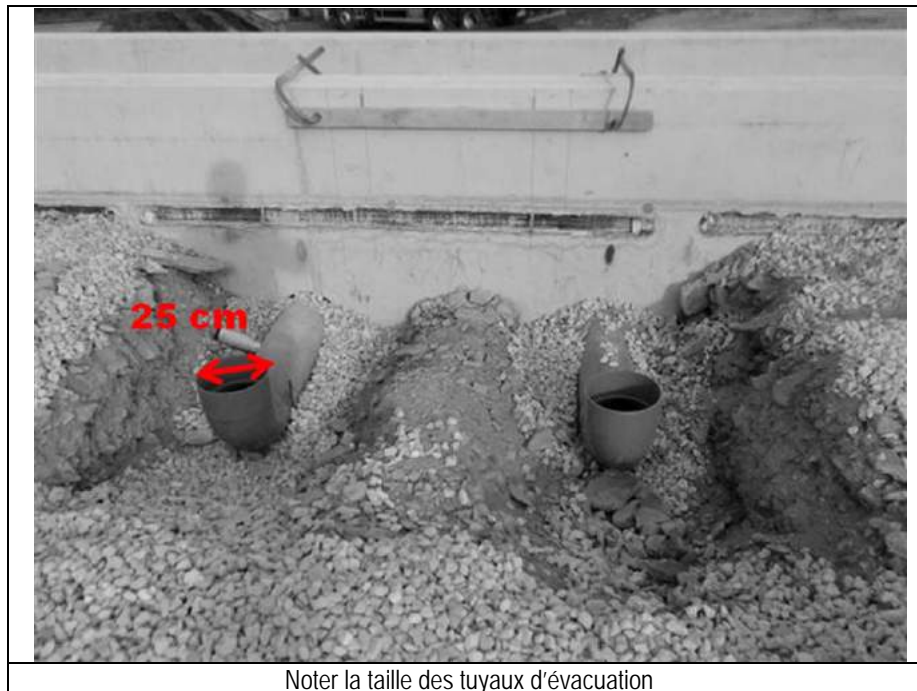
Figure 2 : Système de vidange des fosses à lisier

La première étape de la gestion du lisier est l'évacuation de l'effluent du bâtiment d'élevage. En France, la vidange du lisier des fosses de stockage en bâtiment se fait généralement par gravité à l'aide de tuyaux d'un diamètre de 25 à 30 cm. Cet équipement est installé dès les premières étapes de la construction dans les soubassements du bâtiment et n'est plus modifiable ensuite (cf. figure 2). Les tuyaux d'évacuation du lisier des différents bâtiments de l'élevage peuvent se raccorder les uns aux autres dans le but d'envoyer le lisier vers les fosses de stockage.