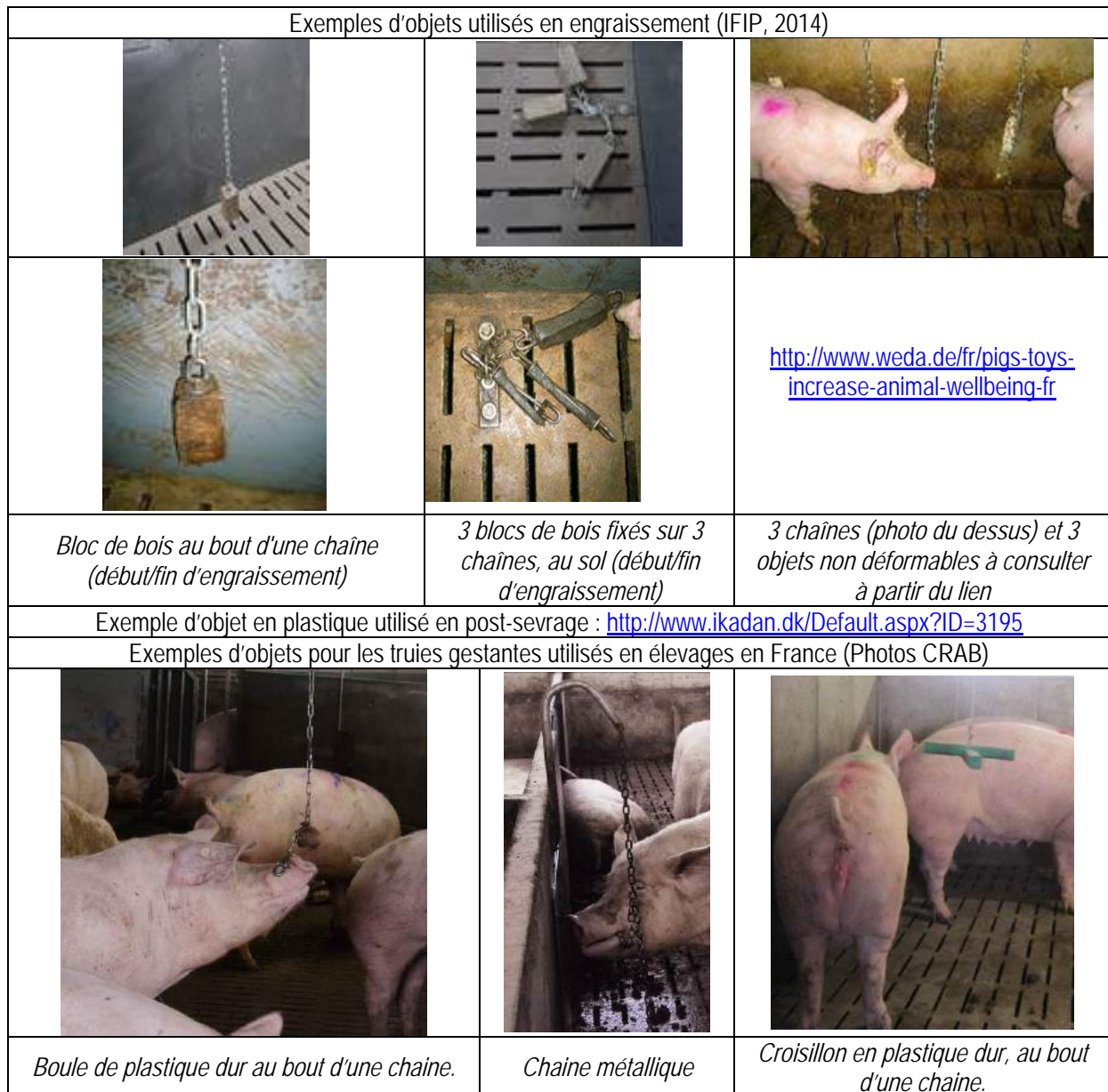
Tableau 1 : Diversité des matériaux manipulables pour des porcs de différents âges