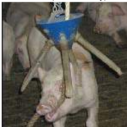
Figure 5 : Exemple de dispositif permettant des actes moteurs de type frottement et mordillement (ici, exemple du « Bite-Rite tail Chew ® »)