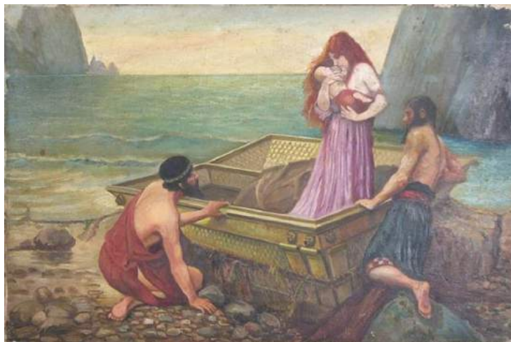
Dictys le pêcheur (à droite) et son frère (à gauche) ouvrent le coffre et libèrent Danaé et Persée

d'elle et il l'avait emmené dans le temple d'Athéna, et elle était tombée enceinte de lui. « Mon temple n'est pas un endroit pour faire des câlins ni des bébés, avait dit alors Athéna à Médusa, très fâchée. Ma religion est plus importante que le bonheur des femmes et des hommes, et je vais te punir » avait-elle rajouté. II