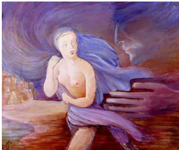
Alcmène et Zeus

Mais Zeus trompait souvent Héra, et un jour où Héra ne regardait pas, Zeus est descendu sur Terre pour séduire la belle Alcmène. I Alcmène est tombée enceinte de Zeus, et le petit bébé serait Héraclès, mais tout le monde l'appellerait Hercule .