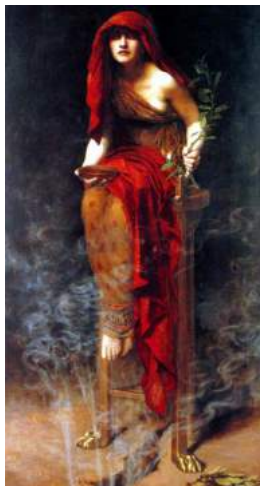
L'oracle de Delphes

Tous les jours, la belle Danaé regardait le ciel et la lumière à travers la fenêtre, et Zeus, le chef des dieux, l'a aperçue depuis l'Olympe, et est tombé amoureux d'elle. Il lui a rendu visite sous forme d'une pluie d'or, et par magie, il lui a fait un enfant : le petit Persée. Danaé a caché l'enfant dans sa chambre dans la tour et s'occupait bien de lui. Et puis un jour, le roi Acrisios a entendu l'enfant jouer. Il a été pris d'une grande colère et d'une grande peur, car il se souvenait que l'oracle lui avait dit que cet enfant, plus tard, le tuerait. Alors, il a enfermé Danaé et Persée dans un coffre fermé à clé qu'il a jeté à la mer. Le coffre est tombé dans l'eau en faisant une grande éclaboussure, mais heureusement, il n'a pas coulé, et les