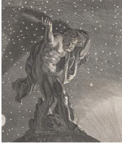
Atlas portant le ciel

donné à Athéna la tête de Médusa. Athéna l'a dessiné sur son bouclier pour faire peur à ses ennemis.