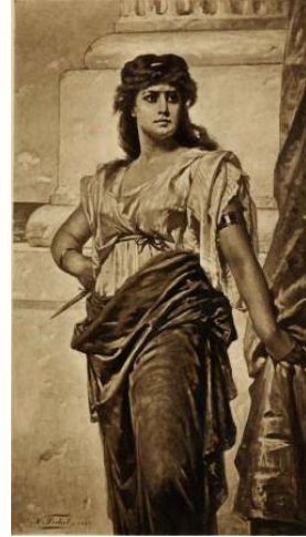
Médée, princesse et magicienne, fille d'Éétès

gauche. À côté de Jason se trouvait Médée la fille d'Éétès. Après que les conteurs aient raconté les histoires du pays, Jason s'est levé et a raconté les histoires des Argonautes. Les conteurs écoutaient bien car après, ce serait eux qui iraient de ville en ville pour raconter ces histoires à leur tour et les transformer en légendes. Jason n'a pas raconté qu'il avait épousé et abandonné Hypsipyle, la reine des Lemniennes, mais il a raconté comment ils avaient aidé Phinée à se débarrasser des harpies et comment ils avaient franchi les Symplégades. « Raconte-moi d'autres de tes aventures » dit la princesse Médée. Alors il a continué à raconter. Il a raconté qu'ils avaient dû combattre des géants et un roi-brigand, qu'ils avaient rencontré et combattu les Amazones, qu'ils avaient été attaqués par des