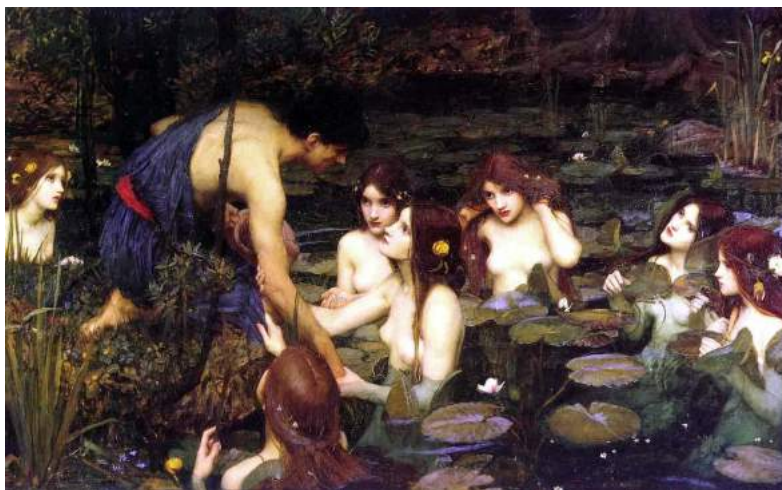
L'enlèvement d'Hylas par les nymphes.

Hylas a marché en remontant une rivière, jusqu'à trouver une source où l'eau était suffisamment claire pour qu'il puisse remplir sa jarre. Il la ramènerait ensuite au navire et indiquerait l'endroit à ses compagnon qui pourront remplir les réserves d'eau. Mais au fond de la rivière, vivaient des nymphes, et elles aussi tombèrent amoureuses d'Hylas. L'une d'elle est sortie de l'eau pour l'embrasser, et les autres l'ont tiré par le bras, et elles l'ont emmené avec