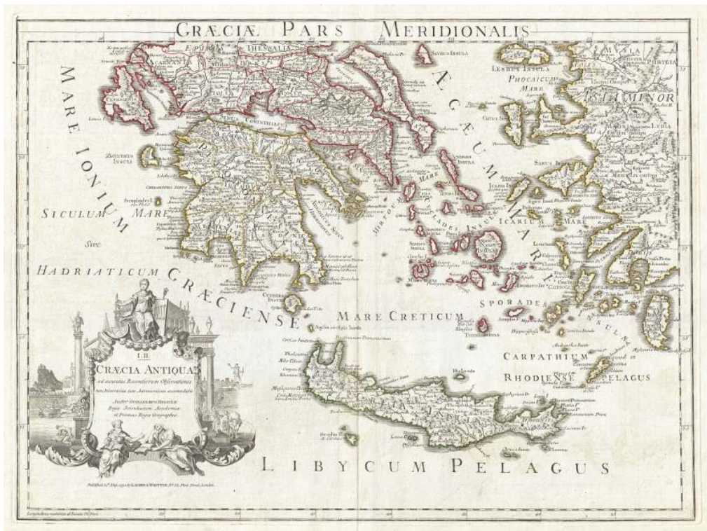
Carte de la Grèce antique, dessinée en 1794.