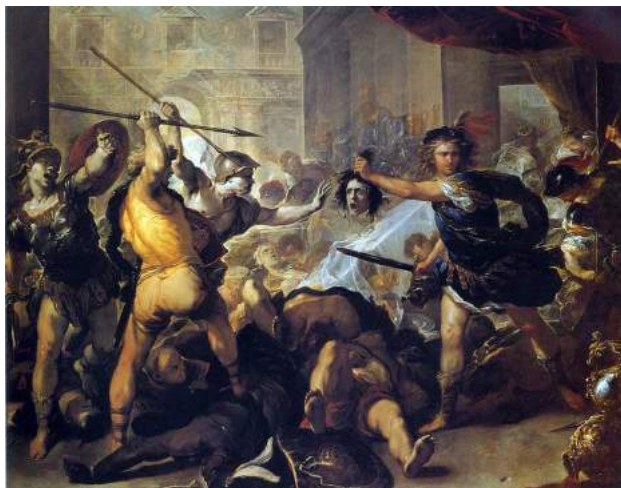
Persée change en pierre Phinée et ses soldats