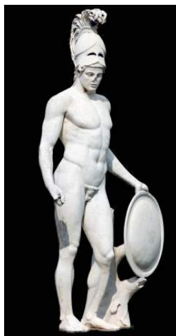
Arès (dieu de la guerre et de la destruction)

Et c'est comme ça que Héphaïstos est revenu dans l'Olympe. Il avait une maison où il habitait avec Aphrodite, mais il allait encore souvent à Lemnos, tout seul ou avec Aphrodite, ainsi que dans les forges ou dans les volcans avec les cyclopes pour forger des armes, des machines et d'autres objets.