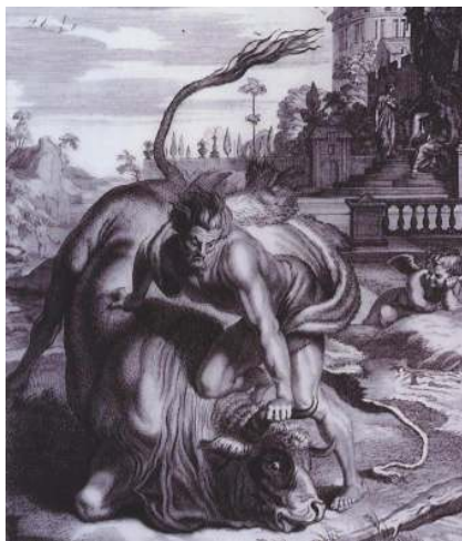
Le taureau crétois