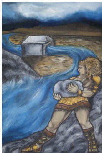
Les écuries d’Augias

et les arbres dans les forêts tombaient malades. Pour tout nettoyer, Hercule a construit des digues 2 pour détourner les fleuves Alphée et Pénée. Les digues d’Hercule ont fait barrage aux fleuves, qui ont changé de direction et ont dévalé en eaux bouillonnantes dans les écuries. Les animaux ont couru dans tous les sens pour ne pas se noyer, et les eaux ont emporté toutes les saletés. Tout ce fumier a fini par arriver dans la mer. Comme le fumier contient des éléments qui font pousser les plantes, ça a fait pousser des algues vertes partout sur les côtes de la Méditerranée, et beaucoup de poissons qui ne pouvaient pas vivre dans les algues sont morts.