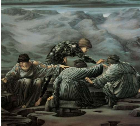
Persée et les trois Grées, gardiennes des Gorgones

Persée ne savait pas où trouver Médusa, mais comme Persée était le fils de Zeus, les dieux ont décidé de l'aider. Athéna lui a donné un bouclier magique pour se battre contre Médusa, et Hermès lui a indiqué le chemin pour trouver les Grées qui étaient les gardiennes des Gorgones. Les Grées étaient de vieilles femmes qui avaient un seul œil et une seule dent qu'elles se partageaient. Elles ne voulaient pas aider Persée, alors il a pris l'œil et leur a dit : « Je vous rendrai l'œil lorsque vous m'aurez dit où se trouve Médusa ». Les Grées étaient fâchées, mais comme elles avaient besoin de leur œil, elles ont accepté de lui dire le secret de la cachette des Gorgones.