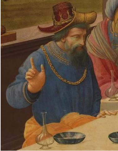
Éétès, roi de Colchide

Le roi Éétès s'était installé sur la table du milieu avec Jason à sa droite pour lui faire honneur, et son fils à sa