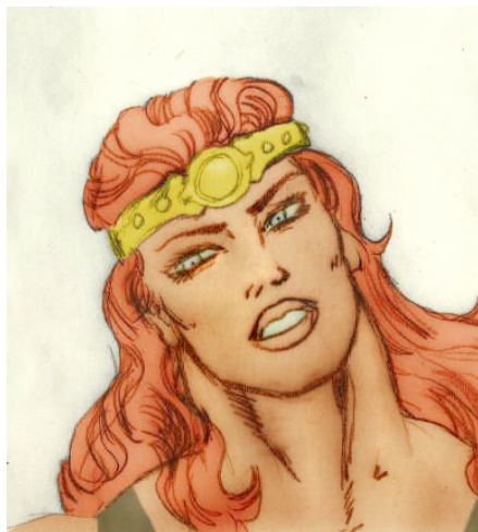
Hippolyte, reine des Amazones

Hercule et Abdère sont allés dans les écuries, ont capturé les chevaux et les ont emmenés sur la plage pour les faire monter dans leur navire, dans un enclos préparé spécialement. Les gardes du roi leur ont couru après pour les en empêcher. « Abdère, mon ami, monte les chevaux dans le navire pendant que je me bats avec les gardes », dit Hercule en sortant son épée. Abdère a attaché les chevaux dans le bateau, mais il n'a pas été assez prudent. Pendant qu'il faisait rentrer le dernier cheval, un autre qui avait passé la tête par-dessus l'enclos l'a mordu à la tête si fort que le pauvre Abdère est mort sur le coup I . Hercule avait vaincu les soldats, mais il était très triste que son ami soit mort. Il a capturé et assommé le roi Diomède, il l'a jeté dans l'enclos, et les chevaux se sont jetés sur lui pour le dévorer.