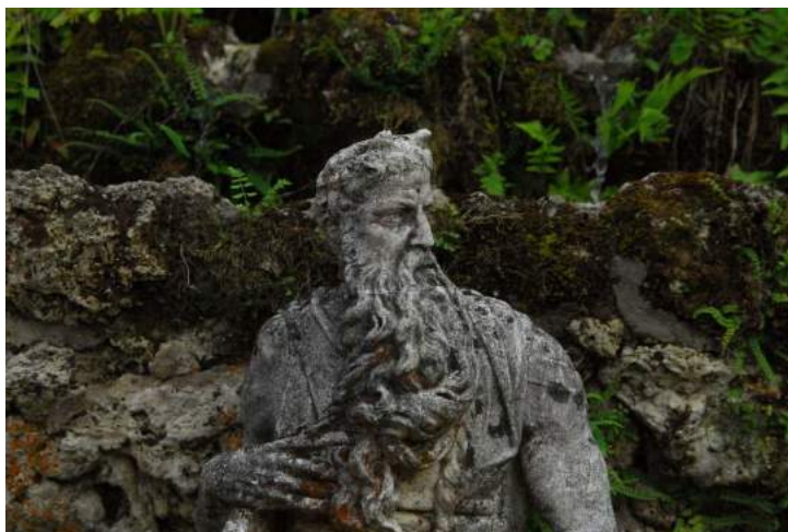
Polydectès, transformé en statue de pierre.