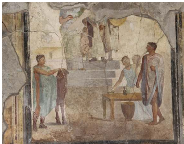
Jason (à droite) revient à Iolcos et est présenté à Pélias l'usurpateur (à gauche)

parlé. « Bonjour, je suis Jason, ton neveu, fils d'Éson et roi légitime 2 d'Iolcos. Je suis revenu réclamer le royaume. Je ne veux pas te faire la guerre : tu peux garder ton or et tes terres, mais rend moi le trône », a dit Jason. Pélias ne voulait pas rendre le trône, et il a cru que Jason essaierait de le tuer, alors il a bien réfléchi, et il a pensé à un moyen de se débarrasser de lui. Il lui a répondu :