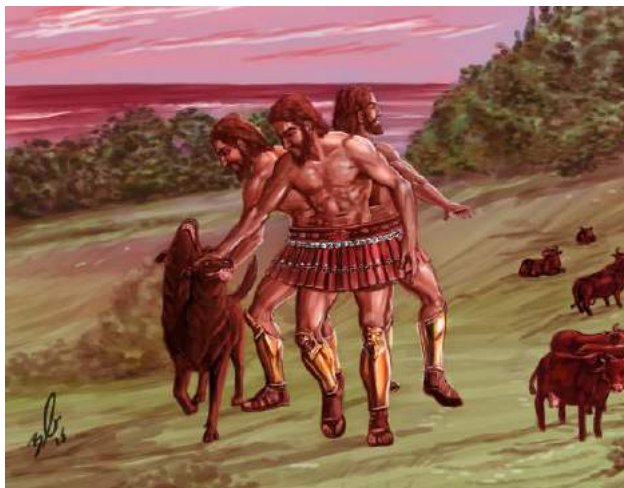
Le géant Géryon

pas en faire le tour. D'un grand coup d'épée, Hercule a tranché la montagne, la séparant en deux grandes falaises, et l'eau sous le navire s'est engouffré dans le creux pour rejoindre la mer derrière la montagne. Sans le savoir, Hercule venait de séparer l'Europe de l'Afrique. On a appelé ces falaises les Colonnes d'Hercule , et elles sont toujours là, mais on appelle aujourd'hui cet endroit Gibraltar . Les troupeaux étaient sur l'île d'Érythée entourée d'une eau maléfique qui tordait le bois des navires. Hercule a appelé son ami Hélios, le dieu du soleil, qui était dans le ciel. « Hélios, prête-moi ton char solaire pour que je puisse accoster à Érythée », lui a-t-il demandé. Et grâce au char en or de Hélios, Hercule a pu arriver sur l'île. Hercule a trouvé les troupeaux, mais lorsqu'il a voulu les emmener, le géant est apparu de derrière un rocher et a foncé pour l'arrêter. Hercule a tiré une flèche qui a traversé les