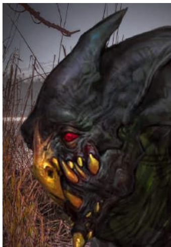
Un oiseau du lac Stymphale