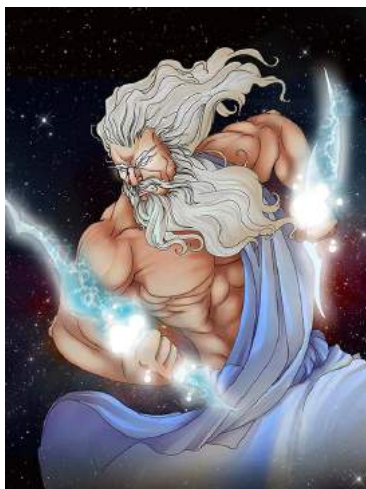
Zeus (dieu suprême, le mari de Héra)

On dit qu'il y avait douze dieux dans l'Olympe : Zeus, Héra, Hélios, Poséidon, Athéna, Arès, Déméter, Artémis, Héphaïstos, Aphrodite, Hermès et Dionysos. 2 Leur chef