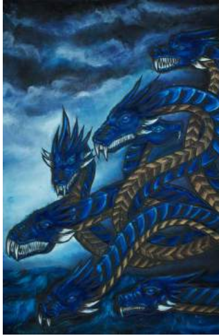
L'hydre de Lerne