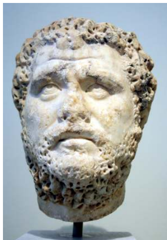
Acrisios, roi d'Argos

dans ton palais, mais ce sera l'enfant de ta fille, et quand il sera grand, il te tuera. » Alors Acrisios est rentré dans son palais et a décidé d'enfermer sa fille dans une tour pour qu'elle ne se marie jamais.