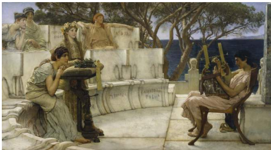
À Lemnos, les Lemniennes qui s'ennuyaient ont convaincu les Grecs de rester avec elles. Ici, Orphée leur joue de la Cythare.

Hypsipyle, la reine des Lemniennes, s'est approchée de Jason. « Restez ici, soyez nos maris, faisons des enfants afin que cette île redevienne une île joyeuse où il fait bon vivre » a-t-elle demandé. Jason savait qu'il devait aller chercher la toison d'or, mais Hypsipyle était tellement belle, que Jason en est tombé amoureux, et ils ont tous décidé de rester un peu. Jason et Hypsipyle se sont mariés, et ils ont eu deux enfants. Mais un jour, Hercule a