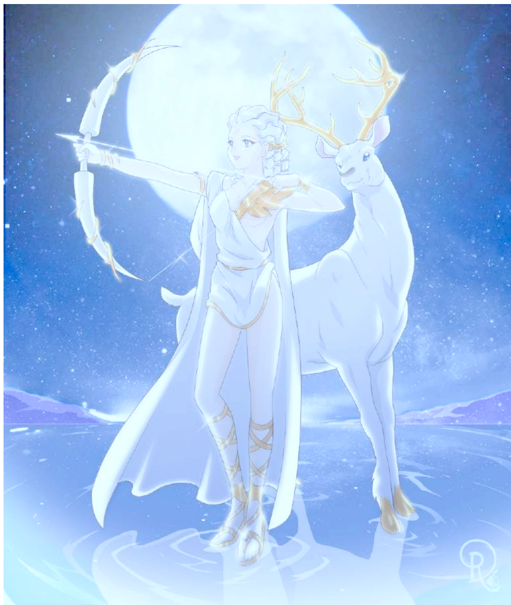
Artémis et le cerf aux bois d'or