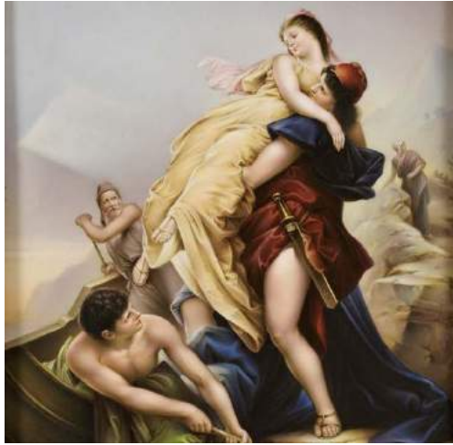
Andromède et Persée

phée et oncle d'Andromède, a débarqué en disant qu'il avait été fiancé à Andromède avant et que c'était lui qui devait l'épouser. Céphée lui a répondu que s'il avait été amoureux d'Andromède, il l'aurait délivré du monstre au lieu de la laisser attachée. Phinée n'était pas amoureux d'Andromède, il voulait juste l'épouser parce qu'elle était une princesse royale. Il a alors lancé sa lance contre Persée, mais il a manqué son but. Il s'est approché avec ses soldats pour essayer de capturer Persée, mais Persée a sorti la tête de Médusa de son sac et Phinée et ses soldats ont été transformés en pierre.