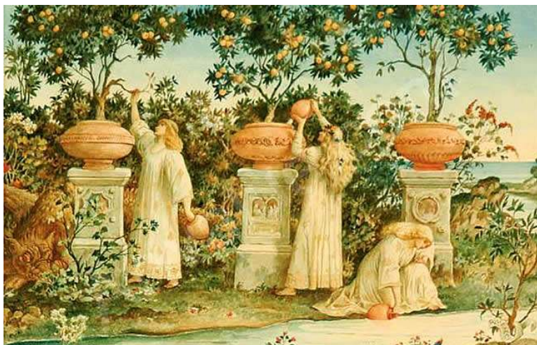
Le jardin des Hespérides.

Hercule a trouvé Nérée, mais Nérée ne voulait rien lui dire et se transformait en toutes sortes d’animaux pour l’embêter ou lui faire peur. Mais Hercule n’avait pas peur, et à un moment, Nérée s’est transformé en lion, et Hercule a sauté en avant et l’a attrapé par le coup. « Veux-tu que je t’étouffe comme j’ai étouffé le lion de Némée ? » lui a-t-il dit. Alors Nérée lui a dit que les Hespérides avaient leur jardin près de là où se trouvait leur père Atlas, en Mauritanie 1 , et que c’était là qu’il fallait aller.