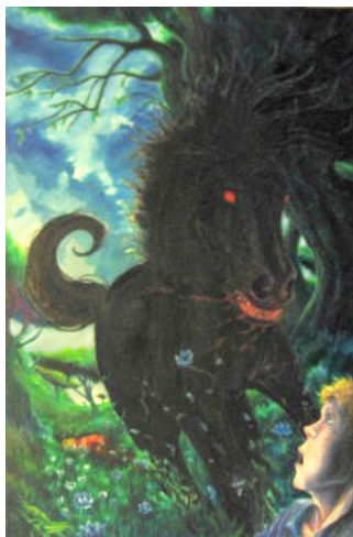
Les chevaux du roi Diomède