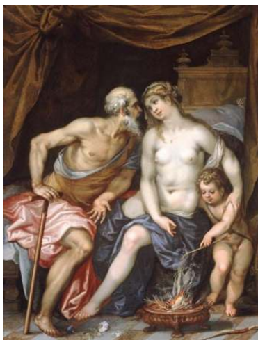
Mariage de Héphaïstos et Aphrodite

Héphaïstos a alors répondu qu'il voulait épouser Aphrodite.