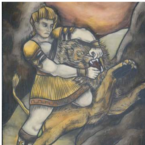
Hercule et le lion de Némée