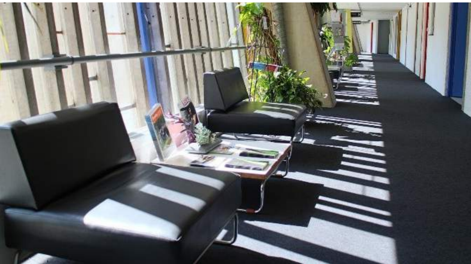
Design Pierre Guariche, rue intérieure de la Maison de la Culture, 1967

Projecteur Le Corbusier, Nemo Lighting