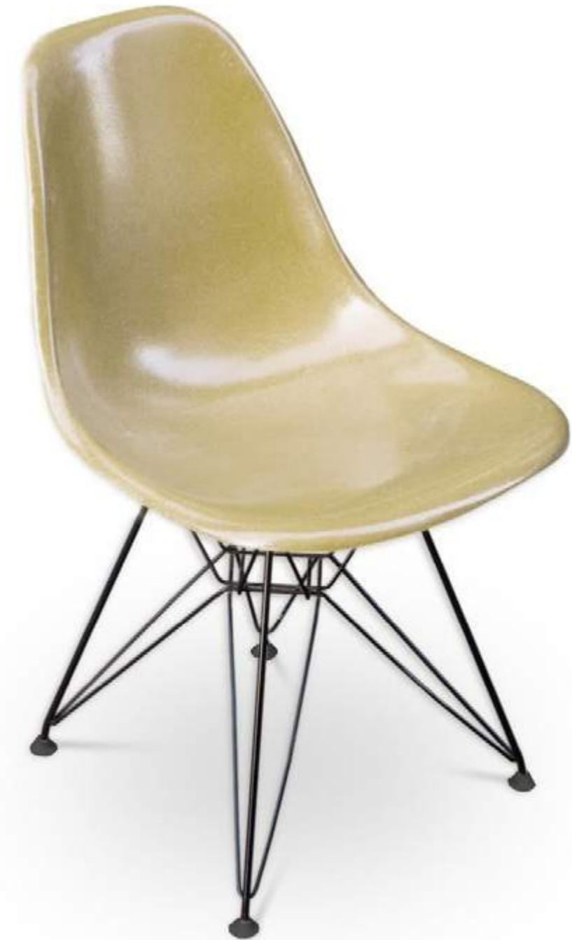
Chaise Eames, années 1950.