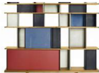
En haut : banquette Cansado (1958). En bas : chaises pour Les Arcs (1960) ; bibliothèque à plots (ateliers J. Prouvé, 1952).