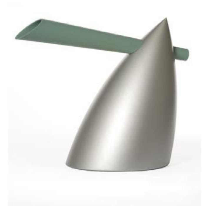
Bouilloire Hot Bertaa en fonte d'aluminium colorée avec une résine siliconée (1987) Alessi.