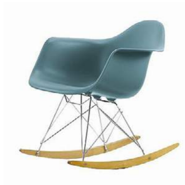
Rocking Chair en plastique moulé et fibre de verre ou DAR (1948-1950) Charles & Ray Eames et son personnel.

Le design de la chaise épouse parfaitement les formes du corps, rendant l'objet moderne et fonctionnel. Plusieurs chaises seront réalisées sur le même modèle.