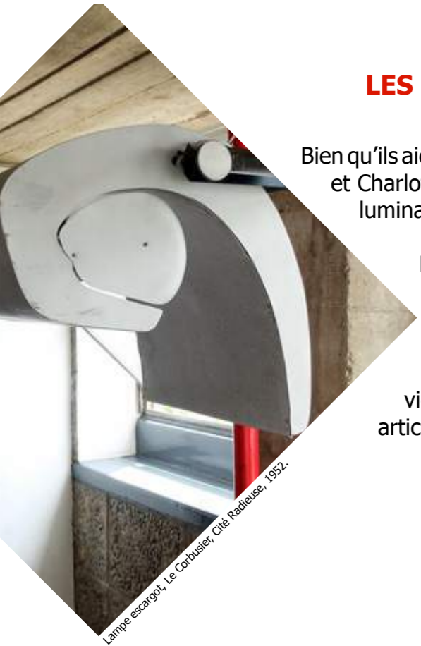
Lampe escargot, Le Corbusier, Cité Radieuse, 1952.

Il faut que l'objet soit fonctionnel et qu'il s'adapte aux modes de vie modernes. Les luminaires deviennent adaptables, pivotants, articulés, etc.