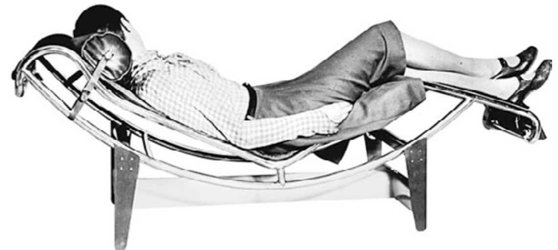
Chaise longue LC4, Le Corbusier et Charlotte Perriand, 1928.