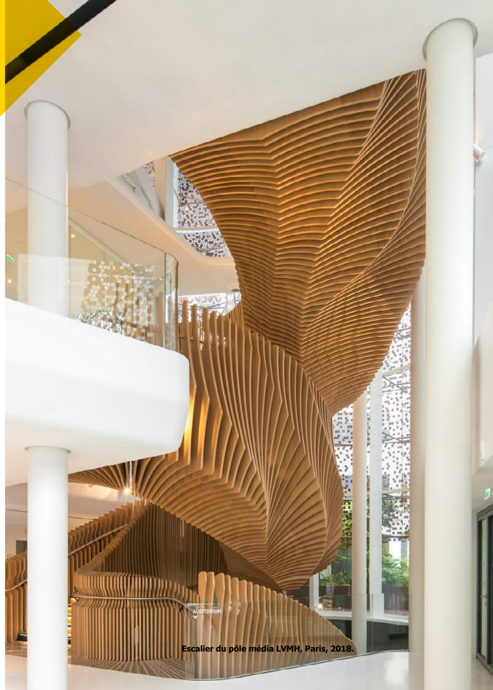
Escalier du pôle média LVMH, Paris, 2018.

Lampe One Line Led , aluminium moulé sous pression peint, aluminium extrudé (2005) Don Artemide, 2016.