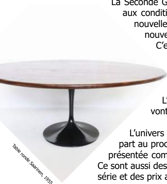
Table ronde Saarinen, 1955.

L'univers de la machine inspire les artistes et les architectes. Ils prennent part au processus industriel et l'intègrent dans leur création, car l'industrie est présentée comme une réponse aux problèmes de logements et d'équipements. Ce sont aussi des meubles modernes et simples qui vont permettre la production en série et des prix accessibles au plus grand nombre.