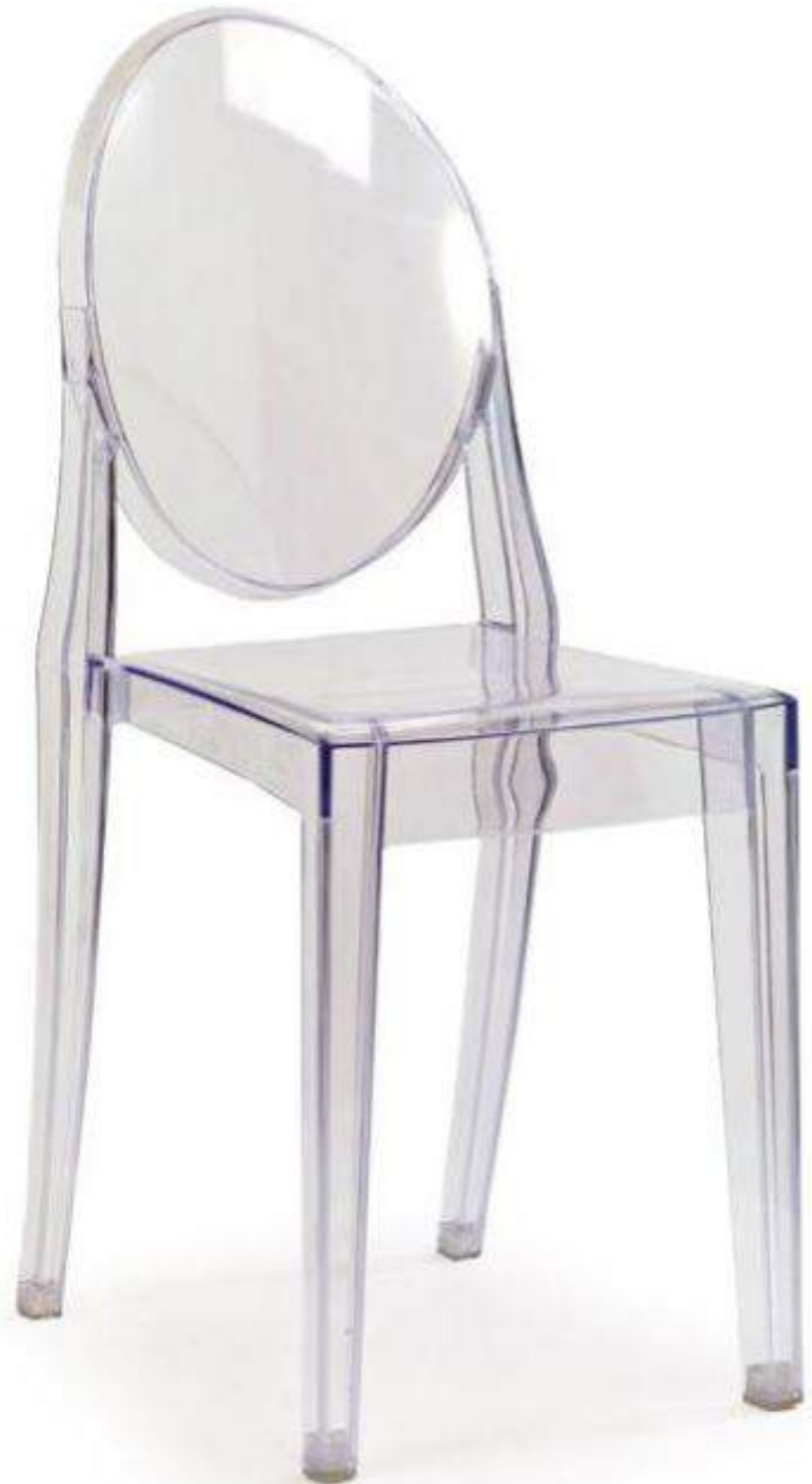
Chaise Victoria Ghost, 2002.