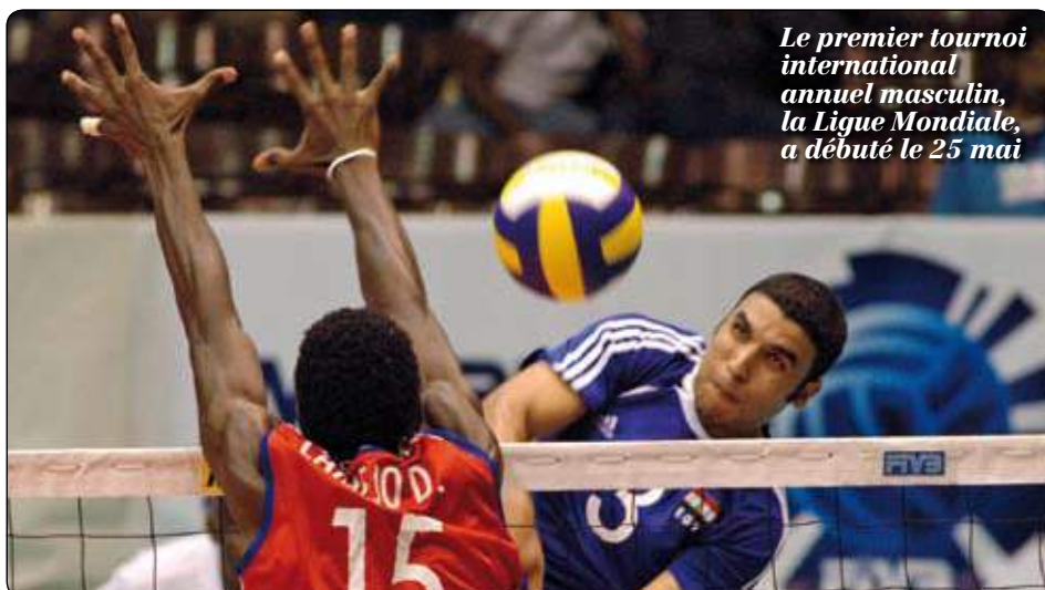
Le premier tournoi international annuel masculin, la Ligue Mondiale, a débuté le 25 mai