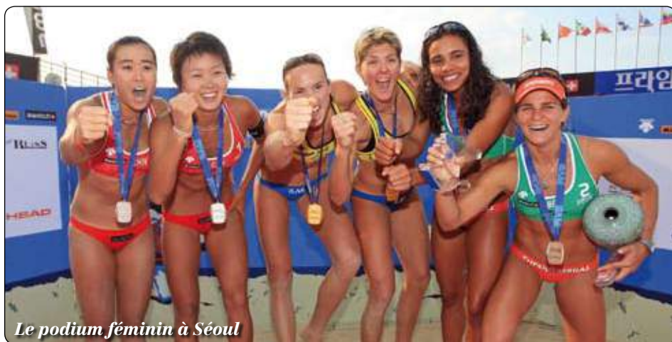
Le podium féminin à Séoul

Les deux meilleures équipes actuelles du Circuit mondial SWATCH FIVB se sont affrontées pour une nouvelle médaille d'or internationale, Marcio/Fabio finissant par s'imposer en trois sets face à Emanuel/Ricardo pour remporter la finale entièrement brésilienne de l'Italian Open. L'épreuve était dotée de USD 200 000 de