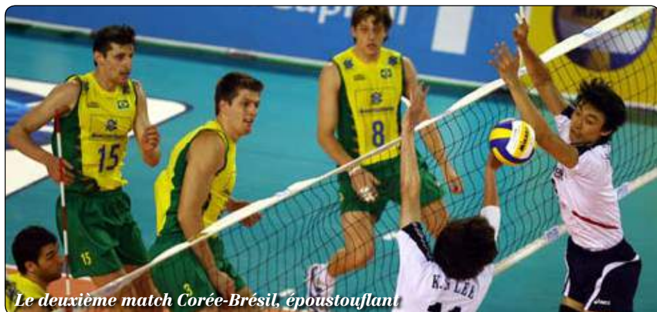
Le deuxième match Corée-Brésil, époustouflant

L'organisateur de la finale à six (la Pologne), les vainqueurs des poules et une « wild card » choisie par la FIVB en découleront à Katowice du 11 au 15 juillet.