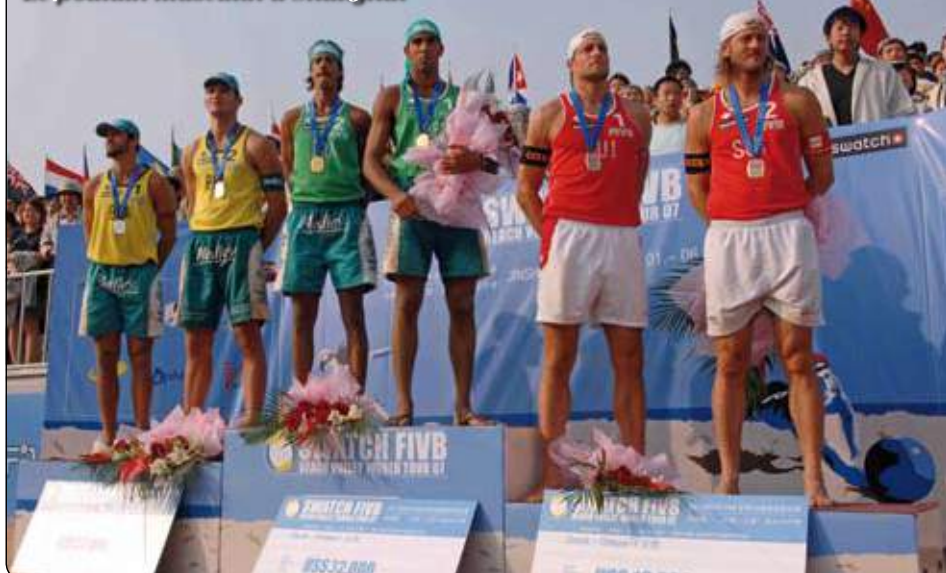
Le podium masculin à Shanghai

Dans le match pour le bronze, Xue/Zhang (têtes de série N°4) ont battu Juliana/Larissa par 21-18 et 21-9. Elles ont ainsi remporté la troisième place, dotée d'une prime de USD 16 000, et mis un terme