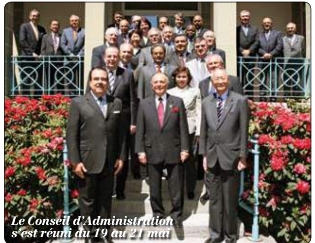
Le Conseil d'Administration s'est réuni du 19 au 21 mai

Il n'y aura aucun temps mort ce mois-ci, puisque des compétitions se dérouleront pendant les cinq week-ends restants du Tour intercontinental de la Ligue Mondiale, dont la finale aura lieu à Katowice en juillet. Quant au Beach Volleyball, trois épreuves mixtes sont prévues au calendrier, dont un Open à Espinho et deux Grands Chelems à Paris et à Stavanger, en sus d'un Open féminin à Varsovie et d'un Open masculin à Zagreb.