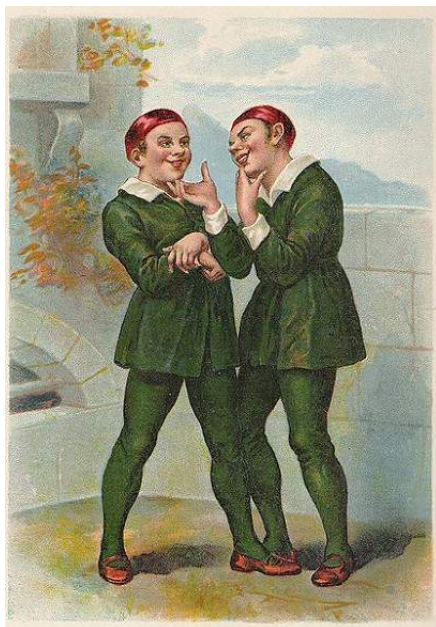
Les Dromio par Henry Richter. Illustration d'une édition de 1890

Soudain, l'abbesse arrive avec les jumeaux syracusains, et tout le monde commence à comprendre les événements confus de la journée. Non seulement les deux paires de jumeaux se retrouvent, mais l'abbesse révèle qu'elle est Emilia, l'épouse d'Egeon. Le duc accorde son pardon à Egeon. Ils sortent tous de l'abbaye pour célébrer la réunification de la famille.