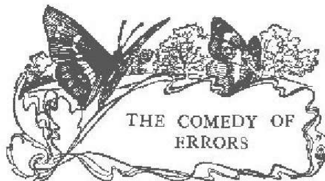
Illustration d'Arthur Rackham - 1909

Par François Pierre Guillaume Guizot - 1821