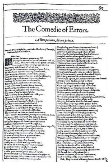
Facsimile de la première page de « The Comedy of Errors » extraite du premier in Folio de 1623

La version du texte proposée dans cette édition est celle de l'édition originale des « Œuvres complètes de Shakespeare » réalisée par Librairie académique Didier et Cie et composée de 8 volumes et plus précisément, de la réédition de cette série, réalisée entre 1862 et 1863. La numérisation choisie est celle réalisée par « The Internet Archive » et diffusée par le projet Gutenberg.