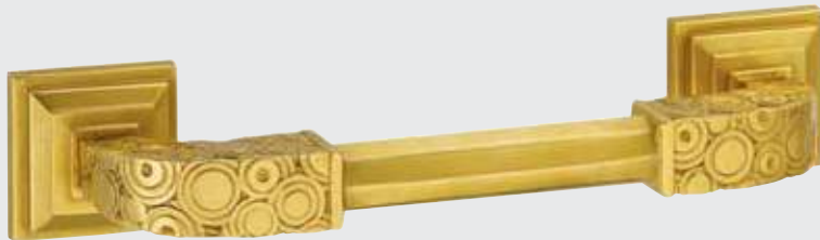
Poignée de tirage

Décorateur très fin, d'une distinction jamais démentie, auteur d'une quantité d'installations de magasins à Paris et d'intérieurs privés, il s'est particulièrement intéressé à la beauté classique et de la logique.