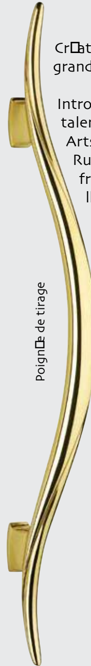
Poignée de tirage

Introduisant la modernité classique dans le mobilier, son talent est révélé lors de l'Exposition Internationale des Arts Décoratifs de 1925 où s'impose un véritable style Ruhlmann à la fois somptueux et mesuré. Décorateur français, il reflète l'élégance des formes, la discrétion de l'ornementation et la perfection technique.