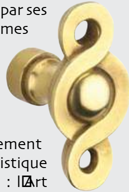
Bouton de fenêtre