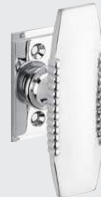
Bouton de fenêtre