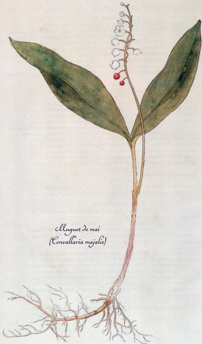
Cluguet de mai ( Convallaria majalis )