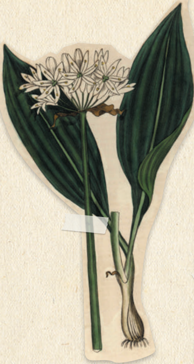
Ail-des-ours ( Allium ursinum )