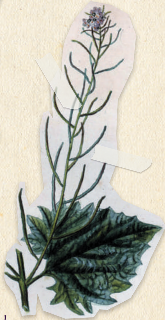
Herbe-à-l'ail ( Alliaria petiolata )