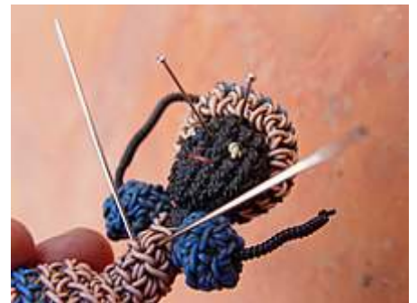
Une poupée Vaudou .

Le vaudou a été associé à la « magie noire » moderne, par le biais de la culture populaire et la fiction. Cependant, alors que les malédictions et les maléfices peuvent être regardés comme des pratiques relevant de la magie noire, le Vaudou a sa propre histoire et ses traditions qui ont peu à voir avec les traditions de la sorcellerie moderne qui se sont développées avec les pratiquants européens comme Gerald Gardner et Aleister Crowley 9,10 .