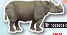
Rhinocéros de Java