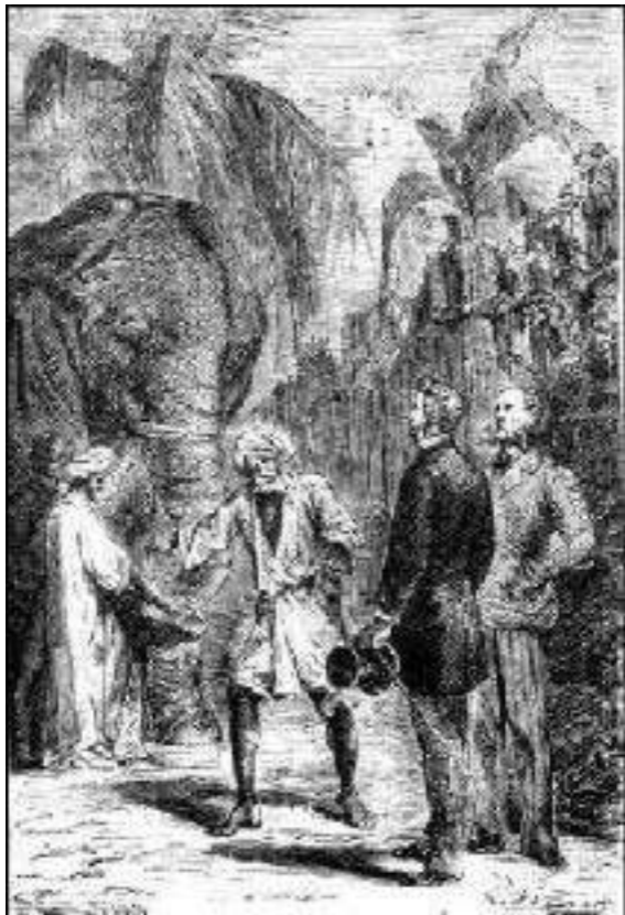
no cercado, um elefante