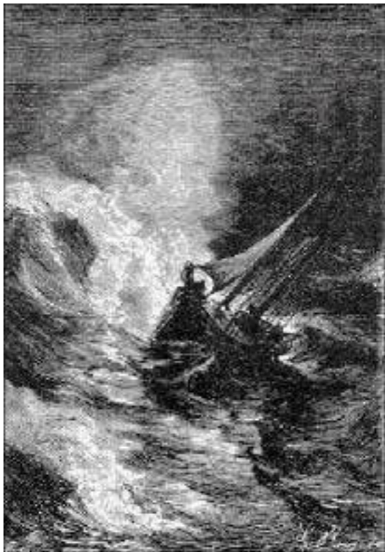
A Tankadère foi levantada como uma pena