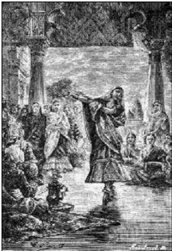
Bailarinas de Bombaim