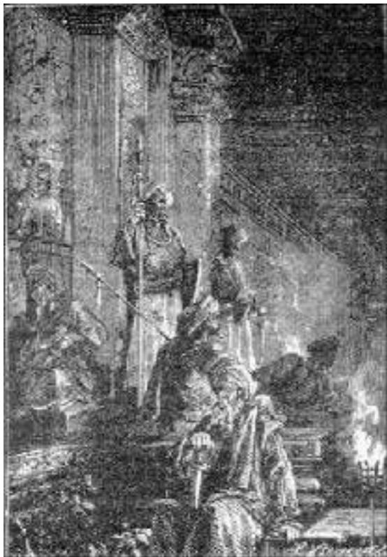
os guardas do rajá, iluminados por tochas...