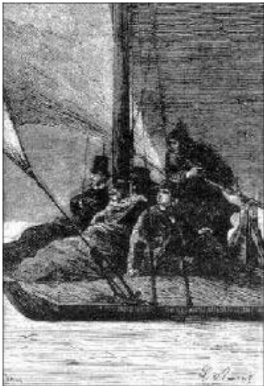
Os viajantes, apertados...