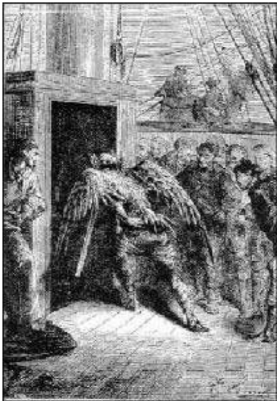
Passpartout, as asas nas costas...