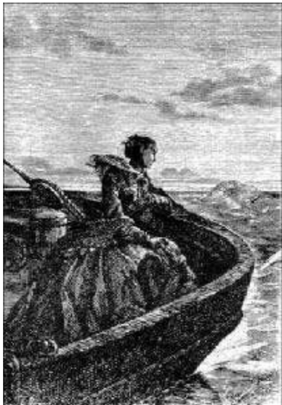
A jovem, sentada à popa...