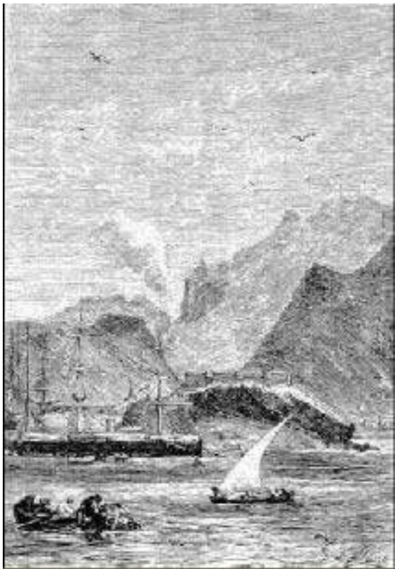
escala em Steamer-Point.