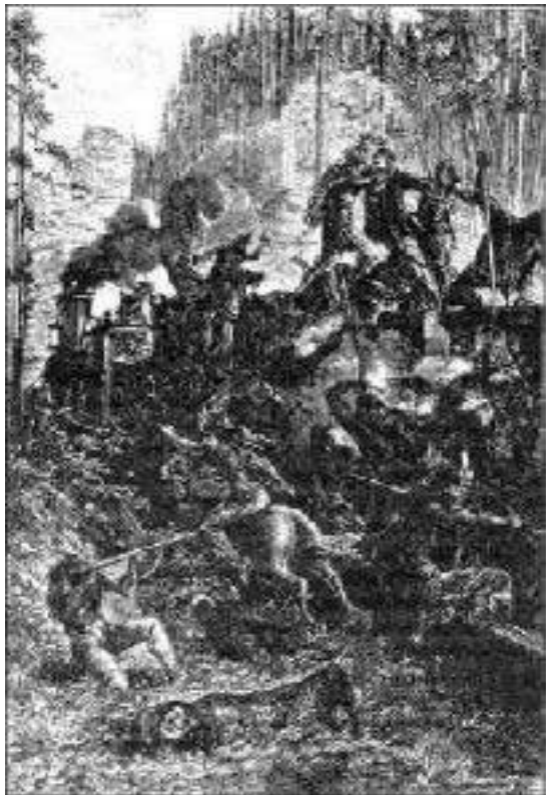
Os Sioux tinham invadido...