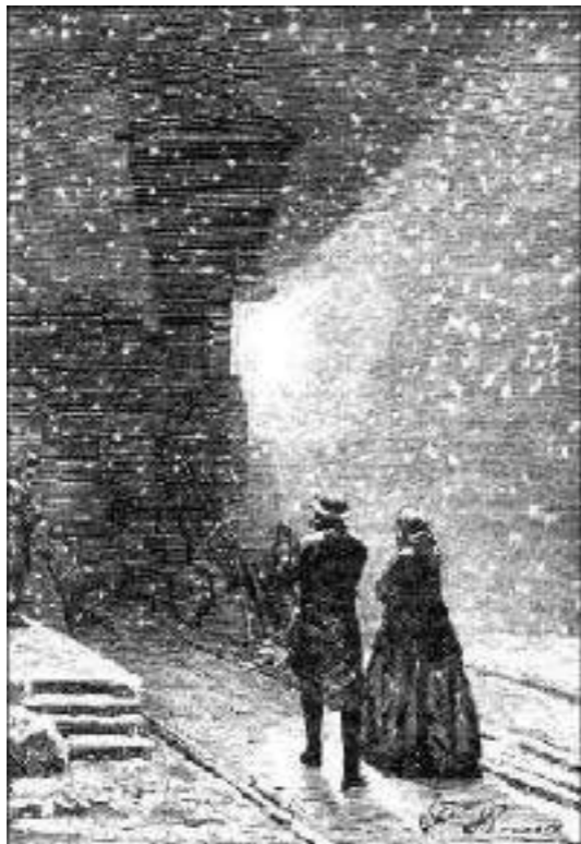
Uma enorme sombra...