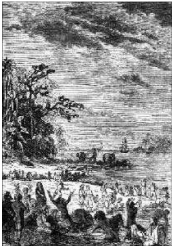
Grupos de Indianos...