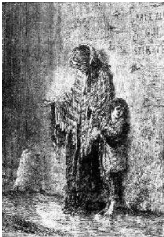
uma pobre mendicante