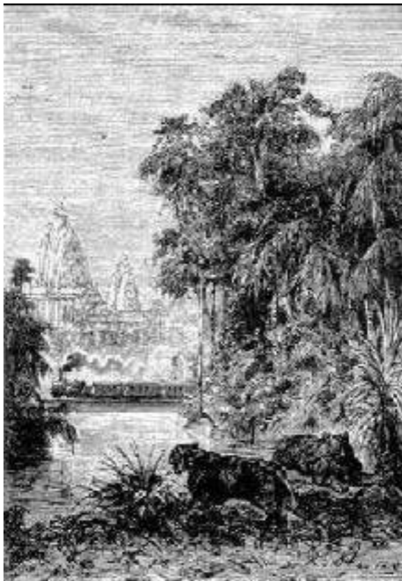
O vapor se contorcia em espirais