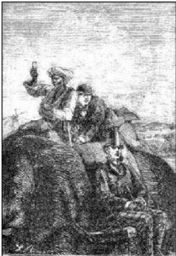
rindo entre seus saltos