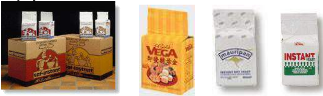
Imagen pack levadura instantánea

Presentación : Paquetes 500 grs. Duración : 10 a 12 meses en envase cerrado