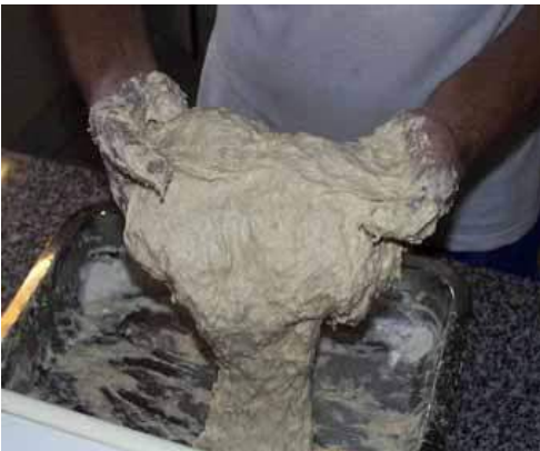
Aireado de masa