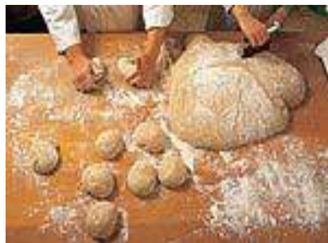
Imagen ovillado masa