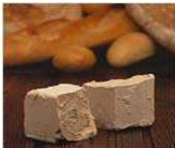
Imagen pan levadura fresca

La levadura prensada debe mantenerse en refrigeración. A temperaturas de 4 a 5 grados Celsius mantiene sus características durante 2 a 3 semanas, luego comienza a disminuir su capacidad para producir gas.