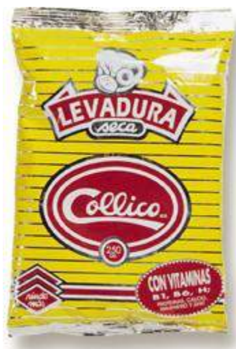
Imagen pack levadura seca granulada

Cantidad a usar: 50 grs. de L.S.G. reemplaza a 100 grs. de levadura prensada. Duración : 6 a 8 meses en envase cerrado