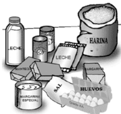
Imagen de mise en place ingredientes

Un adecuado manejo de las recetas nos permitirá mantener una calidad standard y un mejor control sobre producción y costos de la misma.