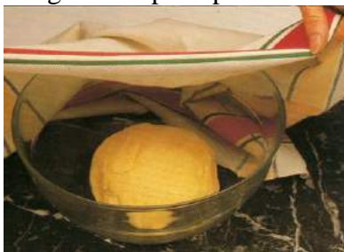
Imagen de reposo pieza masa

Luego del amasado la masa se deja reposar por 10 a 30 minutos para que se recupere del trabajo mecánico a que ha sido sometida y para que comience la actividad de la levadura.