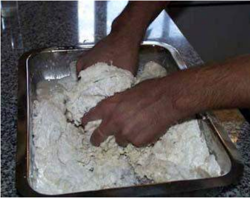
Imagen mezclado ingredientes