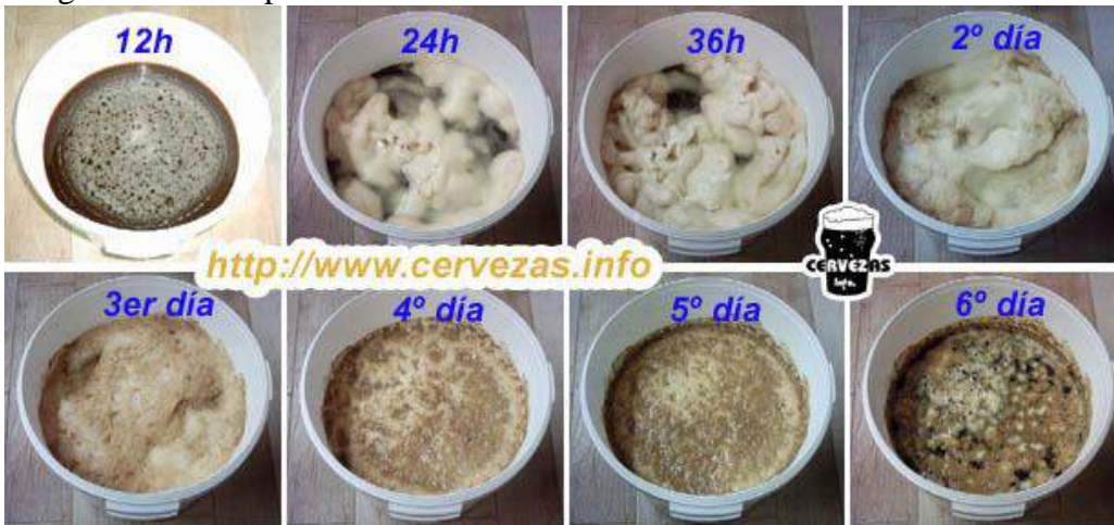
Imagen desarrollo parcial levadura: