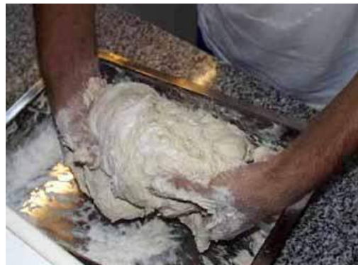
Imagen plagado masa sobre la misma