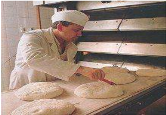
Imagen piezas masa cortadas durante la segunda fermentación

Los ovillos se colocan a reposar en bandejas o tablas, adecuadamente protegidos de corrientes de aire y en un lugar tibio de preferencia en cámaras de fermentación. Este reposo puede durar un promedio de 25 a 50 minutos.