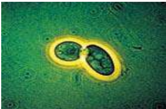
Imagen división de una célula de levadura

En 1972 se introdujo la levadura instantánea (una segunda generación de fermentos en estado seco) que ofrece al panadero una óptima facilidad en su uso y constante poder fermentativo.