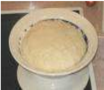
Imagen Leudo o esponja final