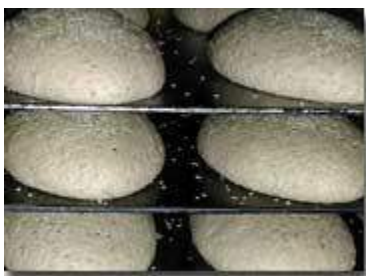
Imagen pieza masa modelada fermentando

Si colocamos en un lugar caliente y húmedo un trozo de masa hecha de harina y agua, veremos como ésta se hincha ligeramente 24 h más tarde.