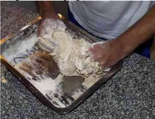
Imagen masado plagado masa