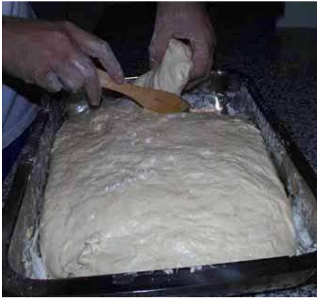
Imagen de corte pieza masa bloque