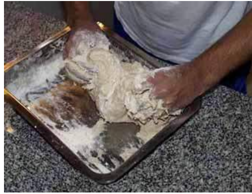
Imagen masado ingredientes