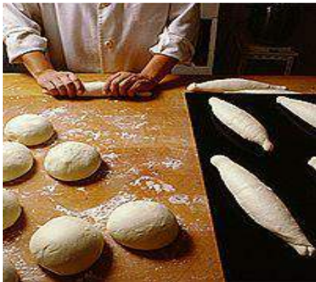
Etapas del formado mecánico (Manual)