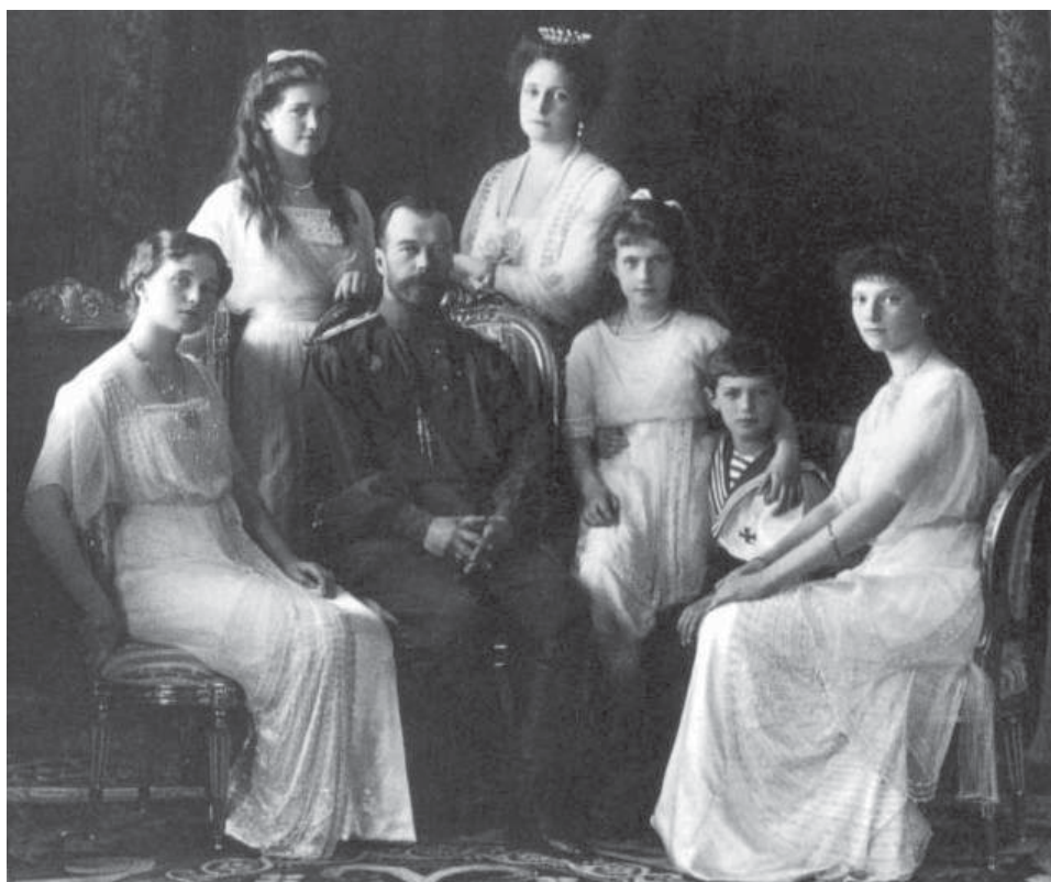
12. Nicolau e Alexandra em tempos mais felizes, com as quatro filhas e o filho.

minha alma sente e sofre contigo, muito mais do que consigo expressar por palavras». Acrescentou ainda a ideia reconfortante de que o falecido Rasputine — «o nosso querido Amigo» — rezava por ele no outro mundo 2 . Nicolau e Alexandra tinham temperamentos opostos: ela era ferosa, ao passo que o marido era ponderado. Ela decidia-se rapidamente; ele demorava a tomar decisões. Todas as noites conversavam sobre os assuntos que os incomodavam, mas nunca discutiam política na presença de terceiros 3 . Concordavam com quase tudo, e embora ela influenciasse a escolha dos ministros, não existem provas de que o tivesse demovido de alguma decisão política por ele tomada 4 .