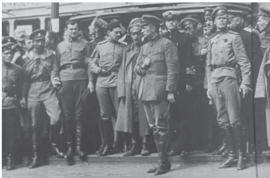
11. Alexander Kerensky entre oficiais e soldados antes da Revolução de Outubro.

Um grupo próximo de estudantes universitários e soldados levou a cabo essa tarefa, transportando o cadáver até uma mata, com vista a incinerá-lo numa pira. Algumas idosas que veneravam a memória de Rasputine foram enxotadas. No entanto, usou-se pouco material acelerante. Quase assim que se acendeu o fogo, a gasolina gastou-se e as chamas não concluíram o trabalho. Nessa altura já havia mirones, tendo alguns deles ficado convencidos de que aquilo era prova de que o morto fora um santo. Os estudantes reconstruíram a pira, que desta vez ardeu com êxito, deixando ficar apenas o esqueleto. O pequeno grupo decidiu espalhar os ossos pela clareira, mas isso encorajou as idosas a recolhê-los, tendo em vista a sua conservação como relíquias sagradas. No meio da agitação que se seguiu, os estudantes exaustos recolheram os ossos que restavam, voltaram à universidade e lançaram-nos a uma fornalha 45 . Rasputine provara ser quase tão indestrutível na morte como fora em vida. Não obstante, essa informação não foi revelada à família imperial. Como já não faziam parte ativa da cena política, só lhes era dito o que fosse assunto familiar. Eram, efetivamente, prisioneiros.