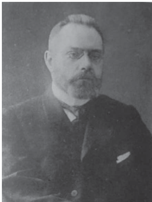
8. O outubrista Alexander Guchkov, ministro da guerra do primeiro Governo Provisório.

de assertividade. Quando voltou para junto do grupo declarou, numa voz firme, embora ansiosa, que pretendia renunciar ao trono. A discórdia entre Kerensky e os defensores de uma solução monárquica tornou-se, assim, redundante. Guchkov afirmou que não podia continuar a servir no Governo Provisório, só cedendo quando Kerensky apelou 44 .