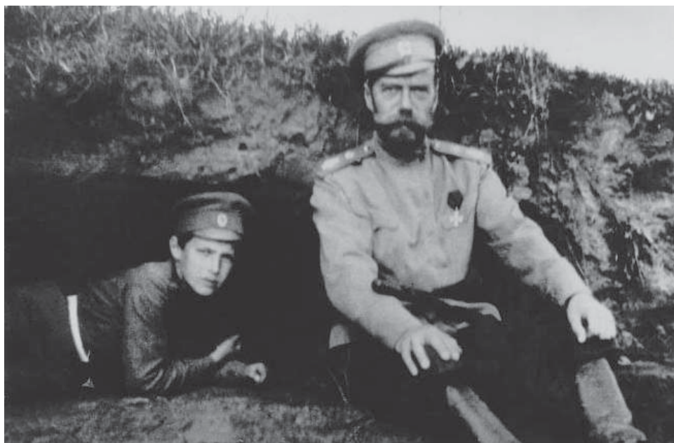
2. Nicolau II e o filho Alexei gozam um momento de descontração perto da frente de guerra.

afirmava que as tradições comunais dos camponeses russos abafavam a responsabilidade individual. Também enfatizava o orgulho nacional russo à custa dos outros povos do império — uma opinião partilhada pelos dois homens, mesmo sem que Nicolau tomasse qualquer iniciativa. Era ainda menos ativo em relação a outros pontos de governação. Os anos pré-guerra foram um período em que a indústria mostrou alguma recuperação da quase revolução de 1905-1906. Nicolau deixou o processo de gestão nas mãos dos ministros, lendo aturadamente os relatórios, mas contribuindo pouco para as discussões. Depois do eclodir da Grande Guerra, em breve se tornou óbvio que a Rússia precisava desesperadamente de aumentar a coordenação da produção industrial. Isto levou à criação dos chamados comités de indústria bélica, envolvendo tanto os industrialistas como os seus operários. O resultado foi um debate público mais vocal do que o desejado pelo autocrata em Nicolau, mas o imperador deixou-se levar pela situação. Na verdade, se pretendia uma vitória na Frente Oriental, Nicolau não tinha outra opção.