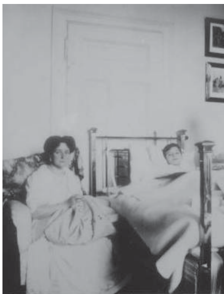
13. Uma Alexandra preocupada vela pelo filho Alexei. Alexandra culpava-se pela situação clínica de Alexei.

A saúde de Alexei continuou débil durante grande parte do resto do ano. No entanto, embora «o nosso amigo» houvesse perecido, felizmente não houve qualquer crise que envolvesse um ferimento ou uma hemorragia 22 .