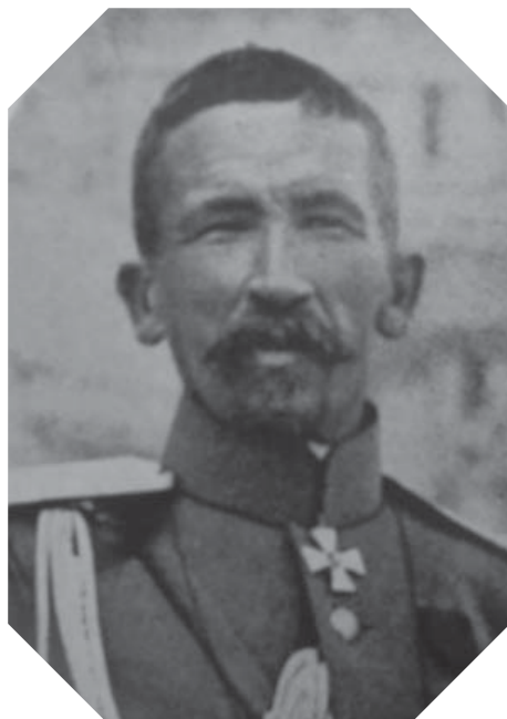
9. Lavr Kornilov, o comandante militar de Petrogrado que chegou a comandante-supremo com Kerensky. Kornilov virou-se contra Kerensky em agosto de 1917.

Os Romanov poderiam manter o séquito, mas quem decidisse ficar teria de se sujeitar às mesmas condições de cativo no palácio. Kornilov afastou toda a guarda atual, substituindo-a por um regimento de caçadores que acreditava ser de confiança 24 .