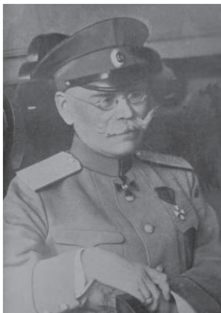
5. General Mikhail Alexeev, Chefe do Estado-Maior: de óculos, trabalhador e exausto. Alexeev pressionou gentilmente Nicolau a abdicar.

prejudiciais do que benéficos. No entanto, Fëdorov era um médico sábio que se mantinha a par das mais recentes teorias da medicina mundial; a par disso, conseguia igualmente explicar o que fazia num tom reconfortante e com uma linguagem que os leigos compreendiam 7 . Mudara-se em 1915 para o Comando Central, como médico pessoal de Nicolau, tendo-lhe sido atribuído um coupé pessoal num dos comboios; mantinha um contacto regular com comandantes e oficiais da corte. Tornara-se um dos servidores de maior confiança do imperador 8 . Fëdorov não foi alertado para o teor da conversa com o imperador, pelo que o médico mal pôde acreditar no que ouvia. O imperador não procurara um ministro ou um general, mas sim a ele, um mero clínico, para debater a mais importante questão de sucessão na história daquela dinastia.