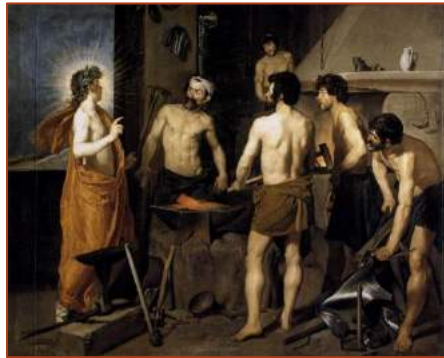
Figure 4 : Les forges de Vulcain par Velazquez

Junon honteuse d'avoir donné naissance à un enfant difforme et laid le jeta dans la mer.