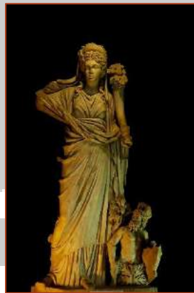
Figure 7 : Tomis Fortuna, musée de Constanța

Déesse italique très ancienne, Fortuna est d'abord considérée comme une divinité de la fertilité, dispensatrice de prospérité, avant d'être progressivement associée au