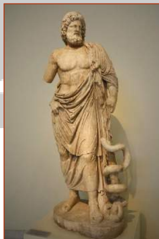
Figure 1 : Statue d'Asclépios (musée d'Athènes)

Cependant, un jour un homme lui offrit une fortune s'il ressuscitait un mort. Esculape accepta et rendit la vie à Hippolyte, le fils de Thésée. Les dieux furent offensés et Zeus ne voulant pas tolérer qu'un