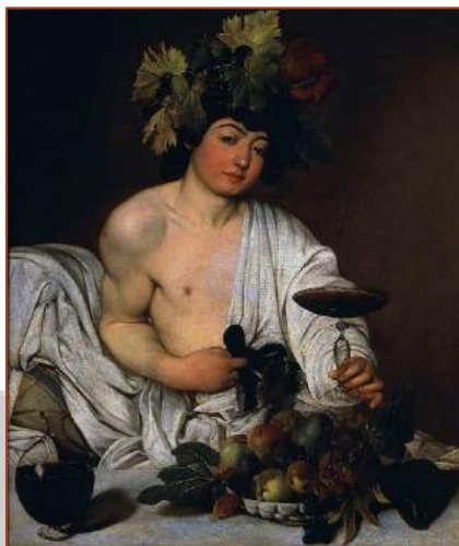
Figure 2 : Bacchus, Tableau de Caravage (1590 ?)

Il devint alors le dieu de la vigne, du vin, des festivités, de la danse, de la végétation, des plaisirs de la vie et de ses débordements.