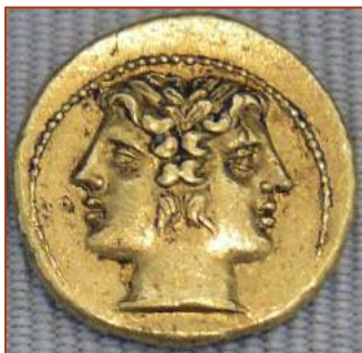
Figure 8 : Demi-statère de Rome, montrant les deux visages du dieu Janus, ca. - 217.

Janus s'y installa avec sa femme Camisè et y eut des enfants.