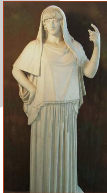
Figure 5 : copie romaine (II e siècle) d'un original grec d'Hestia Giustiniani de -460 au musée Torlonia de Rome.

Les Romains sacrifiaient au temple de Vesta avant toute intervention importante.