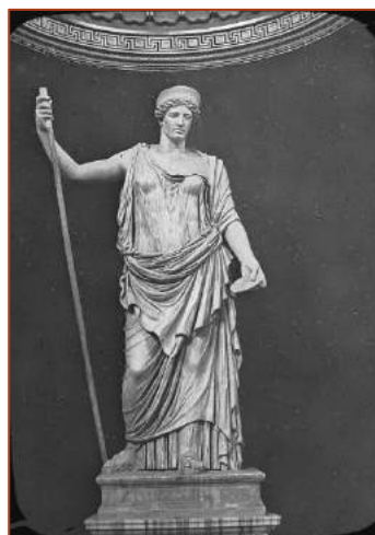
Figure 10 : Junon au Musée du Vatican, à Rome.

Elle ourdit un complot avec Neptune et Minerve pour détrôner le dieu Jupiter. Mais son dessein échoua.