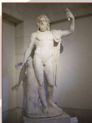
Figure 9 : Représentation de Jupiter au musée du Prado, à Madrid.

Saturne exigea de son épouse qu'elle lui remît ses nouveaux nés, et il les dévorait. Mais Cybèle par ruse parvint à sauver Jupiter et le fit nourrir et élever par deux nymphes.