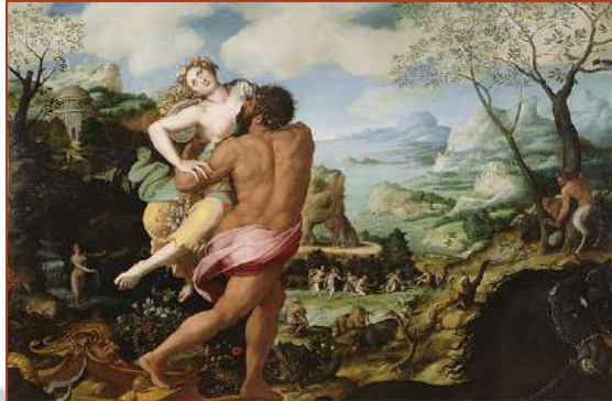
Figure 6 : Enlèvement de Proserpine Alessandro Allori (1570)

Jupiter prit une décision. Proserpine devait passer la moitié de l'année avec sa mère et l'autre moitié avec son mari, le dieu Pluton, au royaume des Enfers.