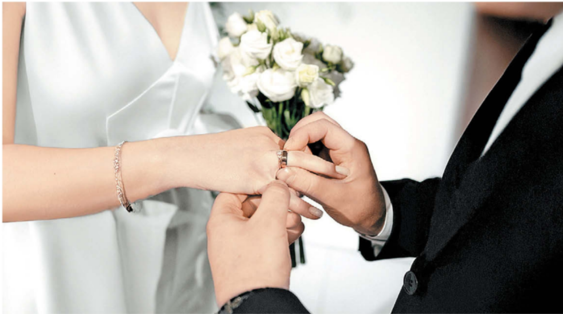
Sobre los vestidos, Momento Barcelona estima que se buscarán prendas más personalizadas.