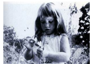
Un momento del spot "Daisy Girl" (1964).