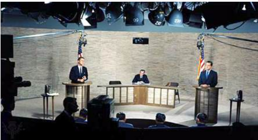
Momento del debate presidencial entre John Fitzgerald Kennedy y Richard Nixon en 1960.

Con los años, se han inventado y han evolucionado nuevos medios de comunicación –cable, vídeo, Internet, etc.– y estos medios han sido incorporados inmediatamente a la comunicación política.