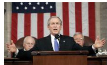
George W. Bush pronunciando uno de sus discursos sobre el estado de la Unión.

Numerosos autores estadounidenses han defendido la postura por la que el presidente de los Estados Unidos, en cierta manera, es uno de los principales gatekeepers , ya que todo lo que está relacionado con su persona se convierte en noticia de los medios de comunicación. Otros trabajos experimentales han hecho diferencias entre los tipos de editores o aduaneros según cuál sea el medio. Con todo, diversos y significativos trabajos confirmarían la hipótesis sobre uno de los principales determinadores de la agenda: las agencias de noticias, que marcan las agendas del resto de medios de comunicación y que serán seleccionadas por los gatekeepers . Los temas proporcionados por las agencias servían de referencia a los medios al indicar cuáles iban a ser los temas más destacados del día y en los últimos tiempos, también gracias a las tecnologías de la comunicación, las notas de prensa de partidos e instituciones han demostrado su eficacia a la hora de influir (en muchos casos eficazmente) sobre la figura del aduanero de la información. En esto consiste construir agenda y