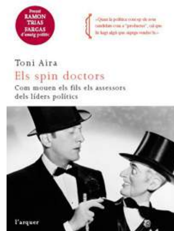
Portada del libro de T. Aira (2009). Els spin doctors: com mouen els fils els assessors dels líders polítics . Barcelona: Mina.

Spin doctor es el término anglosajón utilizado para referirse a los estrategas y asesores de comunicación de los profesionales de la política. Esta denominación se empieza a popularizar entre 1850 y 1900. Servía para denominar a