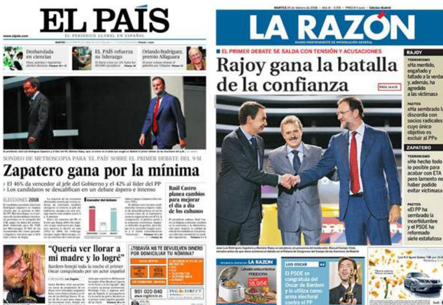
Portadas de La Razón y El País del día después del debate del 25 de febrero del 2008 entre los candidatos a la Presidencia del Gobierno español, José Luis Rodríguez Zapatero (PSOE) y Mariano Rajoy (PP). Las dos portadas destacan "ganador".

Sin embargo, en el otro extremo se encuentra el bandwagon , que hace que los electores fluctúen a favor del candidato que parte como ganador. Éstos serían los que apuestan por el caballo ganador en cualquier tipo de elección. Estos dos efectos no son cuantificables y no responden a unas coordenadas medibles ni predecibles. Estos efectos directos de las encuestas, con todo, hay que matizarlos en trascendencia, ya que ésta puede no llegar a ser significativa en la mayoría de casos y, como ya hemos apuntado, es muy difícil cuantificar.