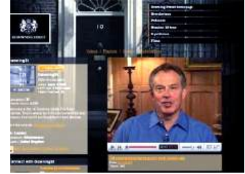
Tony Blair, aún en su recta final como primer ministro británico, demostró una firme creencia en las TIC al servicio de la comunicación política. En la imagen, el día del estreno del canal oficial del 10 de Downing Street en Youtube.

En este punto volvemos a destacar que el marketing político surge y se desarrolla con éxito precisamente en los Estados Unidos en primer lugar porque el marketing político ha crecido de forma paralela al avance de las tecnologías de la comunicación. Y se considera la campaña de 1960, la que enfrentó a John Fitzgerald Kennedy con Richard Nixon, la del nacimiento de la comunicación política moderna, con un Kennedy que protagonizó una campaña electoral modélica y que se convirtió en el primer político de gran relieve al aceptar someterse al aprendizaje de cómo actuar ante las cámaras de televisión. Este factor se reveló como una nueva gran arma electoral a raíz de la importancia que se adjudicó al ya mítico primer debate Kennedy-Nixon.