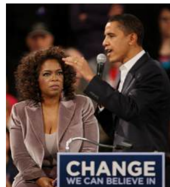
La política es comunicación. En la foto, Barack Obama, en campaña por la Presidencia de Estados Unidos, con la presentadora de televisión Oprah Winfrey.

Por otra parte hay quienes advierten sobre lo que consideran confusión en la utilización de los términos comunicación política y marketing político, y restringen este último al periodo electoral estricto (Bouza, 1995).