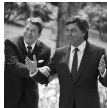
Felipe González y Ronald Reagan fueron claros ejemplos de hiperliderazgo.