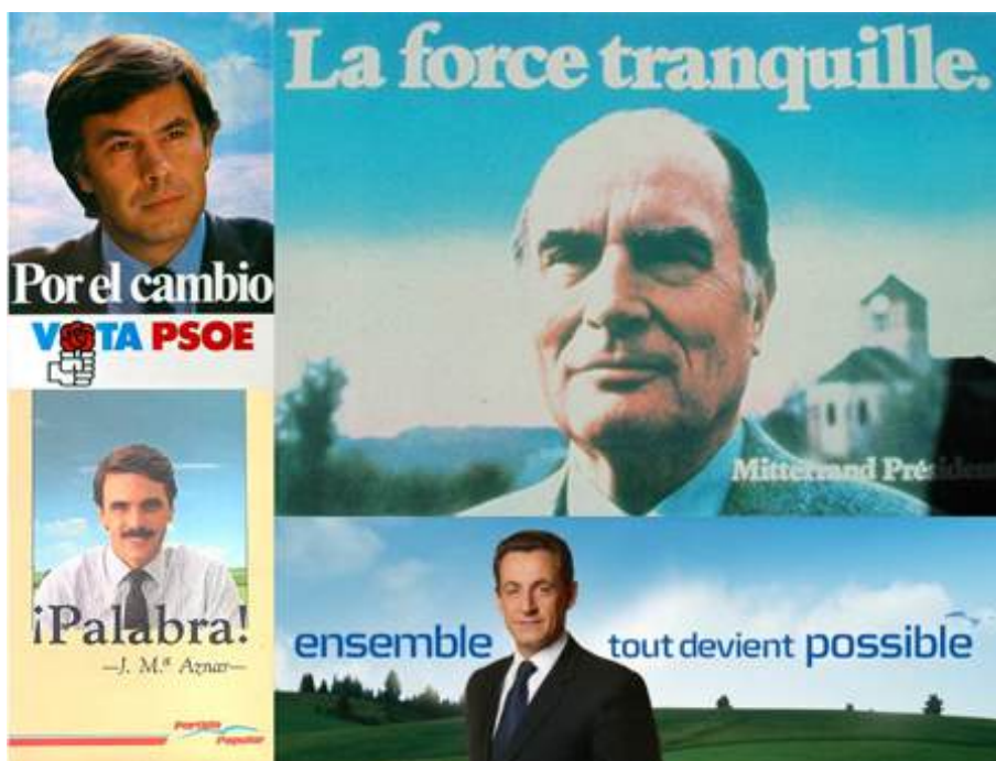
Carteles electorales (con fondo de cielo azul) de Felipe González (1982), François Mitterrand (1981), José María Aznar (1989) y Nicolas Sarkozy (2007).

La comunicación política contemporánea utiliza las herramientas de comunicación más adelantadas del momento para llevar a cabo sus estrategias, pero también muchas otras de ayer y de siempre, sistemas tradicionales que existían ya antes de la llegada de los mass media y que se siguen utilizando a principios del siglo XXI de forma renovada. Los mítines y los carteles son un ejemplo. Hay herramientas tradicionales unidireccionales y otras que permiten un contacto directo con la gente –una interactividad–, ya sea a través de un contacto verdaderamente directo, como el que se pueda dar con comidas o encuentros sectoriales más reducidos, ya sea mediante actos que simulan ese contacto directo, como es el caso de los mítines ante grandes auditorios.