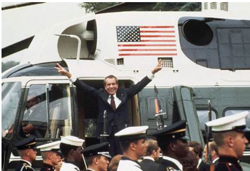
El 9 de agosto de 1974, Richard Nixon deja la Casa Blanca en manos de Gerald Ford a raíz del escándalo del Watergate.

Se trata del escándalo político que provocó una grave crisis constitucional durante los años setenta del siglo XX en los Estados Unidos. Este escándalo tomó el nombre del hotel de Washington, sede del comité electoral demócrata, donde tuvo lugar un robo de documentos y que acabó con la dimisión del presidente Richard Nixon. El escándalo Watergate arrancó el 17 de junio de 1972 con la detención de cinco hombres, a sueldo del comité de reelección del presidente republicano Richard Nixon, cuando intentaban entrar de forma ilegal y colocar aparatos de escucha en las oficinas del comité nacional del Partido Demócrata, en el edificio Watergate de Washington. La conspiración para encubrir este delito desencadenó una investigación conducida por los periodistas Carl Bernstein y Bob Woodward, del The Washington Post , que duró 26 meses. Con ellos, se desenterró una red de espionaje político, sobornos y uso ilegal de fondos, que tuvo como resultado el procesamiento de cuarenta altos cargos y la dimisión del mismo presidente el día 9 de agosto de 1974, un hecho sin precedentes en los Estados Unidos.