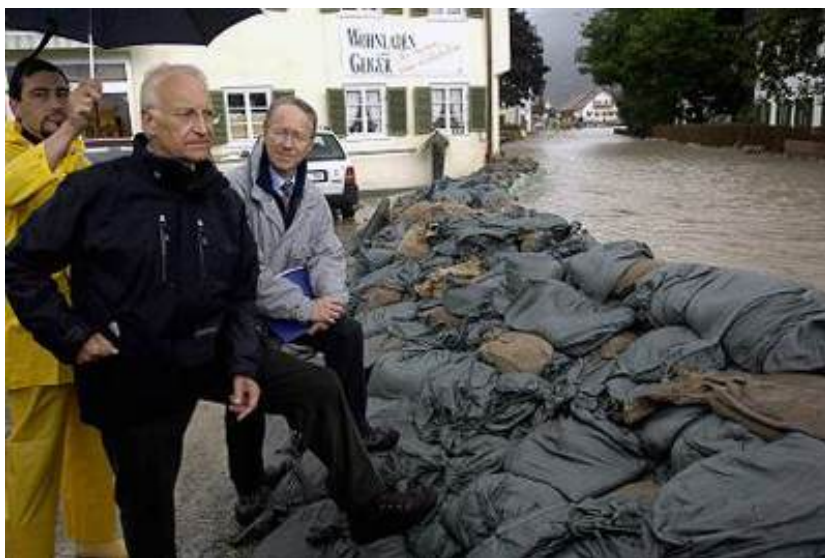
Stoiber, en 2002, visitando las zonas afectadas por los aguaceros de julio de aquel año, a dos meses de las elecciones del 22 de septiembre.

La imagen de Schröder con botas de agua pisando el terreno siniestrado, prometiendo ayudas y acompañando a los ciudadanos afectados por las consecuencias del aguacero reforzó su proyección de gobernante, lo dinamizó, lo rehabilitó a los ojos de una sociedad que sólo unas semanas antes se decantaba claramente por su oponente democristiano. Hay que apuntar que Stoiber, por su parte, ayudó con una lentitud de reflejos que hizo que las primeras horas renunciara a visitar las zonas inundadas, argumentando que aquello habría sido por su parte un gesto electoralista. Tardó más de un día en reconducir su actitud, un desfase de tiempo que, a pesar de ser breve, fue suficiente para fijar dos imágenes contrastadas a los ojos de la ciudadanía.