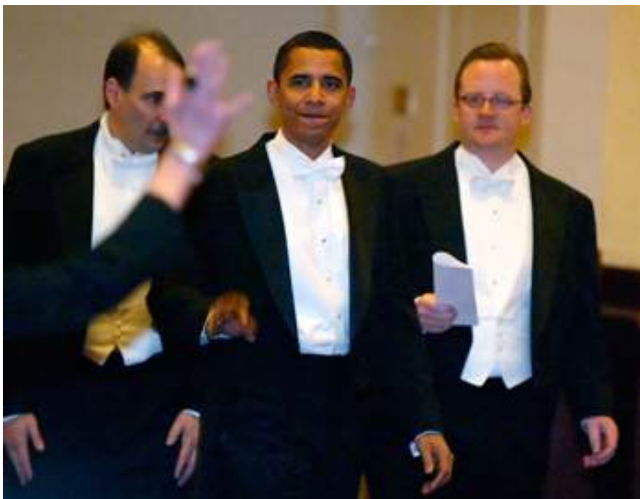
Presidente s. XXI. Obama con su principal estratega, David Axelrod (izquierda), y su director de Comunicación, Gibbs Robert.

Nosotros nos aproximamos desde el ámbito académico, precisamente destacando que la constatación de un "nuevo estilo de hacer política" no implica necesariamente un "peor estilo de hacer política". En este sentido, se trata de un campo de investigación académico, pero también de una importante disciplina profesional, que abarca tanto a expertos en marketing, publicidad y relaciones públicas como a periodistas y sociólogos, entre otros.