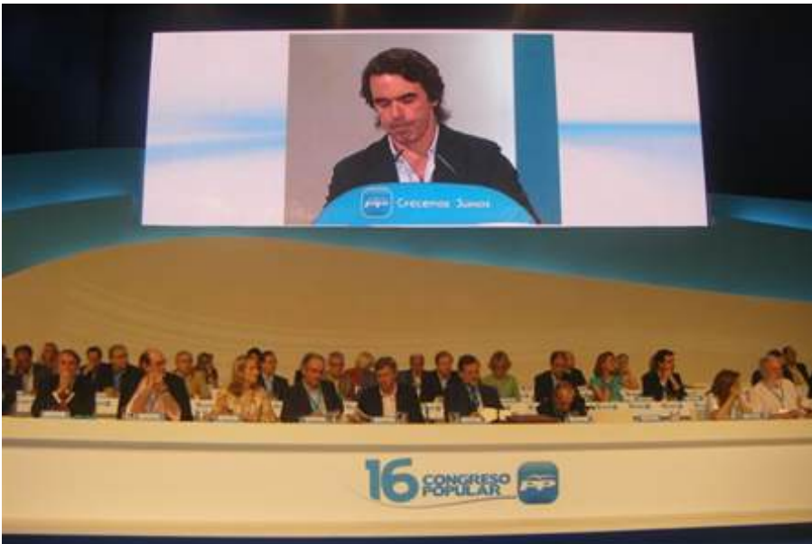
El aznarismo dominó el PP desde principios de los noventa y hasta el 2004.

El fenómeno de la personalización de la política demuestra hasta qué punto se convierte en central la figura del líder político en un contexto en el que los partidos someten buena parte de la estrategia política a priorizar el cómo por encima del qué , la imagen por encima del discurso y, para conseguirlo, las técnicas del marketing y de la comunicación política contemporánea cuentan con la figura del líder como icono. Así se relegan las estructuras de partido a un segundo plano, como quedan en segundo término las relaciones interpersonales y la prepolítica frente a los medios a la hora de proyectar los mensajes y de intentar incidir en la opinión pública.