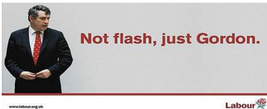
El primer ministro británico, Gordon Brown, ejemplo de liderazgo sin carisma.

carisma básicamente reside en los ojos del que mira, es decir, del auditorio o del electorado. Ahora bien, todos los líderes carismáticos se caracterizan por la elocuencia y por el dominio del lenguaje de las emociones.