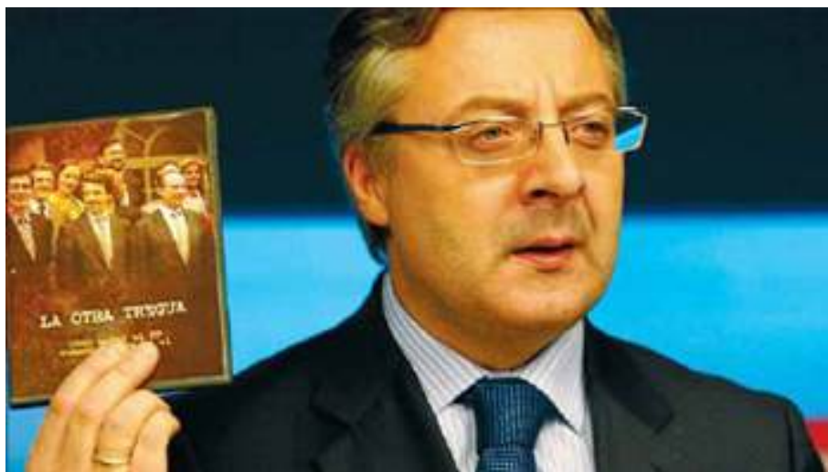
En noviembre del 2006, el PSOE editó el vídeo "La otra tregua" en respuesta a los ataques del PP por las conversaciones del Gobierno de Zapatero con ETA.

Sin embargo, en este punto queremos acercarnos a otra herramienta del mix de comunicación que no hemos abordado hasta ahora: el marketing directo. En el ámbito de la comunicación política, se trata de una denominación genérica que integra un conjunto de instrumentos que permiten, por separado o por acumulación, una simulación de bidireccionalidad y la simulación de una conexión directa entre el político y el ciudadano. Algunos de estos instrumentos, como el correo o el teléfono, hace muchos años que existen, pero nunca como ahora se habían utilizado de forma tan rigurosa y sistemática para transmitir el mensaje político. Otros instrumentos, como el vídeo –y más recientemente el DVD–, son medios que se han utilizado desde un principio con el propósito de la comunicación política.