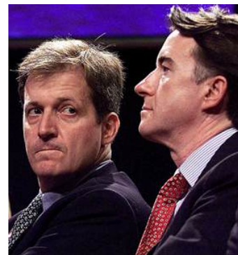
Alastair Campbell (izquierda) y Peter Mandelson (derecha) fueron durante años los arquitectos de la estrategia política de Tony Blair.

La introducción del marketing político se produce con la elaboración de una estrategia de comunicación política, es decir, una estrategia global de diseño, racionalización y transmisión de la comunicación política moderna. Definir y ejecutar este tipo de estrategia de comunicación política hace necesario un complejo proceso que tiene que incluir los diferentes factores propios de la comunicación del político para evitar, de este modo, contradicciones entre los diferentes tipos de acción utilizados. La estrategia responde a un objetivo conocido por el receptor del mensaje. Ésta es la parte esencial de la tarea de un equipo de asesores, de expertos en comunicación y marketing en muchos casos, conocidos como spin doctors . Ellos formarán la "caja de ideas", el llamado think tank del candidato y el círculo más próximo –y a menudo bunkerizador– del centro de decisiones.