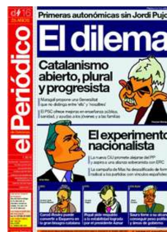
Portada de El Periódico de Catalunya del 16 de noviembre del 2003, día de las elecciones catalanas, que enfrentaron al socialista Pasqual Maragall (PSC) y al nacionalista Artur Mas (CIU).

En la prensa, el lector, entre el resto de la oferta, se encuentra con la presencia del político en su diario. Está contrastado por multitud de estudios que la gente tiende a comprar aquella prensa con la que se siente más cómodo, evidentemente también en el campo ideológico, además de por cuestiones más tangibles como la pertenencia a una determinada comunidad, clase social o grupo lingüístico. El lector se hace suyo el diario y eso da una credibilidad añadida, a los ojos de éste, de las informaciones que aparecen en el diario. En la mayoría