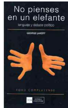
Portada del libro de George Lakoff No pienses en un elefante. Lenguaje y debate político (2007)

Un segundo nivel de la agenda-setting intenta ir más allá de las simples cogniciones temáticas y explora los juicios o los atributos específicos de un tema. En 1995, McCombs y Evatt señalan que los medios no sólo consiguen transferir la prioridad de determinados temas, sino que también se transmite la preeminencia que los medios otorgan a determinados rasgos o atributos de los temas. Es decir, los medios resaltan o esconden aspectos y elementos particulares de las cuestiones con el subsiguiente impacto sobre la agenda pública (López-Escobar, McCombs y Del Rey, 1996, pág. 39-65).