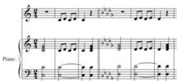
Fig.2 Ejercicio vocalización: intervalos 2ª

La selección de la altura tonal del acorde inicial del ejercicio es una decisión que debe tomar el director en función de las voces.