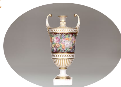
АРОМА ВАЗА СА ПОКЛОПЦЕМ