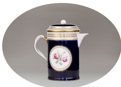
БОКАЛ СА ПОКЛОПЦЕМ ЗА КРАС