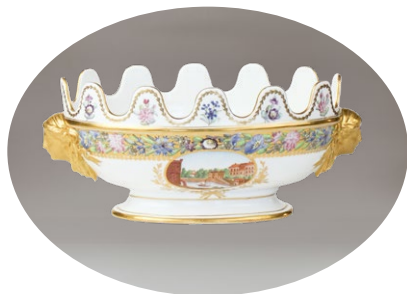
ПОСУДА ЗА ПРЕНОШЕЊЕ ЧАШИЦА ИЗ КАБИНЕТСКОГ СЕРВИСА