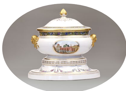
ТЕРИНА СА ПОКЛОПЦЕМ НА ПОСТОЛУ ИЗ КАБИНЕТСКОГ СЕРВИСА