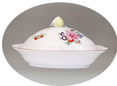
ТАЊИР СА ПОКЛОПЦЕМ ИЗ СВАКОДНЕВНОГ СЕРВИСА