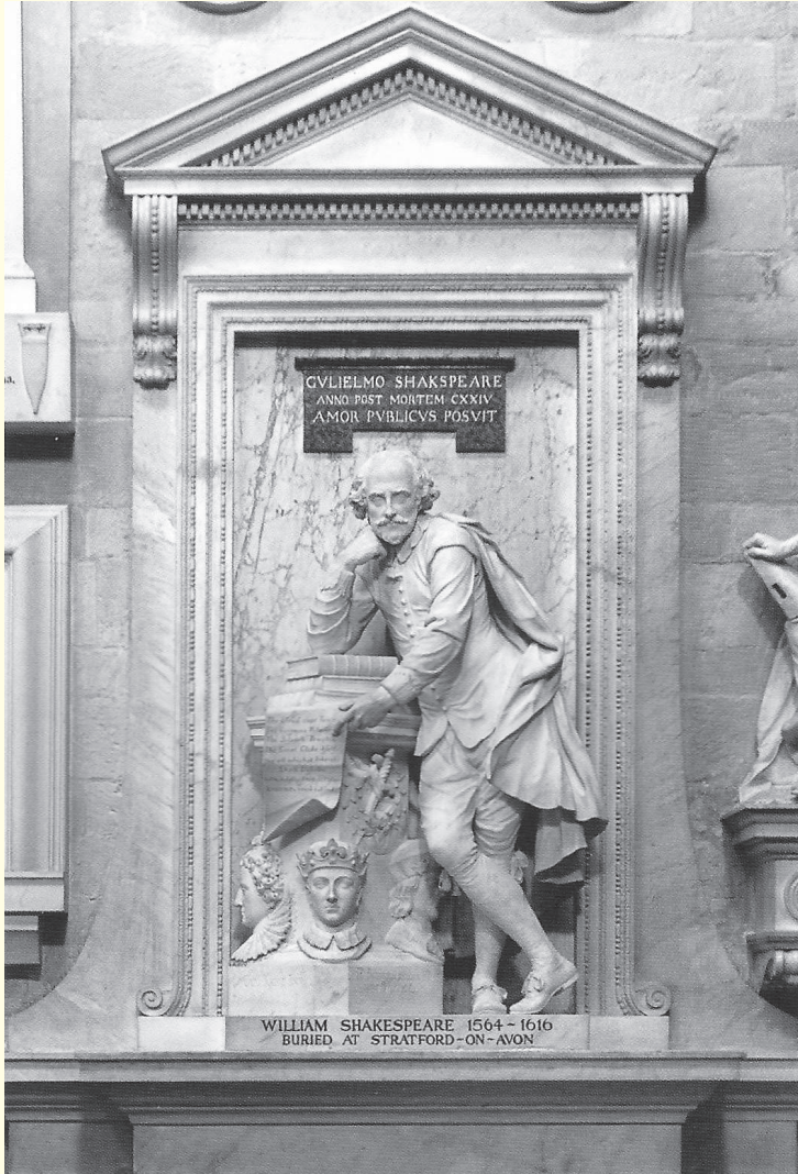
Memorial a William Shakespeare, Poets Corner, Westminster Abbey, London, UK. Mármore branco, Peter Scheemakers, 1741.