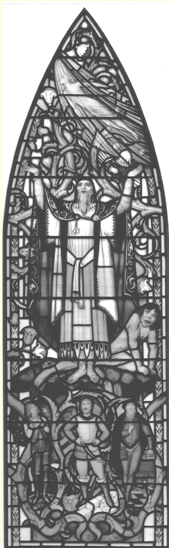
Shakespeare Window, Southwark Cathedral, London, UK. Christopher Webb, Abril 1954. Na parte superior estão representados Próspero, Caliban e Ariel; na parte inferior, as três idades do homem, conforme o discurso de Jaques em As you like it (Do jeito que você gosta).