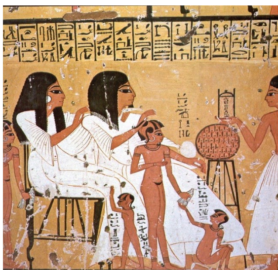
Fig.3 - Cena de grande intimidade familiar: Inherkau com esposa e netos e netas recebendo oferendas.

As mesmas concepções estão subjacentes às representações pintadas do túmulo de Ipuy (TT 217), em Deir el-Medina, escultor da época de Ramsés II, ou aos baixos-relevos do túmulo de Ramose (TT 55), da XVIII dinastia, em Cheikh Abd el-Gurna (Porter & Moss, 1994, pp. 308, 316).