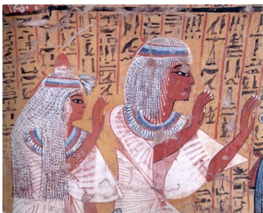
Fig.6 - Para indicar a sua idade, o casal é representado com os cabelos brancos. Túmulo de Arinefer (TT 290). XIX Dinastia. Deir el-Medina.