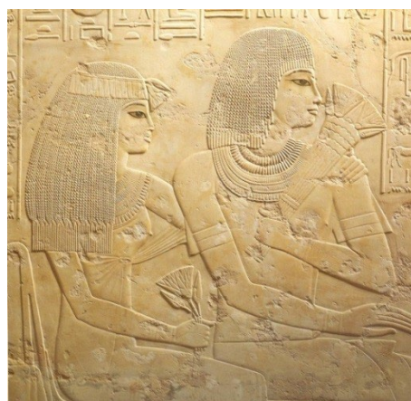
Fig.5 - May e Uerel, convidados para o banquete funerário. Túmulo de Ramose (TT 55). XVIII Dinastia. Cheikh Abd el-Gurna.

representado de uma forma talvez menos idealizada (estamos perante um homem gordo ou, pelo menos, de formas mais avantajadas), as restantes figuras (masculinas e femininas), sentadas, em poses convencionais, serenas, apresentam as ideais forma e beleza físicas, isentas de quaisquer imperfeições humanas (Weeks, 2005, p. 445; Hodel-Hoernes, 2000, pp. 42-64). As lindíssimas cabeleiras, os bouquets de lótus que homens e mulheres seguram nas mãos, os colares, os diademas, os brincos, as pulseiras e as braceletes que ostentam ajudam à desejada composição ideal do corpo humano.