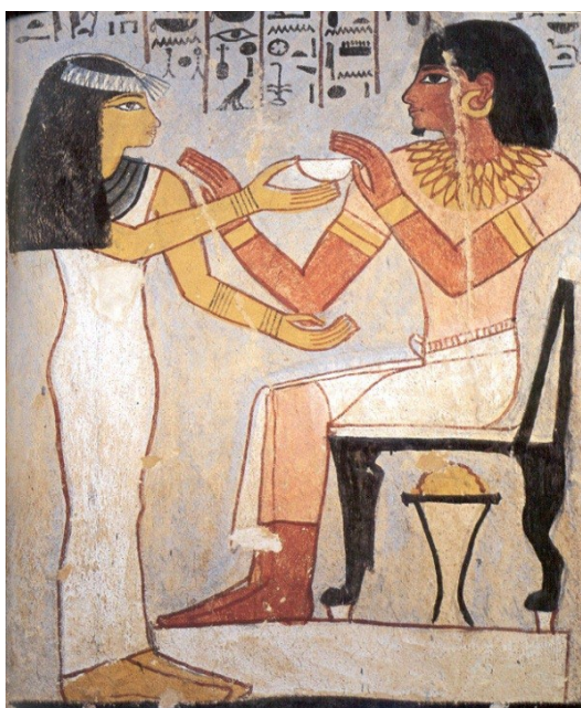
Fig.1 - Merit, a esposa de Sennefer, oferece-lhe uma bebida. Túmulo de Sennefer (TT 96). XVIII Dinastia. Cheikh Abd el-Gurna. Câmara funerária. Pilar posterior direito.

Além deste aspecto da aplicação do princípio da coloração que significa e implica que pela cor podemos identificar os seres e objectos representados na pintura egípcia, constatamos que Sennefer e as várias figuras femininas são representados de forma idealizada, no auge da sua maturidade juvenil, com uma beleza física invejável, quase inultrapassável: Sennefer é jovem e vigoroso e as mulheres jovens, esbeltas, formosas. Em caso algum se vislumbram as marcas da passagem do tempo linear. Estamos perante figuras em contexto fúnebre que não denotam quaisquer marcas da passagem do tempo e que, simultaneamente, proclamam uma juventude eterna. O tempo nelas estacionou. Aqui não há cansaço, olhos