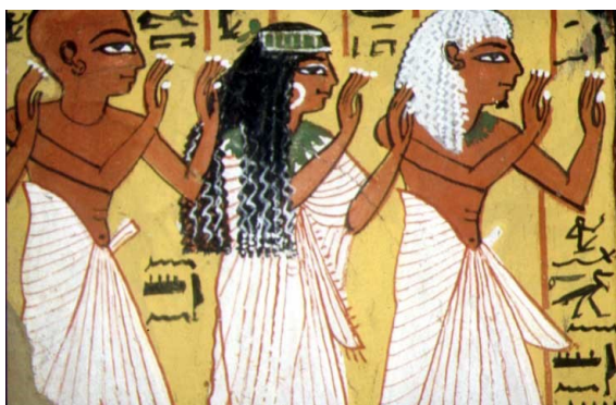
Fig.7 - A mãe de Pachedu com uma cabeleira de pontas grisalhas e o pai com uma cabeleira de cabelos brancos. Túmulo de Pachedu (TT 3). XIX Dinastia. Deir el-Medina.

Todos estes exemplos são, em nossa opinião, suficientes para se compreender que, por princípio, nas composições pintadas e incisas egípcias eram eliminados todos os elementos que pudessem reenviar para o provisório, para a efemeridade, para a transitoriedade. Os desenhadores, pintores e escultores anulam ou disfarçam intencionalmente as marcas dos aspectos eminentemente transitórios e passageiros, do presente e fixam-se nos duradouros, permanentes, «eternos» (Sales, 2007b, pp. 178, 179). Esta preocupação era tanto mais sentida quanto é certo que os prospectivos ocupantes do túmulo inspecionavam regularmente os trabalhos de construção e de decoração da sua «morada eterna», em vida, sugerindo imagens pretendidas, em tipo e em forma, e criticando obviamente as que não satisfaziam os seus intentos (Taylor, 2001, p. 173). Estava em causa o «conforto eterno» do(s) defunto(s).