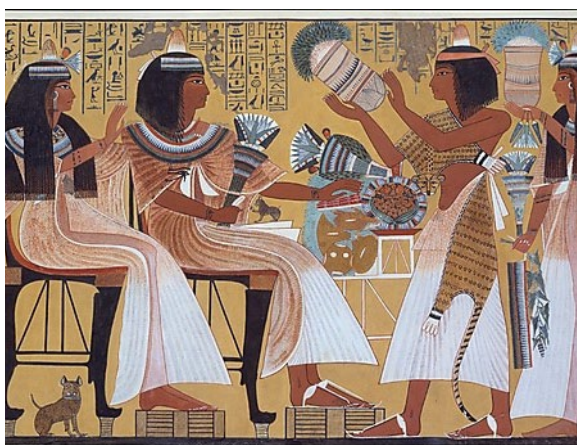
Fig.4 - Ipuy e a sua esposa, Duammeres recebendo oferendas dos seus filhos. Cena de enorme elegância e sensualidade. Túmulo de Ipuy (TT 217). XVIII Dinastia. Deir el-Medina.

de ambos, grinaldas de flores frescas sobre a cabeça da mulher, brincos, colares usekh , pendentes, pulseiras, braceletes, sandálias) confere a esta figuração um imenso glamour . Se os corpos são perfeitos e formosos, os traços escolhidos para o desenho dos rostos são de uma beleza inigualável. Estamos perante autênticos top-models , segundo a concepção de representação egípcia (Porter & Moss, 1994, p. 316).