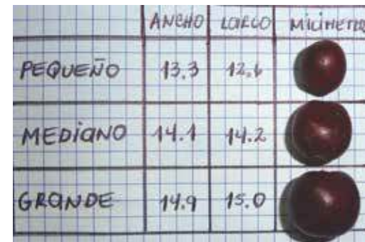
El tamaño de los frutos varía de 13.3 a 14.9 mm de ancho y de 12.6 a 15.0 mm de largo