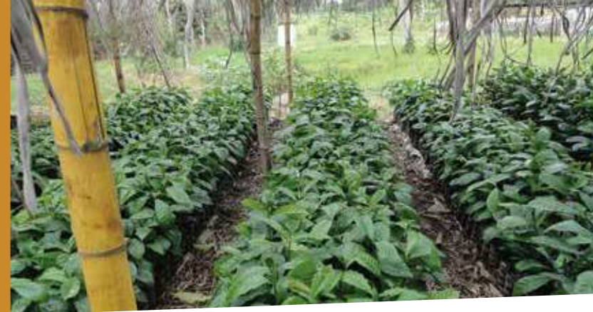
Elaboración de almácigos de robusta en bolsa

A continuación se describen las actividades para el manejo de los almácigos en bolsa, aunque ellas pueden ser válidas y aplicables a las otras alternativas de producción de plantas.