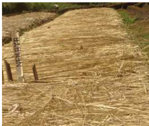
El material vegetal que se utilice de cobertura debe estar libre de semillas