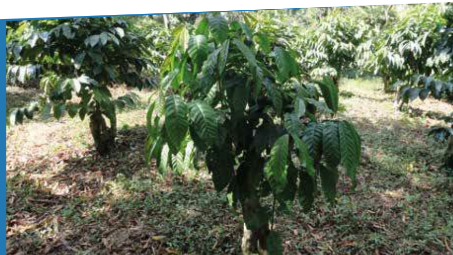
Recepa en café Robusta en bloque compacto

c. Manejo selectivo: se basa en la selección de cafetos a