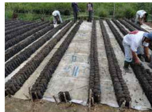
Uso de sacos de brin como cobertura en las calles

Otra de las alternativas para el control de malezas en almácigo es el uso de coberturas en las calles, tales como aserrín, cascabillo, sacos de brin o nylon.