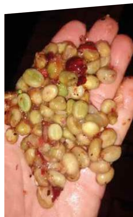
Granos de café Robusta con el mucilago adherido

En algunas unidades productivas se ha mejorado la calidad y apariencia del grano mediante un pre-lavado del café de 24 horas en las pilas de fermentación. Para ello se utiliza una bomba centrífuga que, por fricción, remueve un alto porcentaje de miel y elimina la pulpa que quedó adherida después del despulpado. Luego se continúa con el proceso de fermentación dentro de las mismas pilas, sin agua, durante 36 horas más, haciendo un total de 60 horas, tiempo en el cual el café está listo para el lavado final.