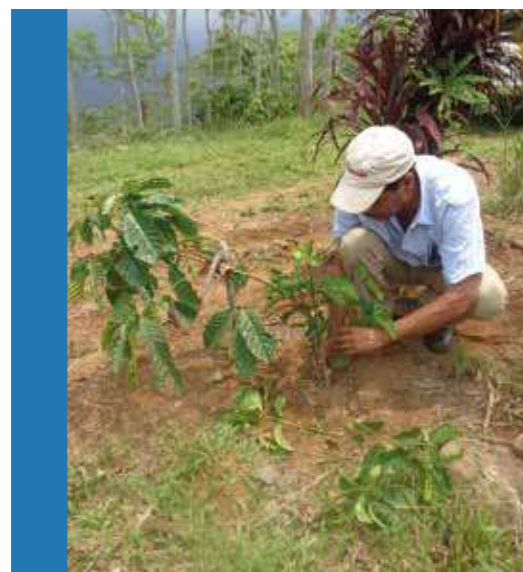
Se deben seleccionar los brotes vigorosos, sanos y bien distribuidos

En la poda tipo Guatemala o agobio, el primer deshije se efectúa a los tres meses después del agobio, dejando de dos a tres brotes. El segundo deshije se realiza a los seis meses.