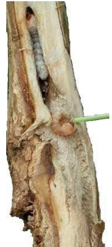
Lo que revela la infestación es la presencia de un puñado de aserrín al pie del café que cae desde el agujero que el insecto va haciendo dentro del tronco

cúbicos por galón de agua, en las perforaciones realizadas por el barrenador utilizando jeringas.