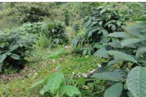
Identificar adecuadamente las malezas presentes en la plantación permite estructurar programas efectivos de control

• Quemantes o de contacto: marchitan y desecan inmediatamente las plantas al aplicarlos.