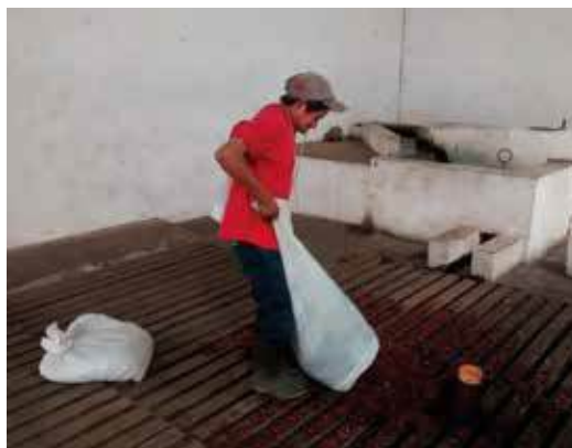
El café cortado se puede clasificar en los sifones tradicionales