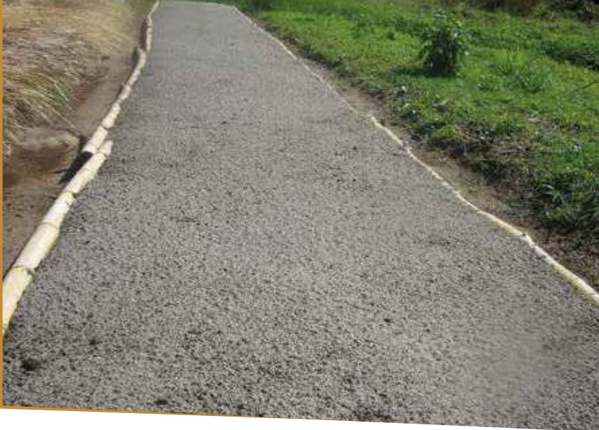
La cantidad de tabloncillos de semillero, depende del volumen de semilla a sembrar