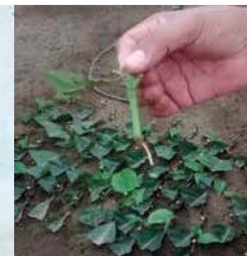
Propagador para estacas