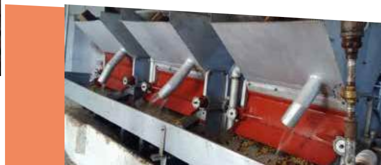
Los despulpadores de tipo horizontal funcionan muy bien para remover la pulpa

b. Tipo de despulpadores: en cuanto al tipo de despulpadores para remover la pulpa de las frutas del café Robusta se pueden utilizar los de cilindro horizontal o de cilindro vertical. Cualquiera de las dos opciones funcionan bastante bien, siempre y cuando los pechos estén graduados adecuadamente. En ambos tipos de despulpadores este proceso no es tan eficiente por lo que es imprescindible contar con un buen sistema de clasificación de café despulpado y un buen repasador; de esta forma, se procura que el café despulpado llegue lo más limpio posible a las pilas de fermentación. Los despulpadores repasadores también deben graduarse entre 3.5 y 4.5 milímetros, así como la profundidad de las venas de los pecheros. Debe haber 1.0 milímetro de separación entre el cilindro y el pecho.