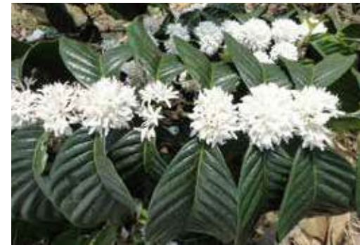
La fecundación del café Robusta se realiza por polinización cruzada mayores que las del café arábigo

Las flores individuales son completas, hermafroditas, pero no auto-fértiles como sucede con las flores de las variedades arábicas; esto significa que la fecundación de las plantas de café Robusta ocurre únicamente por polinización cruzada.