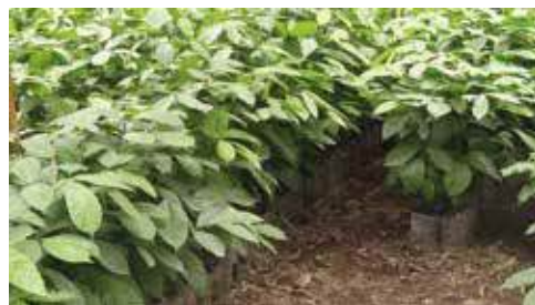
Utilizar plantas con características deseables garantiza el éxito futuro de las plantaciones