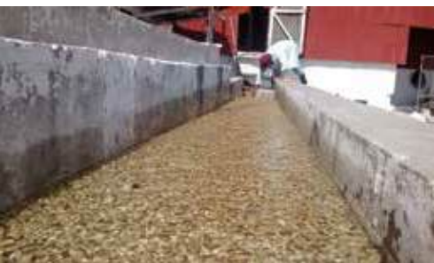
Lavado y clasificación final del café Robusta

las cuales tienen diferente capacidad de lavado. Posterior a este paso, el café es llevado a los canales de clasificación para realizar el último proceso, el cual consiste en separar los granos vanos y pulpa.