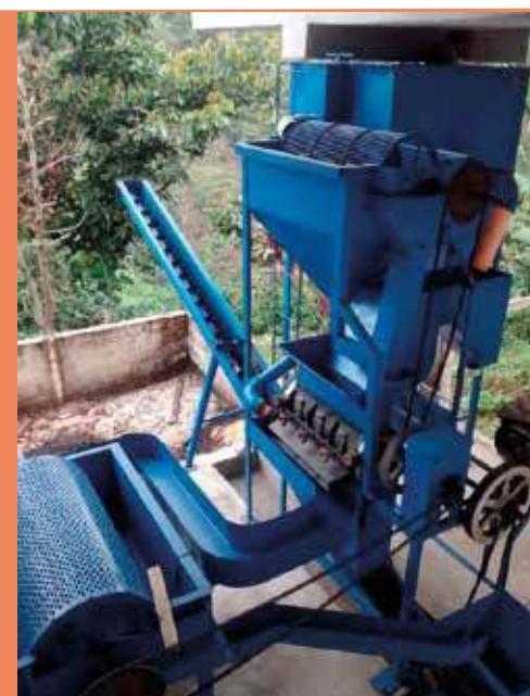
Extracción mecánica de pulpa

El lavado de café Robusta es un proceso difícil, debido a la mayor adherencia de la miel al pergamino. Por ello se recomienda, antes de su clasificación en el canal, pasar el café por un sistema mecánico de lavado a través de una lavadora mecánica de discos, una bomba hidráulica con una serpentina o una desmucilagadora. Cualquiera de estos sistemas va a facilitar la eliminación de la miel y permitirá obtener un pergamino limpio. El equipo comúnmente utilizado para este propósito son las lavadoras de discos,