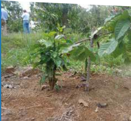
Esta práctica de manejo de tejido permite la formación de plantas que durante su período productivo se tratarán mediante "parras"

Primer año: es recomendable agobiar el primer año para formar plantas multiejes a través de la estimulación de los brotes, seleccionando los dos o tres más vigorosos, próximos al suelo y que estén separados entre sí, como mínimo de 25 a 30 centímetros. El eje madre o cola se elimina después de su primera producción o ensayo.