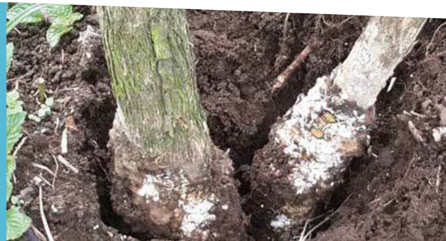
Debe realizarse un efectivo programa fitosanitario en el almácigo para llevar plantas libres de cochinillas a campo definitivo

Control: la implementación de actividades para el control de estos insectos es fundamental para minimizar o evitar el daño; dentro de ellas, se puede considerar la siembra de plantas de almácigo sano en el campo definitivo, la eliminación de malezas que pueden ser hospederos alternos y la aplicación de productos químicos dirigido a controlar la población de hormigas,