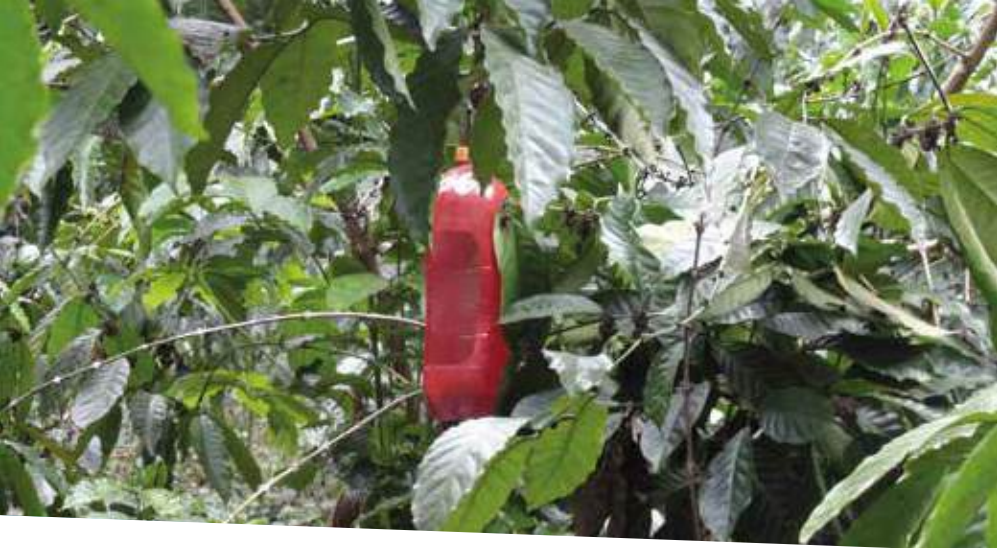
Las trampas deben ser colocadas inmediatamente al finalizar la cosecha y ser retiradas al inicio de las lluvias

del daño económico, lo cual se determina por un adecuado muestreo. El control químico se realiza utilizando productos insecticidas específicos, técnicamente recomendados para ser aplicados en forma focalizada y una sola vez. Dentro de estos productos están los formulados a base de Endosulfan 35% EC en dosis de 1.2 litros por manzana.