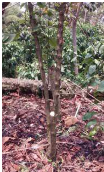
En este tipo de manejo se eliminan los ejes que son improductivos, manteniendo aquellos que tienen preparación para la cosecha