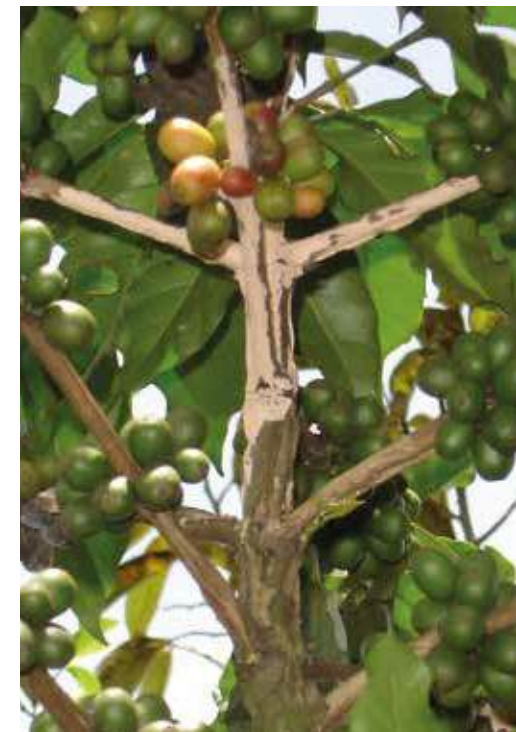
La mayor ocurrencia de esta enfermedad se presenta en lugares con lluvias frecuentes y ma anas soleadas

Control: el control preventivo se hace con aplicaciones de cal hidratada en el ahoyado,