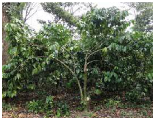
Este sistema de manejo permite contar con plantaciones con material productivo suficiente para producciones sostenibles

La plantación tipo "parra" se establece, siempre y cuando, los distanciamientos de siembra sean de 3 x 4 y de 4 x 4 metros.