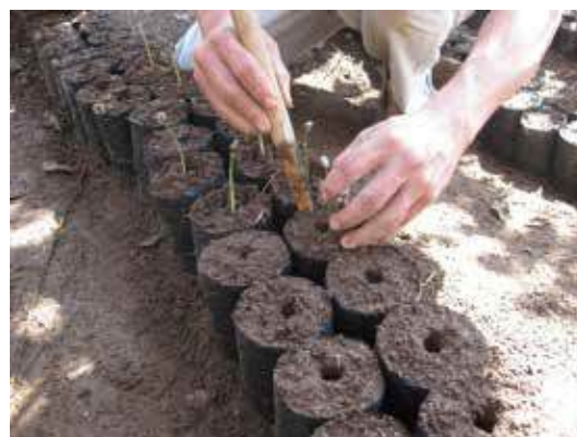
Trasplante de “soldaditos” a la bolsa

d. Trasplante a bolsa: se realiza cuando la planta está en estado de “soldadito”. Se deben seleccionar las plantas sanas, de buen tamaño, buena raíz, sin defectos y con la raíz pivotante recta. Al momento de la siembra en bolsa debe tenerse el cuidado de dejar el “cuello” de la planta al mismo nivel de cómo se encontraba en el semillero. Se recomienda podar la raíz pivotante para evitar que se doble en la bolsa durante su trasplante.