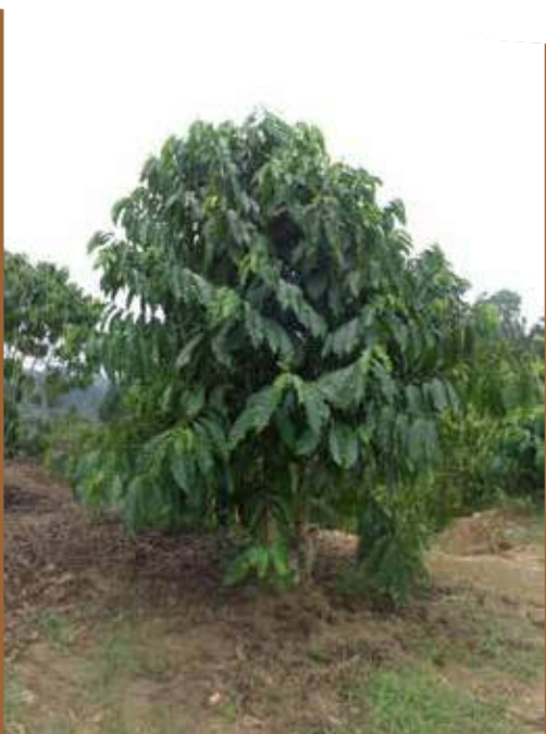
Planta de café Robusta con recepa

Las dimensiones de las hojas de una planta de Robusta son mayores que las