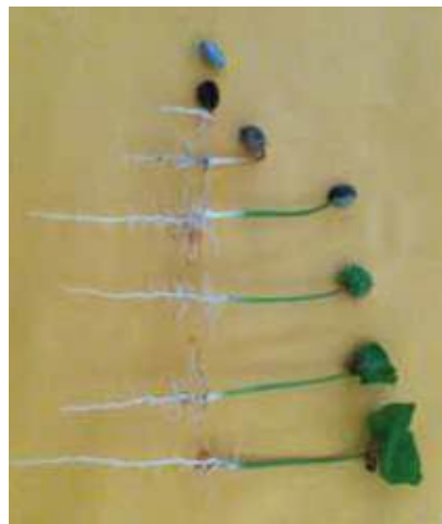
Fases de desarrollo de la semilla hasta el estado “mariposa”

de “mariposa”, la planta necesitará de energía externa para seguir creciendo y formar la nueva planta.