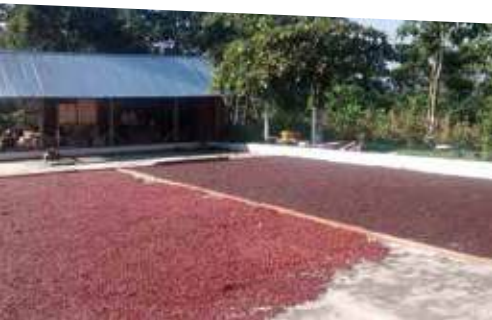
Secamiento de café “bolita” o “jocote” en patios

si se escucha un sonido parecido a un “chinchín” significa que este grano ya se encuentra en el rango de humedad recomendada.