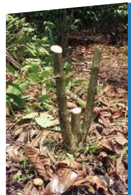
La recepa se justifica en cafetos que tienen poco tejido productivo debido a la edad y al agotamiento por producción

Este tipo de poda se sugiere realizarlo de manera anual, después del establecimiento en campo, como se describe a continuación: