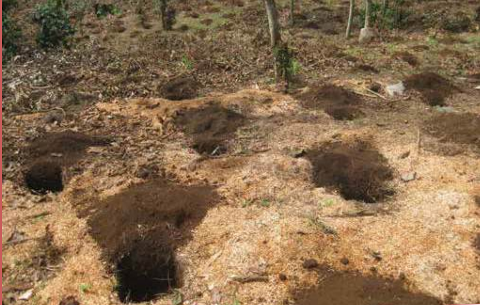
La dimensión del ahoyado depende de las condiciones de suelo y la necesidad de aplicar materia orgánica

Dependiendo del tipo de suelo, los hoyos pueden tener dimensiones variables que van desde 0.30 x 0.30 x 0.30, 0.40 x 0.40 x 0.40 hasta 0.50 x 0.50 metros.