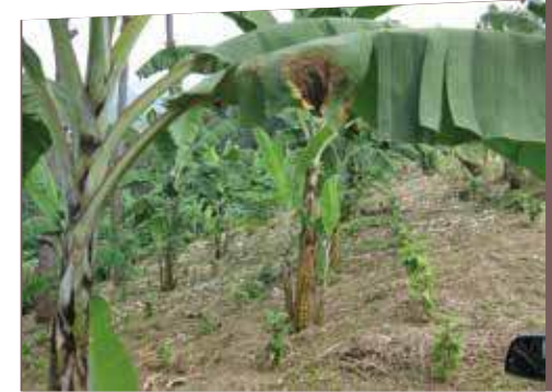
Las musáceas constituyen una buena alternativa como sombra temporal en el café Robusta

c. Permanente o definitiva: son plantas que, por sus hábitos de crecimiento y longevidad, conviven con los cafetales, proporcionándoles sombra durante todo el ciclo productivo.