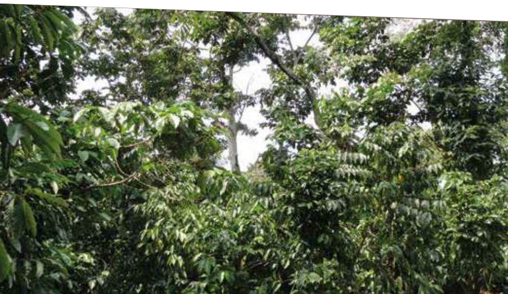
En ambas formas de realizar la poda, se persigue obtener uniformidad en la densidad y altura de los árboles de sombra

b. Mecanizada: se efectúa con moto podadora telescópica. Para esta forma de realizar la poda se necesita de personal capacitado en el manejo del equipo.