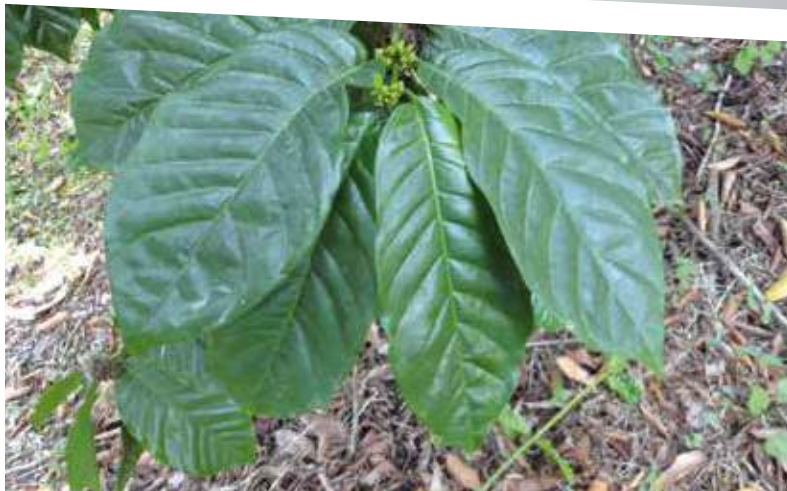
Las dimensiones de las hojas del café Robusta son mayores que las del café arábigo

de plantas de café arábigo. Suelen variar de 9.0 a 11.7 centímetros de ancho (promedio de 10.38 cm) y de 20.5 a 29.5 centímetros de largo (promedio de 24.5 cm).