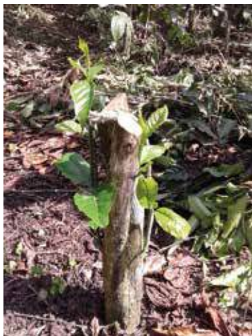
Recepa por planta en café Robusta