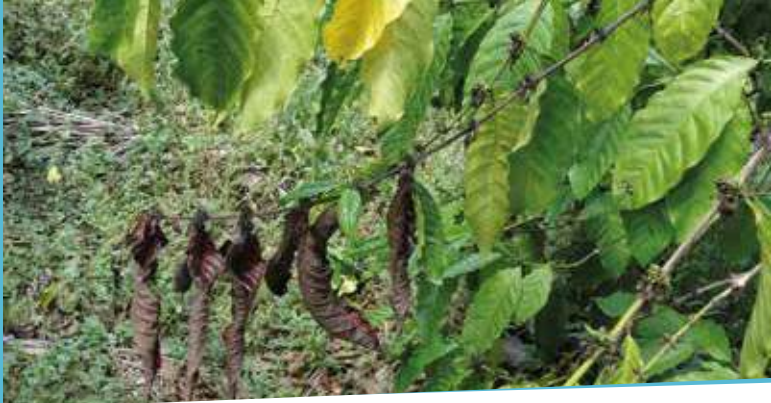
La infección se inicia en la parte terminal de las bandolas o ramas y avanza hacia el eje (tallo) central

durante los periodos favorables al desarrollo del hongo, principalmente en las fases fenológicas de pre-floración, post-floración y al inicio de desarrollo del fruto. Los productos recomendados se muestran en el cuadro 10.