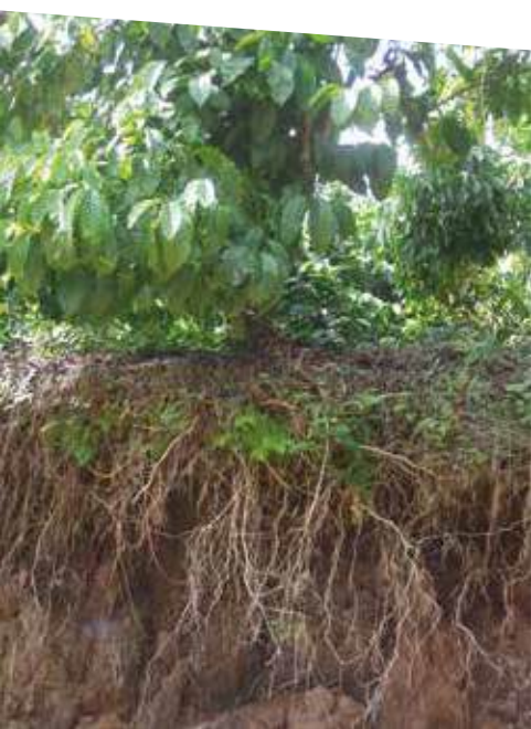
El sistema radicular del café Robusta es abundante