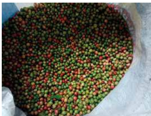
Granos de café inmaduros de la especie Coffea canephora

En cuanto al tipo de clasificadores, se recomienda utilizar los que requieren bajo volumen de agua con el propósito de hacer un uso adecuado del vital líquido y evitar la contaminación de las fuentes de agua.