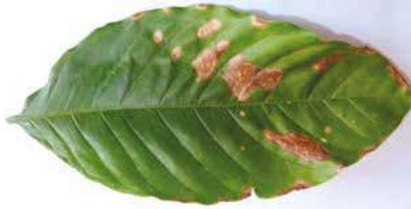
La falta de sombra en las plantaciones favorece el incremento del minador en verano

expuesta al sol en el verano, evitando el desombreado en esta época. Deben evitarse las aplicaciones de productos químicos ya que esta plaga es regulada por enemigos naturales, habiéndose ya identificado más de 10 enemigos naturales (parasitoides) que existen en el ecosistema natural.