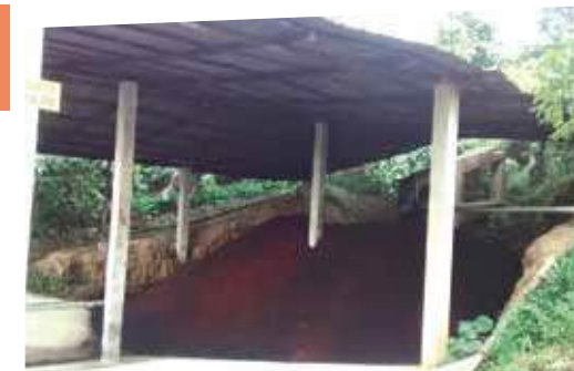
La pulpa constituye una fuente de materia orgánica importante en la caficultura

Lo más importante de estos subproductos generados en el procesamiento del grano, es que, si se tratan de adecuada manera, pueden convertirse en recursos importantes para fortalecer la nutrición de las plantas de café y mejorar las condiciones del suelo, particularmente por la cantidad de materia orgánica que representan.