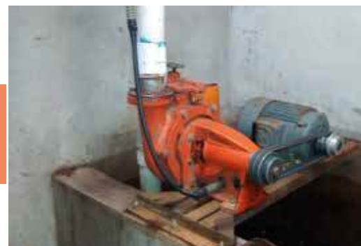
Bomba empleada para la recirculación del agua

El sistema convencional de recirculación de agua consiste en la construcción de una estructura llamada recolector decantador. Éste tiene la función de recolectar las aguas del despulpado y lavado de café con lo que se separan y decantan las partículas más pesadas que le restan eficiencia al proceso de bombeo; el agua bombeada regresa a las fases iniciales del proceso, mediante un circuito cerrado de tubería de material PVC.