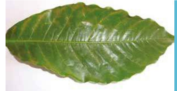
El ataque de esta plaga es común en plantaciones expuestas al sol y con altas temperaturas

Control: las lluvias son el principal factor de regulación de las poblaciones de esta plaga; además, no deben realizarse desombreados fuertes en la época de verano (enero – abril) ya que las plantaciones expuestas al sol y las altas temperaturas favorecen el desarrollo de estas arañas. Cuando los resultados de muestreos de esta plaga demuestran altas poblaciones de ácaros vivos, se realizan aspersiones de acaricidas, en focos. Puede utilizarse Dimectron (Dimetoato) en dosis de 350