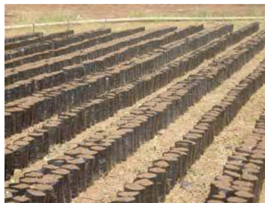
Con este arreglo de bolsas se obtiene buena penetración de luz y se facilitan las labores culturales

Con este arreglo se obtiene buena penetración de luz y se facilitan las labores culturales durante este periodo de desarrollo de la planta. El sustrato de la bolsa debe mantenerse suelto para favorecer la infiltración de agua y nutrientes aplicados al suelo, lo que se logra con aflojar la bolsa cuando se vea compactada. En lugares en donde exista limitación de agua para riego. Se puede enterrar la bolsa a una profundidad de 20% a 30% de su longitud..