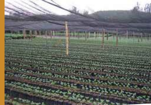
La alternativa de un almácigo sin sombra requerirá más cuidados, especialmente nutrición adecuada y riegos más frecuentes

realiza aplicando la solución a la bolsa con aspersora manual, sin boquilla y a baja presión, evitando el mojado de las hojas. Las fórmulas de fertilizantes se seleccionan en base a resultados del análisis químico del sustrato de la bolsa; en términos generales, se utilizan fórmulas ricas en fósforo para dar más oportunidad de desarrollo a las raíces de la planta. Las fórmulas más utilizadas son 20-20-0 y 18-46-0.