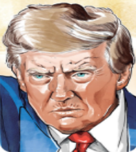
Ilustración: Henao Sierra

Donald Trump, virtual próximo presidente de EU, conquistó buena parte del voto latino apelando a las afectaciones económicas que les dejó la inflación. / 17