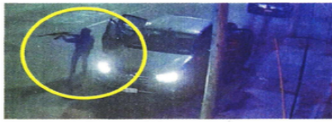
Los agresores fueron captados por una cámara, al momento de llegar al bar, ubicado en el centro de Querétaro.