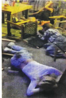
Hasta anoche se reportaban 10 muertos y 7 heridos.

Un video de la cámara de seguridad del establecimien-