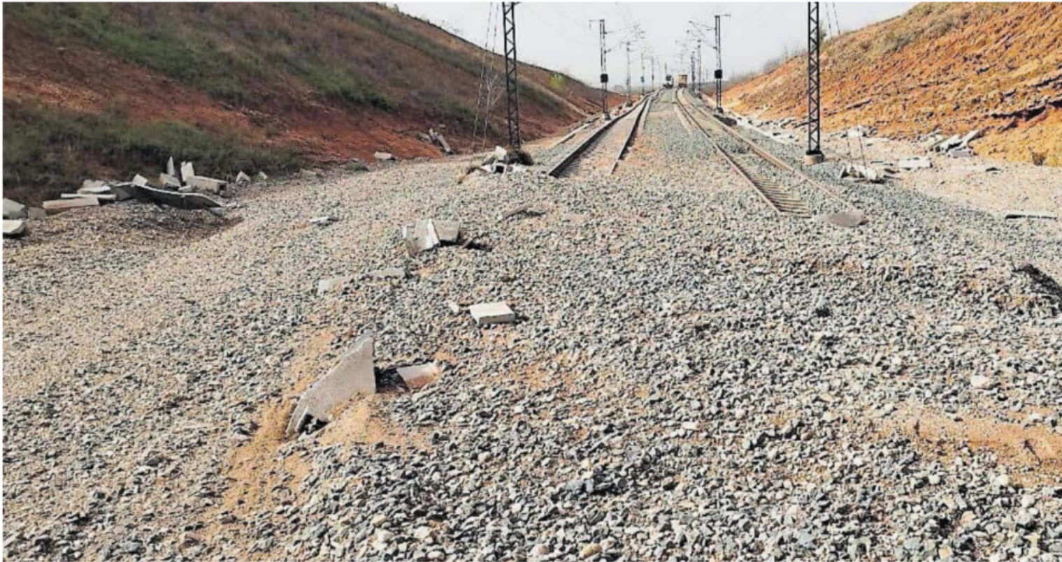
Vías de tren afectadas por la dana, en una imagen cedida por Adif.

Un ramillete de proyectos resilientes fue descartado o duerme en la vía burocrática, mientras los ingenieros urgen a reforzar lo que está en pie y a reformar la obra pública ante el cambio climático