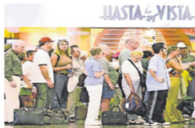
Entre diciembre de 2018 y septiembre de este año arribaron 63.6 millones de turistas estadounidenses.

Del total de estos visitantes, 64% o 63.6 millones de perso-