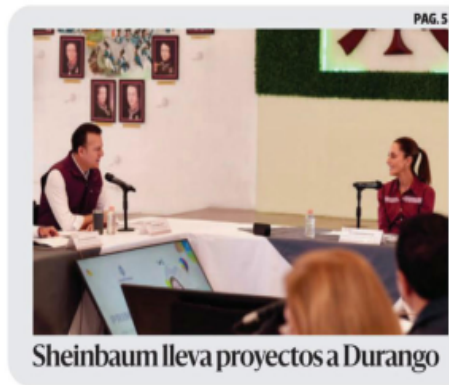
Sheinbaum lleva proyectos a Durango PAG. 5

Tras 87 años de su creación, la Secretaría de la Defensa Nacional, cambió su acrónimo para pasar a "Defensa", con la finalidad de resaltar su principal objetivo: el acompañamiento del ejército. Se informó que con autorización de la Presidenta de la República, el acrónimo fue sustituido y permitirá a la sociedad e instituciones nacionales e internacionales, tener más claridad de la función principal, así como una mayor comprensión y coordinación de todas las actividades que se realizan en beneficio de los mexicanos. PAG. 5