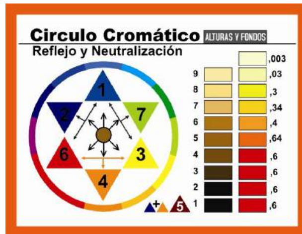
Figura 3. Círculo cromático.

Por ejemplo, cuando se mezclan los colores en diferentes proporciones, se logra un matiz desde el color naranja hasta el amarillo; así también se presenta con los demás colores.